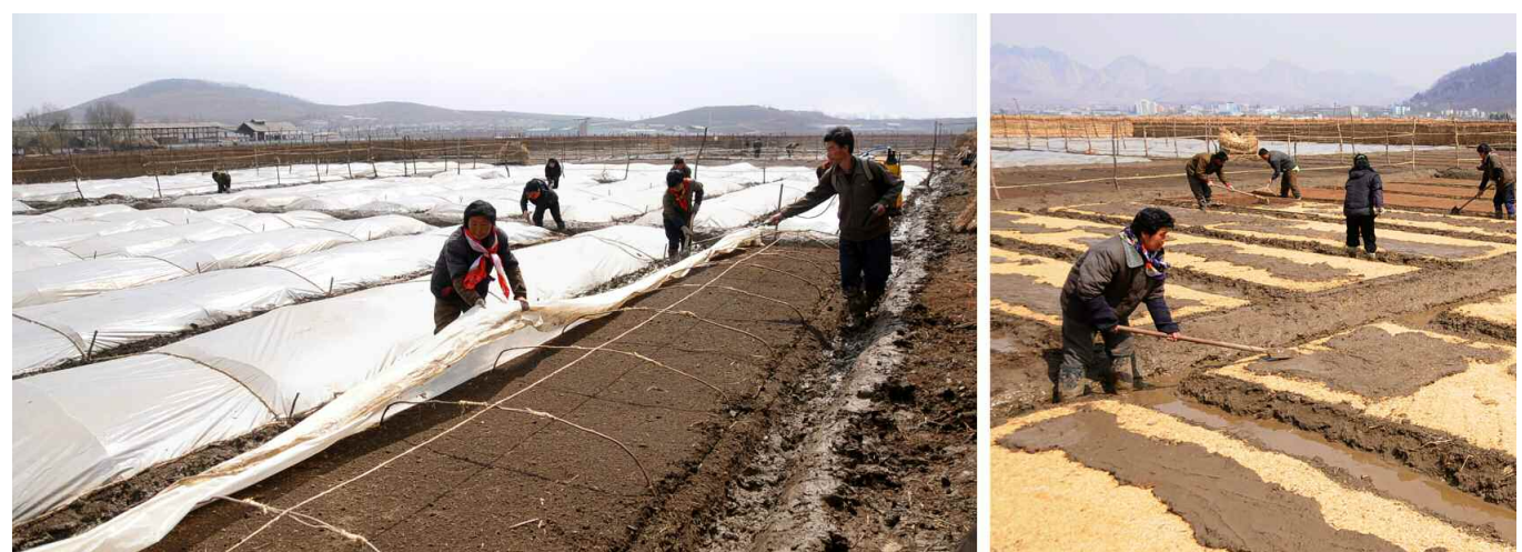
당이 제시한 알곡생산목표를 기어이 점령할 한마음으로 영농작업을 기술적요구대로 하고있다. -사리원시 미곡협동농장에서-

산불을 방지하는 사업은 해당 부문의 일군들과 근로자들의 노력만으로 할수 없다. 각지 당 및 근로단체조직들에서는 모든 당원들과 근로자들이 주인다운 자각을 가지고 산불을 미리 방지하기 위한 사업에 자각적으로 떨쳐나서도록 하여야 한다.