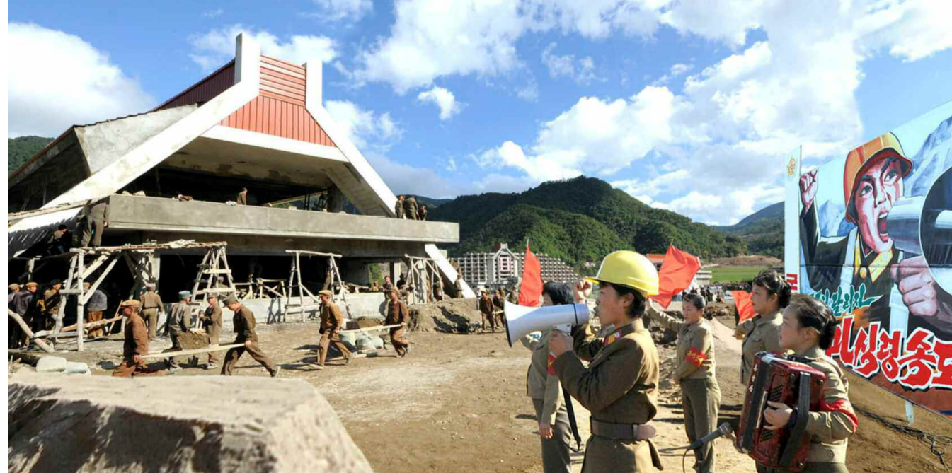
마식령스키장건설에서 화선선전, 화선선동의 불길이 세차게 타오르고있다. 화선선전건설사업의 위력으로 화선선동의 불길이 세차게 타오르고있다. 화선선전건설사업의 위력으로 화선선동의 불길이 세차게 타오르고있다.

건설지휘부와 부대, 구분대 정치일군들이 벌리는 힘있는 화선선전, 화선선동으로 하여 《마식령속도》창조의 불길이 더욱 세차게 타오르는 속에 완공의 날은 더욱더 앞당겨지고있다. 글 본사기자 전경서