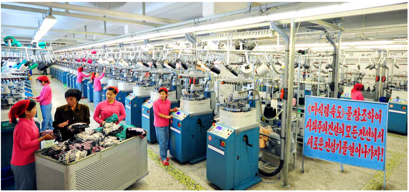
3.4분기인민경제계획을 빛나게 완수한 기세로 생산에 더 큰 박차를 가하고있다. -평양양말공장에서-

공장의 로동계급은 올레인민경제계획을 이김없이 수행할데 대한 신념의 진두적역량을 결사관철하기 위해 치열한 생산투쟁을 벌려왔다. 그들은 식탄이 미처 보장되지 못하고 원료수송이 잘되지 않을 때에 는 수심터 떨어진 곳까지 달려가 치열한 생산투쟁을 벌려 결된