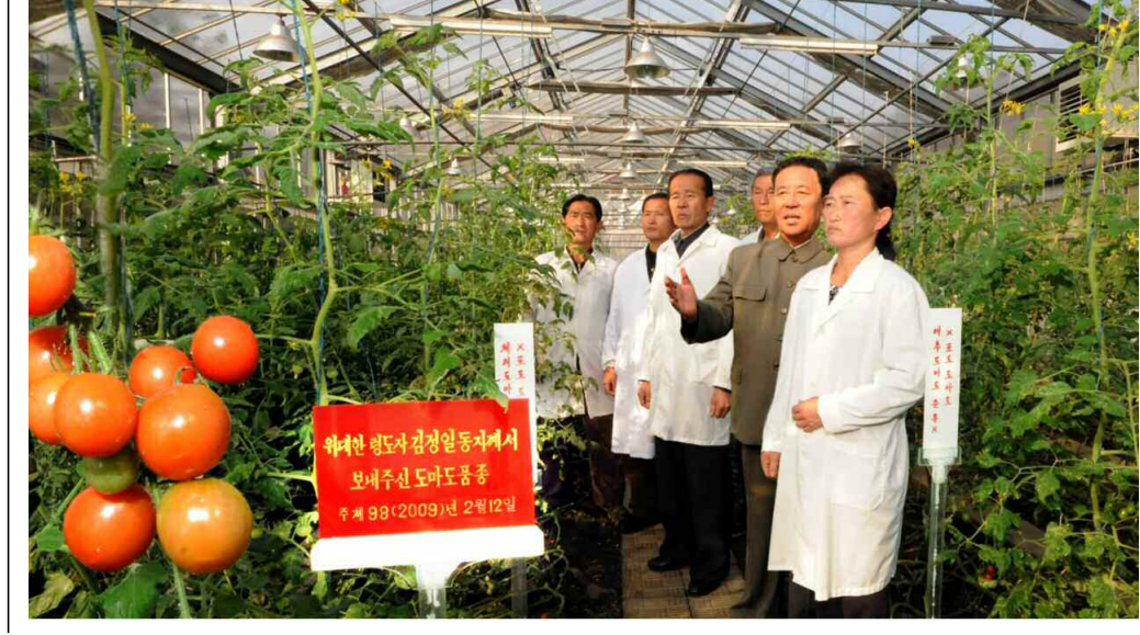
어버이장군님 김정은동지께서 보내주신 도마도종주 주제 98(2009)년 2월 12일

영원히 인민들과 함께 계신다. 한치의 흔들림도 없고 추호의 양보도 없을 수령영생의 확고부동한 진리를 우리 군대와 인민의 심장속에 깊이 새겨주는 바로 여기에 가요 《장군님은 태양으로 영생하신다》와 《그리움은 끝이 없네》가 가지는 특별한 사상예술적전파력과 철학성이 있는것이다. 이 강산 밝히는 해빛처럼 누리에 그 미소 찬란하다 인민 위해 바치신 어버이사랑 무궁토록 빛을 뿌린다 장군님은 우리와 함께 계시며 태양으로 영생하시리라 ... 우리 군대와 인민은 대를 두고 전해갈 영생의 노래들에 찬미년 변함없을 깨끗한 총정의 마음을 살고있으며 경애하는 김정은동지께서 위대한 장군님의 유흔을 받들어 혁명의 한걸음 가고갈것이다. 본사기자 리남호