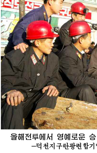
올해전투에서 영예로운 승리자가 되도록 탄부들을 적극 고무추진하고있다. -덕천지구관할련합기업소 형봉탄광 출광에서- 본사기자 적음

하지만 당조직들은 격동적인 현실의 요구에 맞게 유훈관철의 불길은 더 활활 지펴올리