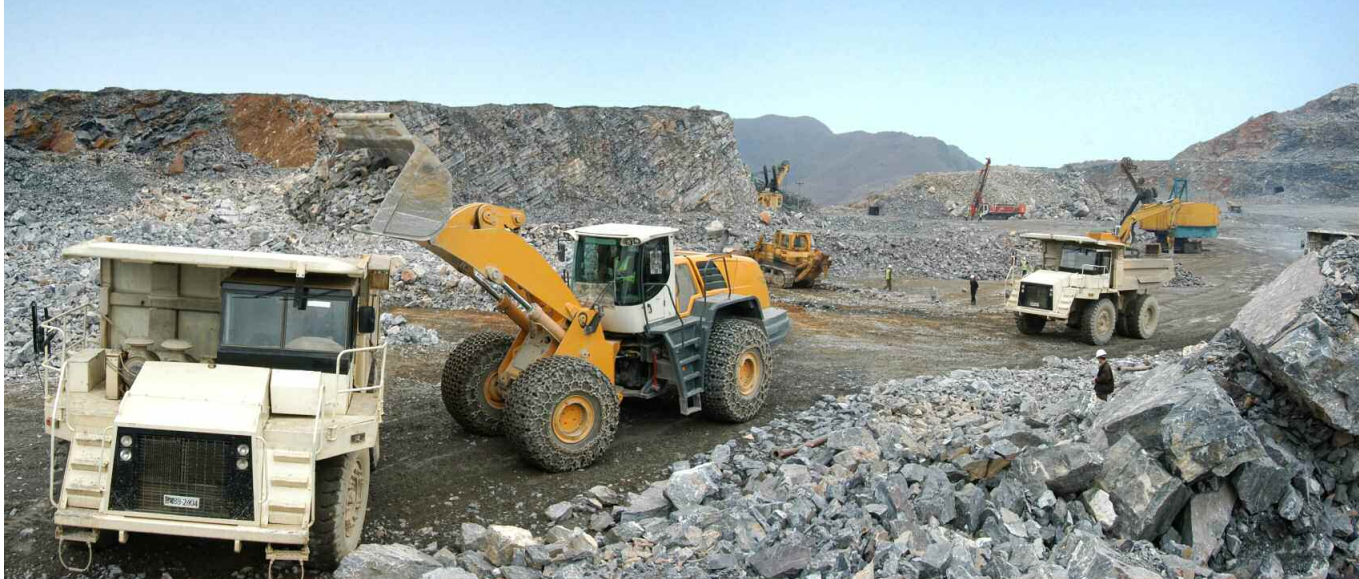
상원석회석광산의 로동계급이 연간계획을 완수한 기세드높이 생산물력전을 힘있게 벌리고있다.