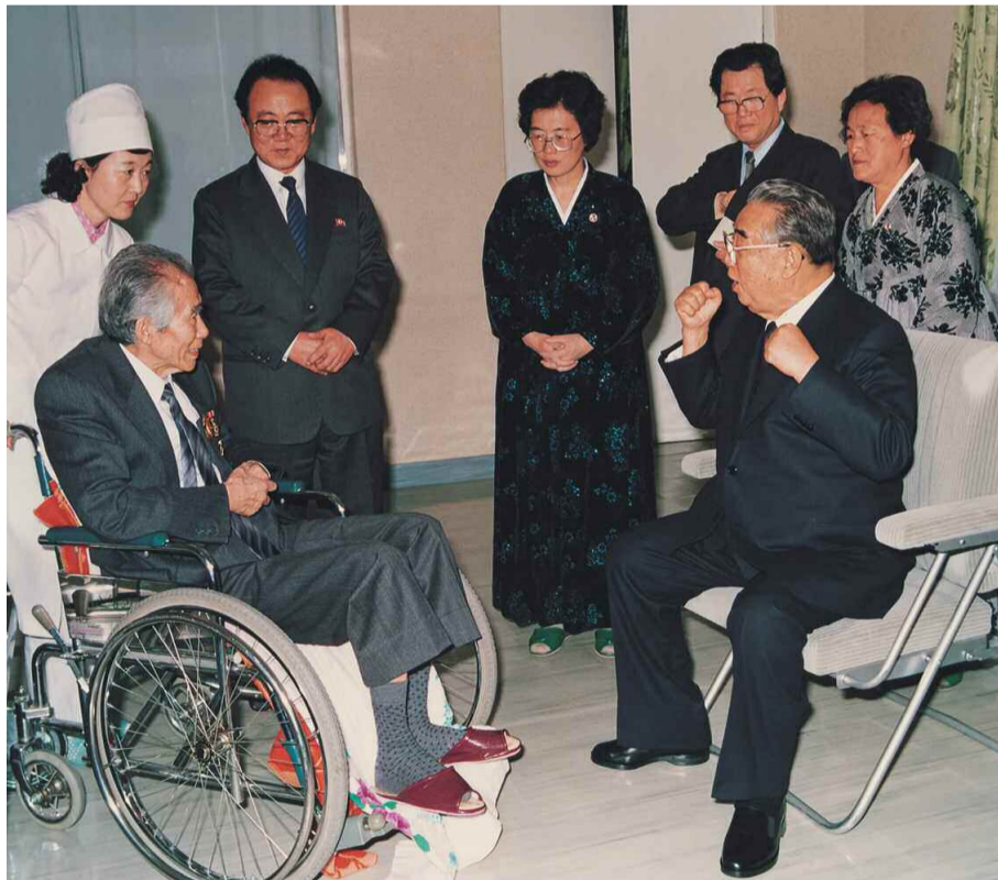
→ 통일애국투사 리인모와 담화하시는 위대한 수령 김일성동지 주체 82(1993)년 4월