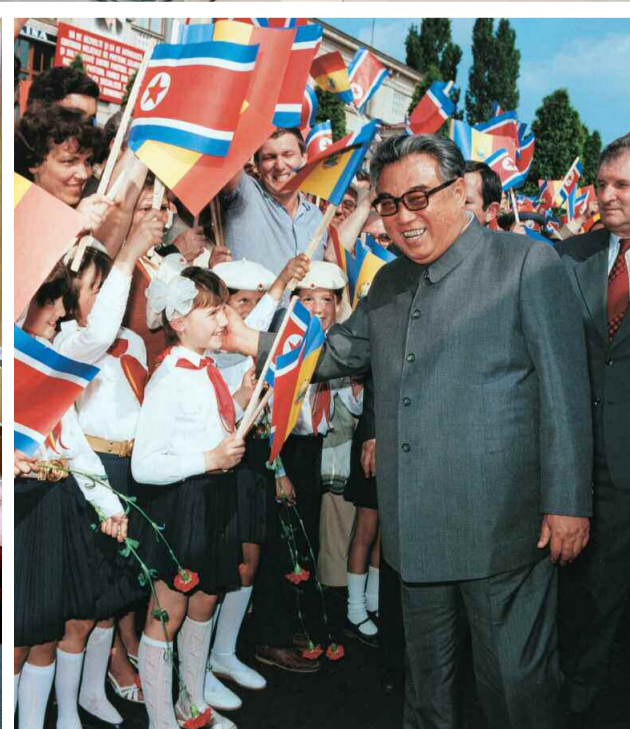
외국방문의 길에서 열렬한 환영을 받으시는 위대한 수령 김일성동지