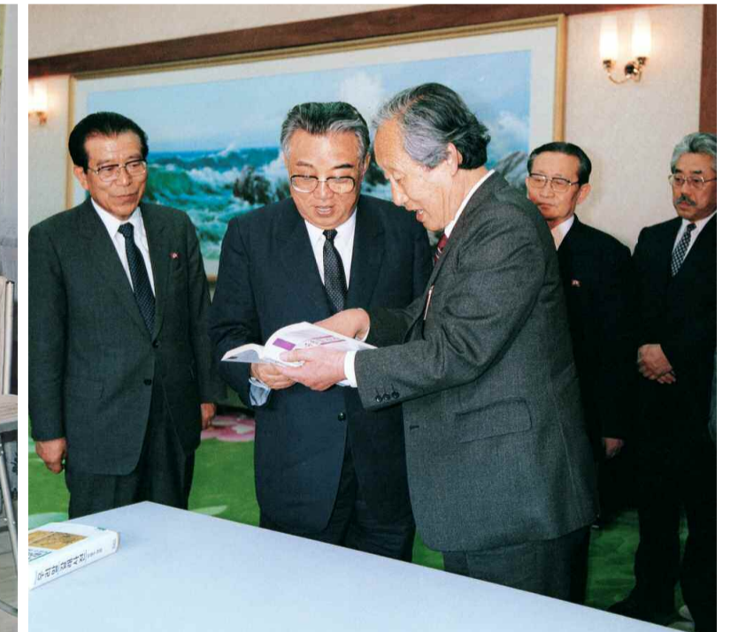
남조선의 문익환목사를 접견하시는 위대한 수령 김일성동지 주체 78(1989)년 3월