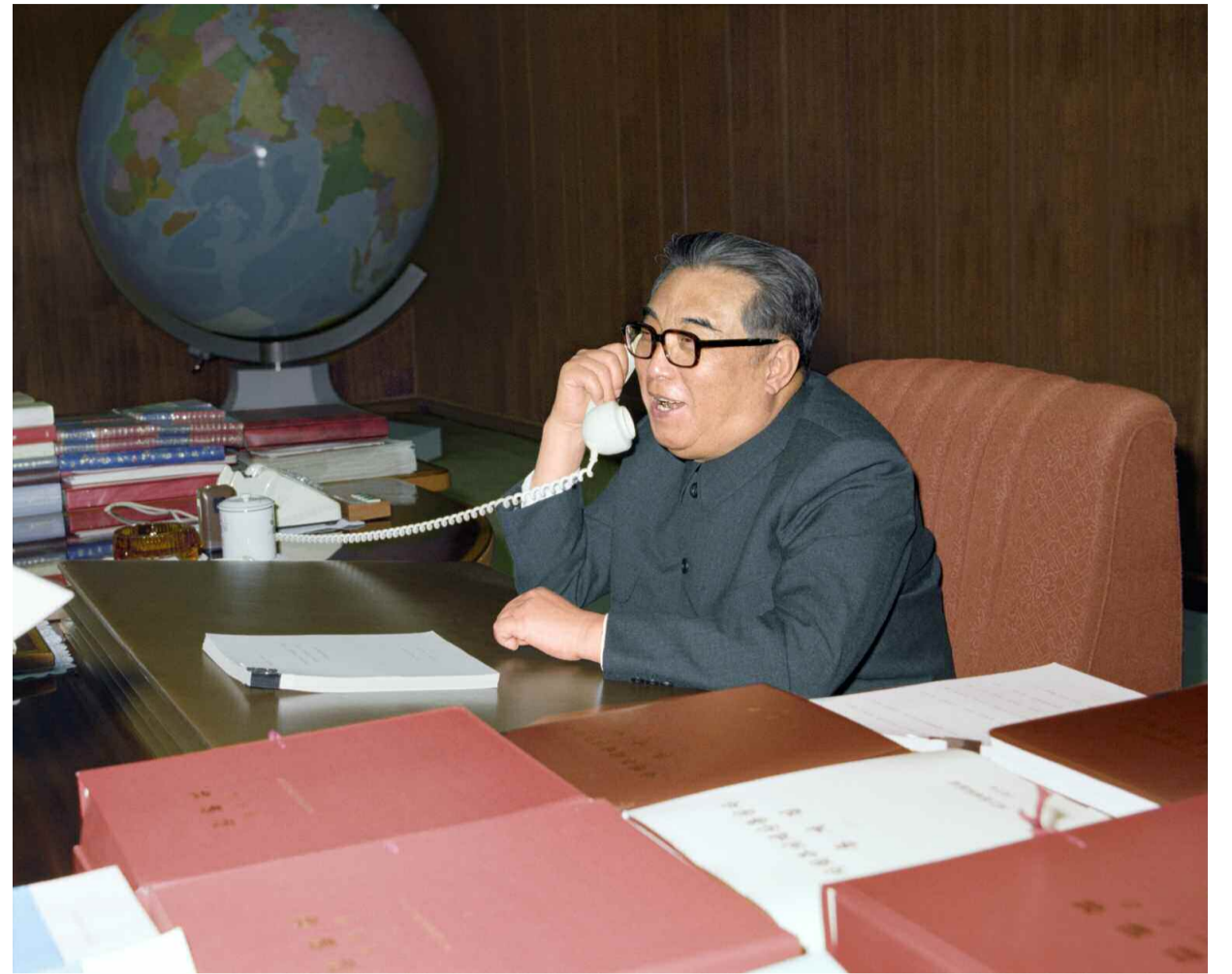
↑ 세계자주화위업에 불멸의 로고를 바치시는 위대한 수령 김일성동지 ← 혁명의 성산 백두산에 오르신 위대한 수령 김일성동지 주체 78(1989)년 8월