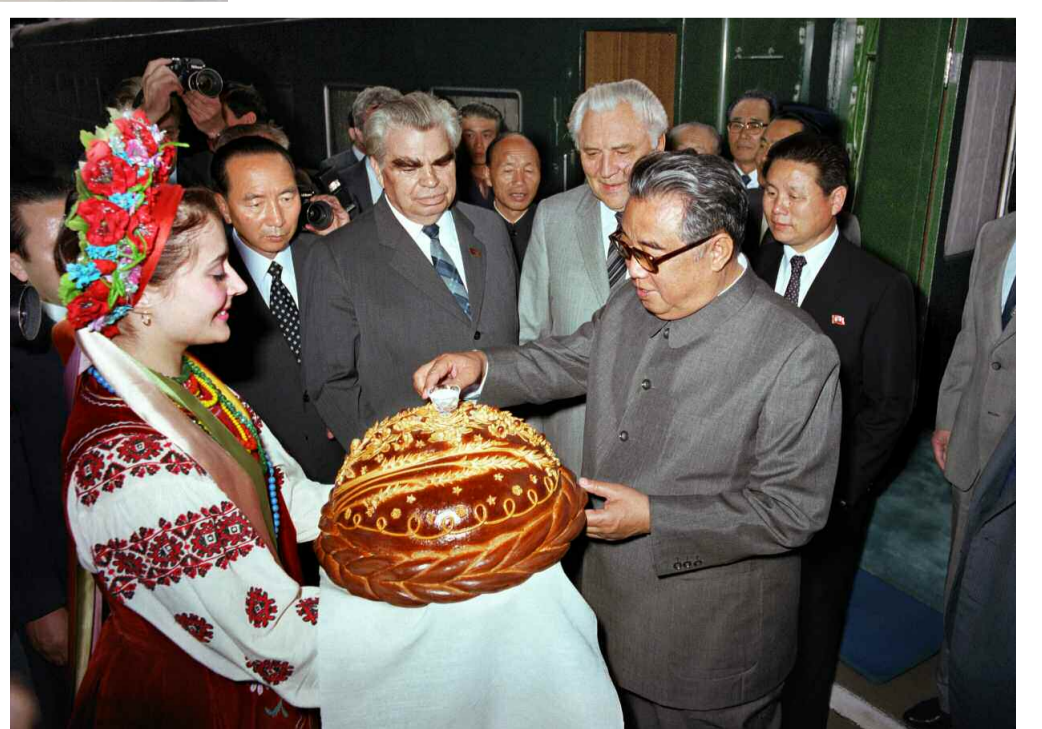
쏘련인민들의 열렬한 환영을 받으시는 위대한 수령 김일성동지 주체 73(1984)년 6월