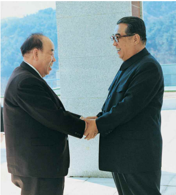
← 한덕수 총련 중앙상임위원회 의장을 만나주시는 위대한 수령 김일성동지 주체 69(1980)년 3월