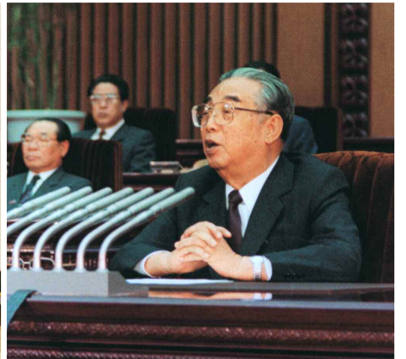
조국통일을 위한 전민족대단결 10대강령을 발표하시는 위대한 수령 김일성동지 주체 82(1993)년 4월