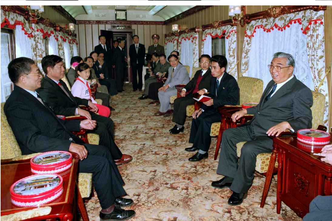
중국방문의 길에서 안내일군들과 담화하시는 위대한 수령 김일성동지 주체 78(1989)년 11월