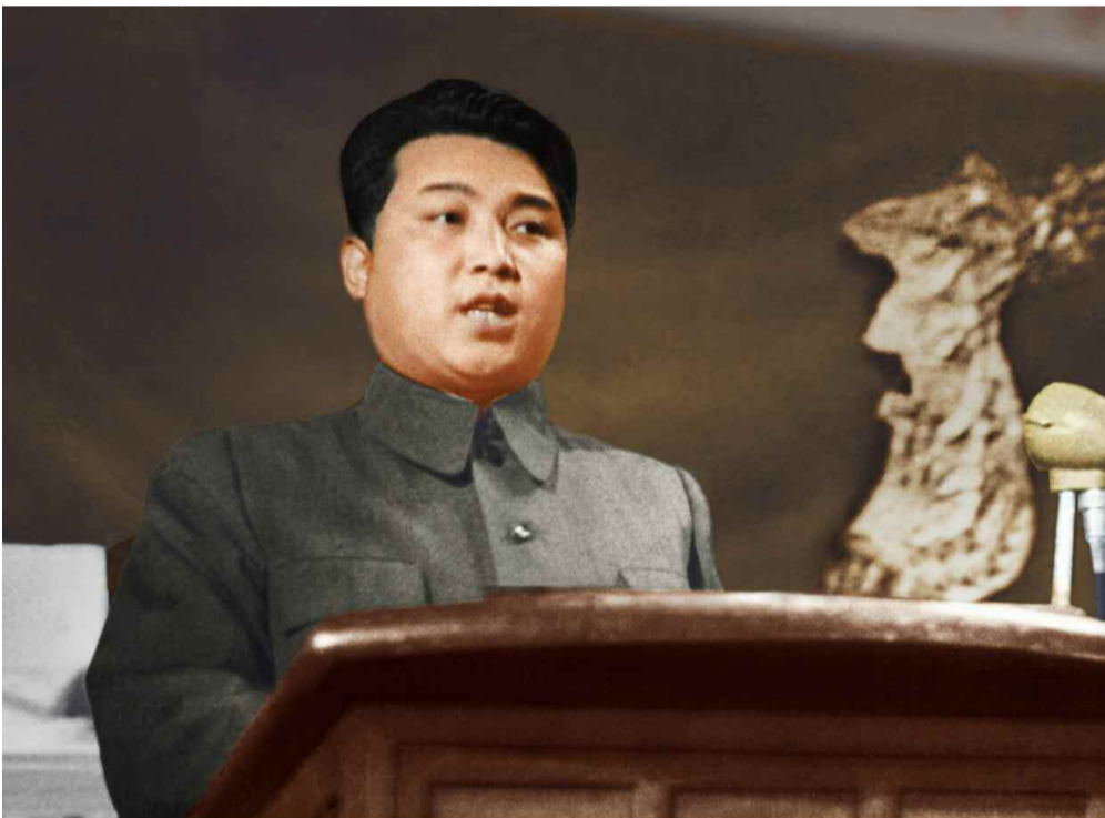
남북조선 정당, 사회단체 대표자련석회의에서 보고하시는 위대한 수령 김일성동지 주체 37(1948)년 4월