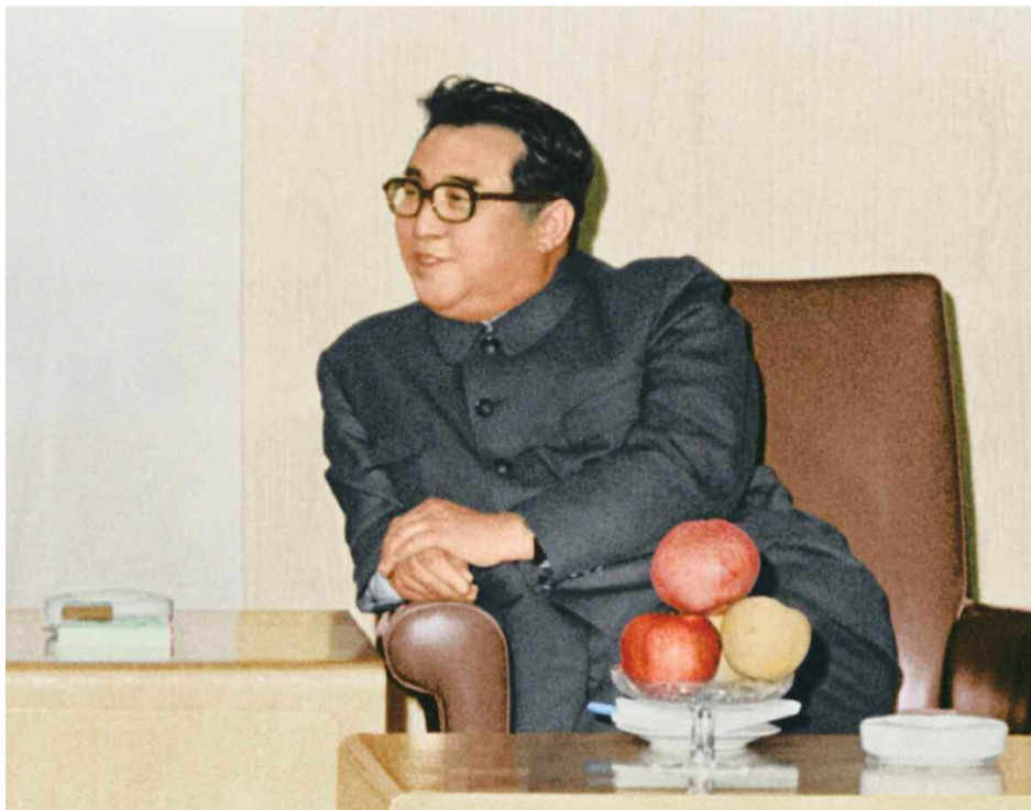
북남고위급정치회담에 참가한 남조선대표단을 접견하시면서 조국통일 3대원칙을 전명하시는 위대한 수령 김일성동지 주체 61(1972)년 5월