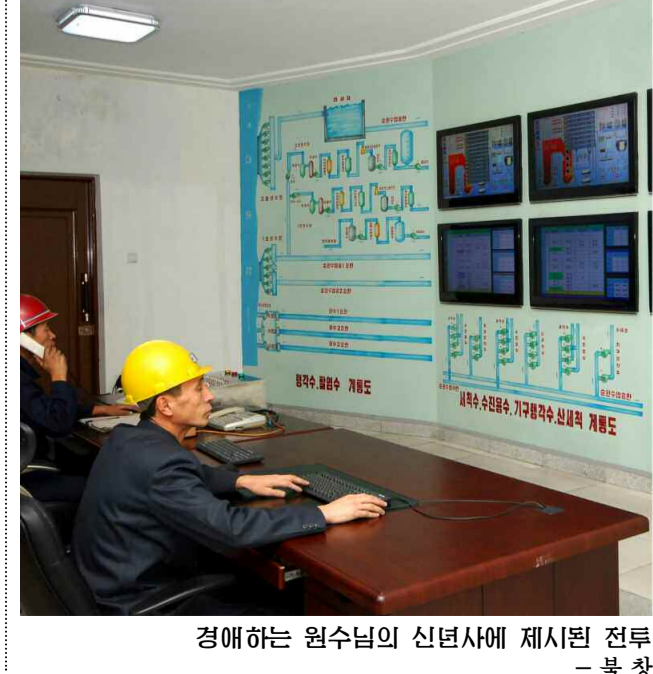
경제하는 원수님의 신년사에 제시된 전투적과업을 높이 받들고 집단적혁신의 불길높이 전력생산투쟁을 힘있게 벌리고있다. -북창 화력발전련합기업소에서-