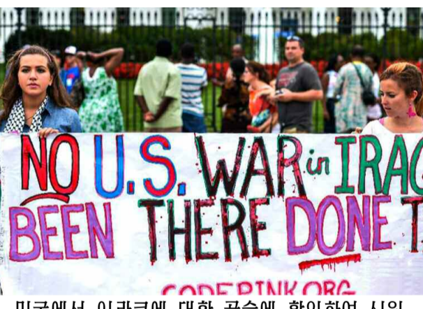
미국에서 이라크에 대한 공습에 항의하여 시위

미국에서 이라크에 대한 공습에 항의하여 시위... (이 부분은 이미 제공된 텍스트와 유사하게 보충된 내용을 포함합니다.)