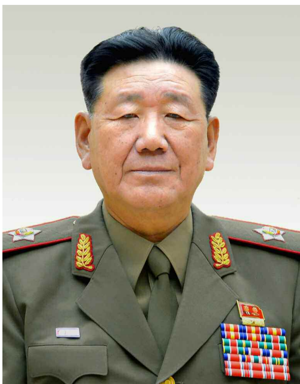
조선민주주의인민공화국 국방위원회 부위원장 황병서동지