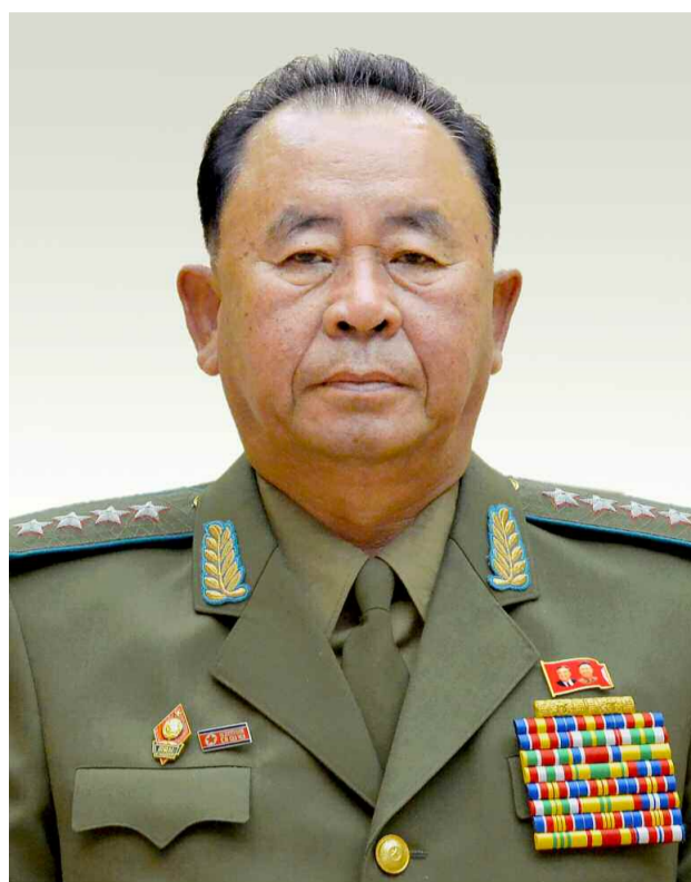
조선민주주의인민공화국 국방위원회 위원 리병철동지