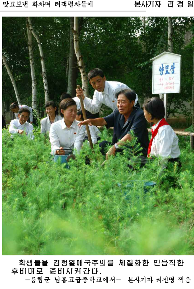
학생들을 김정일애국주의를 체질화한 믿음직한 후비대로 준비시켜 간다. -룡림군 남동고급중학교에서-