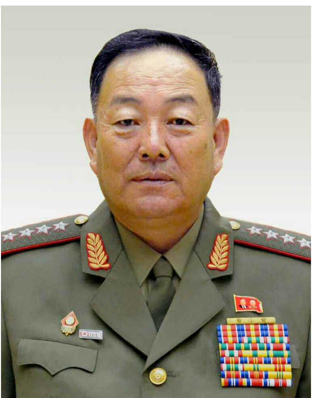
조선민주주의인민공화국 국방위원회 위원 현영철동지