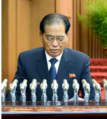
교육사업을 중요한 국사로 내세우고 하루빨리 이 땅위에 세계를 앞서나가는 부강조국을 반드시 일떠세우시려는 경애하는 김정은동지의 철석같은 신념과 의지를 온 세상에 힘있게 파시한 력사적사건입니다.

경애하는 김정은동지께서는 나라의 발전에 확고히 담보할수 있게 교육체계를 재정비하며 교육부에서 오래동안 굳이내려온 주립식, 암기식 교육방법도 대신적인 내용을 대담하게 바꾸고 깨우쳐주는 교수방법을 전면적으로 구현할데 대한 혁명적인