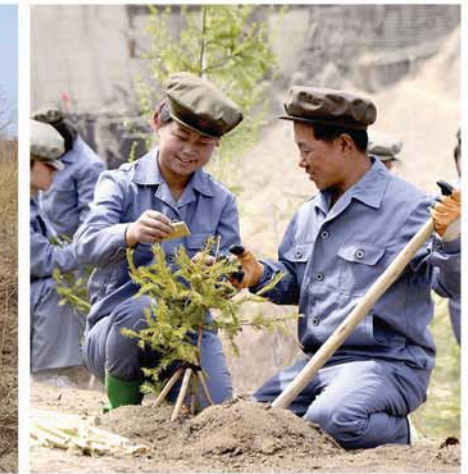
뜨거운 애국의 마음안고

골재수송을 맡은 운전수들은 높이가 1 000여m를 헤아리는 백암령을 비롯한 수많은 령길들을 달리고 또 달리었다.