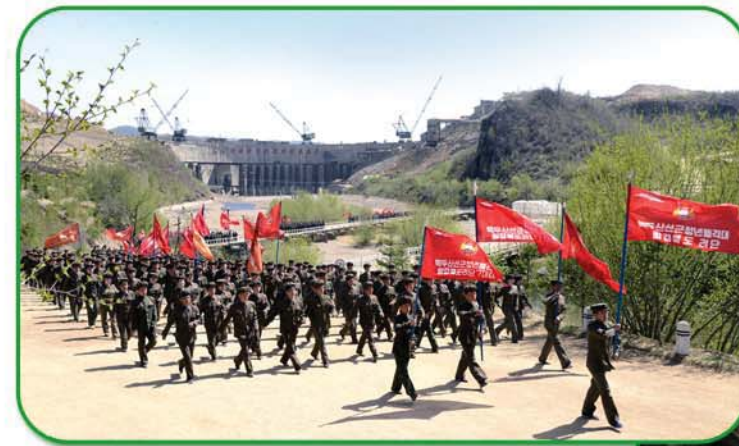
청춘의 량만은 발전소건설장 곳곳에도

였다. 어제 세웠던 기록이 오늘은 낡은것으로 되고 새롭게 갱신되는 혁신이 분과 초를 다투며 일어났다. 뿐만아니라 새로운 기술혁신안들이 련이어 창조되어 공사기일을 최대로 앞당기고 건설물의 질을 높이었다. 누구나 건설속도를 앞당기기 위해 일하면서 연구하고 연구하면서 일하는 등 그야말로 초인간적인 격전을 벌리었다. 자기들이 맡은 구간을 끝내면 다른 구간에 달려가고 또 그것을 끝내면 련이어 달려가 일하고일하는것이