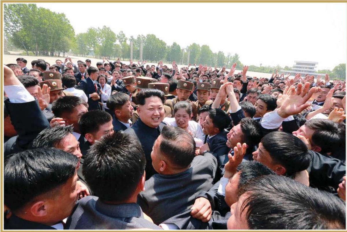
제2차 전국청년미풍선구자대회 참가자들속에 계시는 경애하는 김정은동지 주체104(2015)년 5월