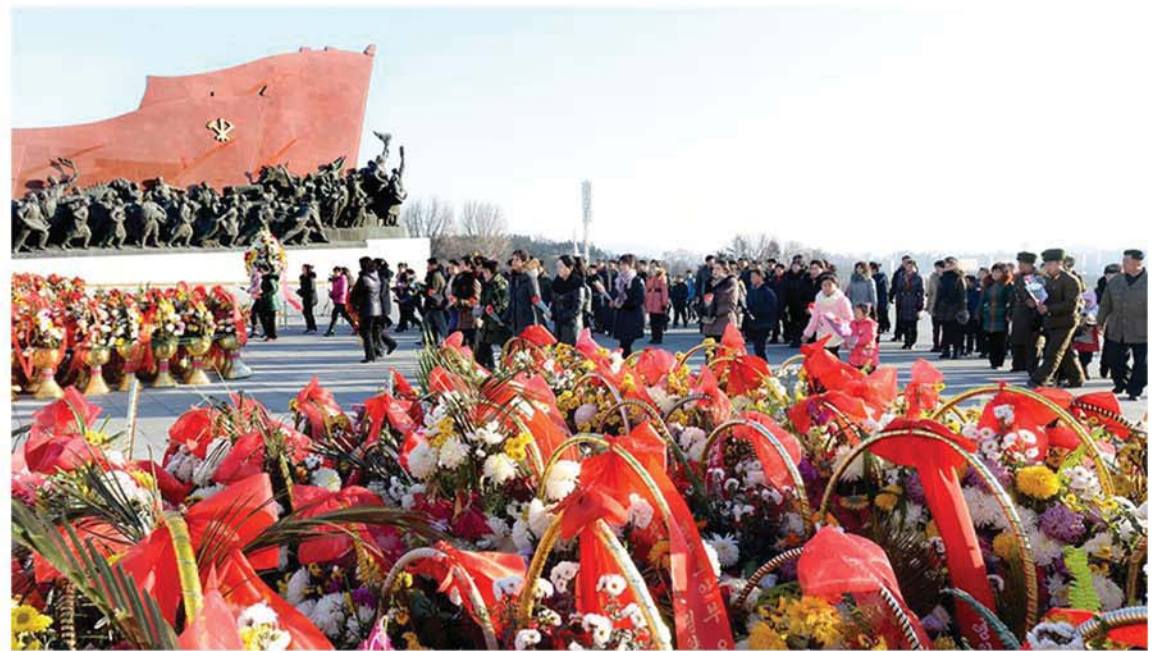
조국인민들은 새해를 맞으며 위대한 수령님들의 동상을 찾는다.

각곳에 있는 조선옷점과 급양봉사망들 또한 분망하다. 조선옷점의 재단사, 재봉공들은 주문자들이 새해에 입고 나설 조선치마저고리와 조선바지저고리를 만드느라 여념이 없고 급양봉사망 봉사자들은 민족의 향기가 넘친