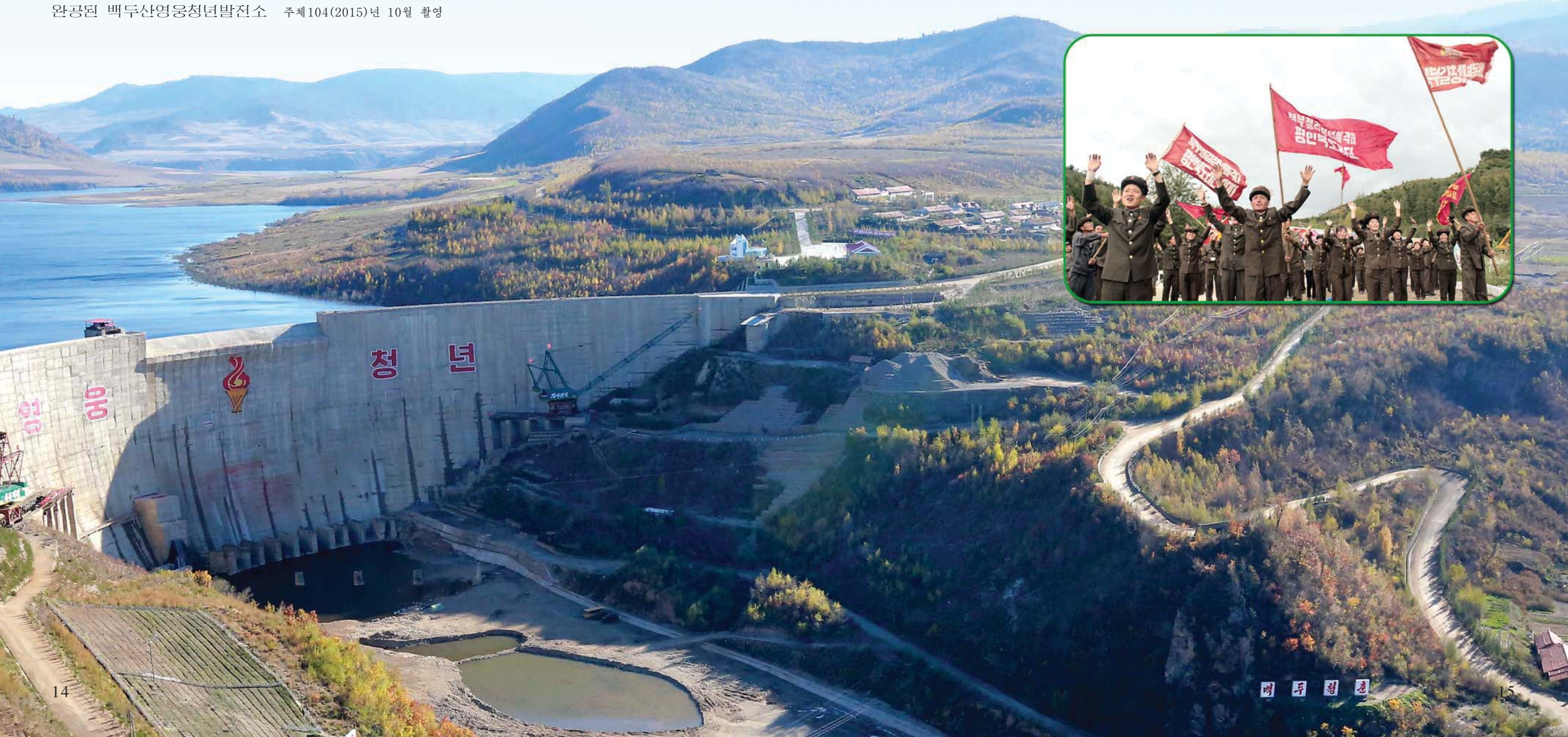
완공된 백두산영웅청년발전소 주체104(2015)년 10월 촬영