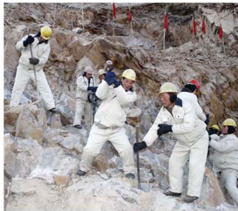
건설장은 계절을 몰랐다.