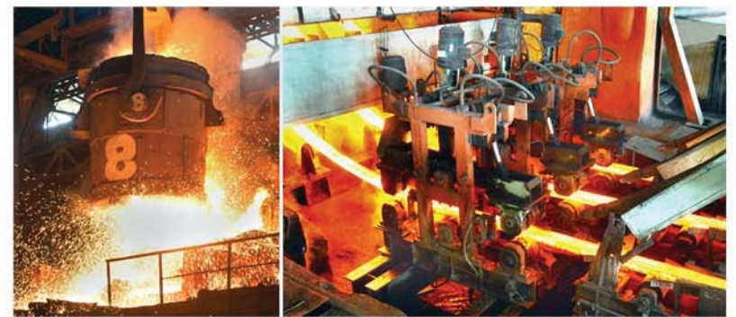
천리마제강련합기업소에서 생산적양양을 일으킨다.