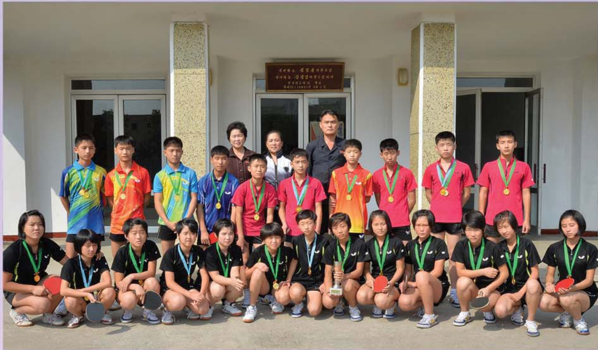
우승의 기쁨을 안고