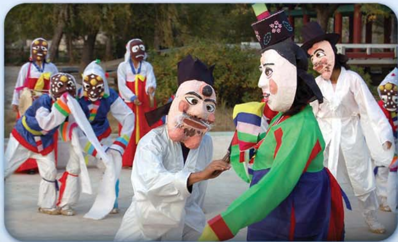
은률군 농장원들이 출연하는 《은률탈춤》

들어서니 읍지구에 훌륭히 꾸려진 공원에서 농장원들이 추는 탈춤이 한창이었다.