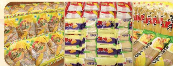
공장에서 생산된 제품의 일부 (↑)

곳곳에 꾸러진 강냉이전문식당들에서 봉사하는 여러가지 강냉이음식들은 인민들의 호평을 받고있다. (→)