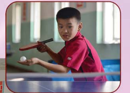
훈련을 맹렬히 벌리고있는 소조원들