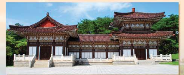
동명왕릉 제당의 외부