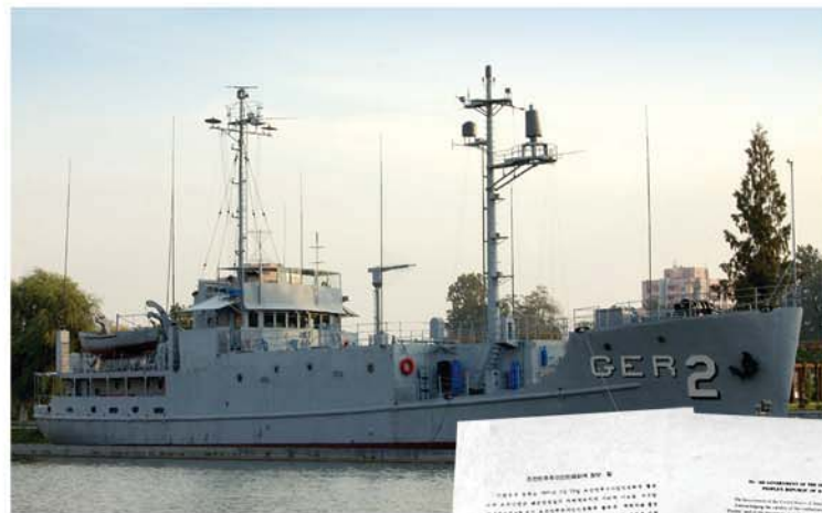
간첩행위를 인정하고 자백서를 쓰는 미제무장간첩선 《푸에블로》호의 함장(우)과 사죄문에 서명하는 미륙군 소장 길버트 에이치. 우드워드(아래)