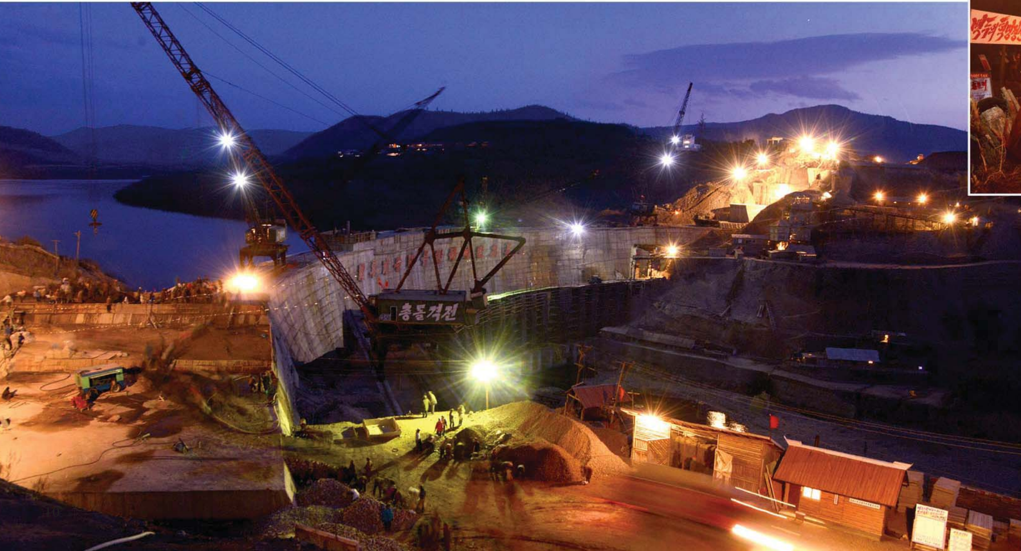
잠들줄 모른 백두산영웅청년발전소건설장 주체104(2015)년 촬영