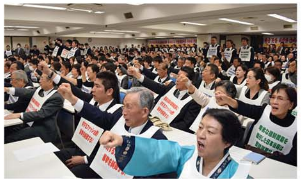
총련에 대한 일본경찰당국의 탄압책동을 규탄하는 재일동포들

바로 일본당국은 이 행사를 파탄시켜 총련의 영상을 흐리게 하고 총련을 《위법단체》, 《범죄단체》로 몰아 일본사회에 반총련, 반조선인적대분위기를 더한층 고취하려고 하였던것이다.