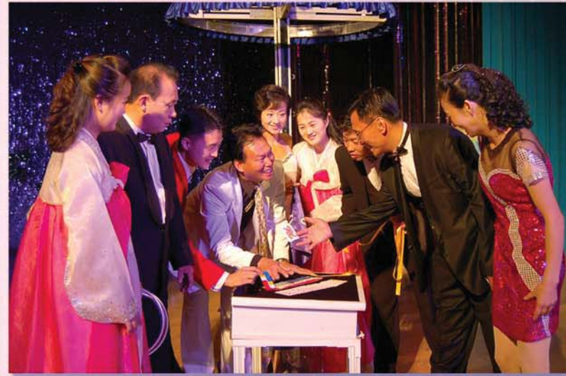
새로운 작품창작을 위해

그는 창작의 여가시간에는 시대정신이 민감한 작품들을 높은 기교로 형상해내도록 배우들의 작품지도도 성실히 해주고있다.