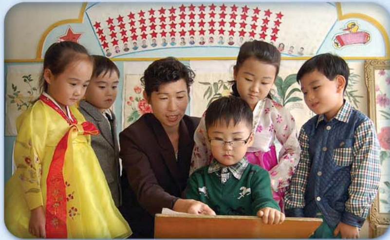
미술신통들이 자라난다. (은률군 은률유치원에서)

얼마전 우리는 중국 흑룡강성 다. 조선의 6대명산중의 하나인 구월산이 바라보이는 은률읍에