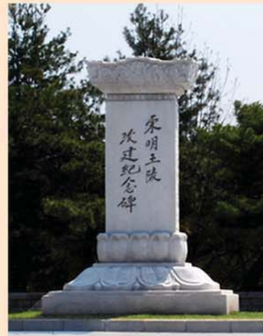
위대한 수령 김일성동지의 친필비 《東明王陵改建記念碑》 (동명왕릉개건기념비)

의 야금 및 금속공예기술의 높은 발전수준을 뚜렷이 보여줍니다. 더우기 왕관의 장식품이었던 보요는 이 무덤의 주인공이 살아있을 때 왕관을 썼던 사람이라는것을 명백히 실증해줍니다.