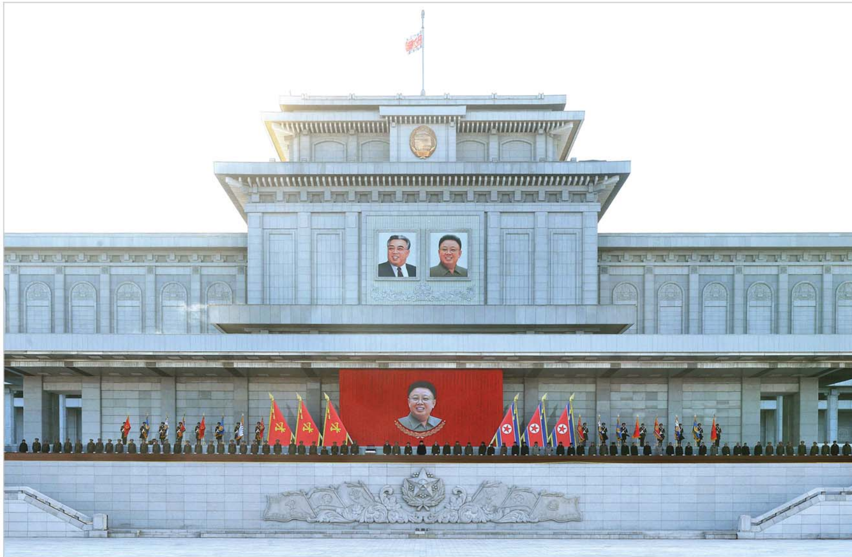
위대한 령도자 김정일동지 서거 3돐 중앙추모대회에 참석하신 경애하는 김정은동지