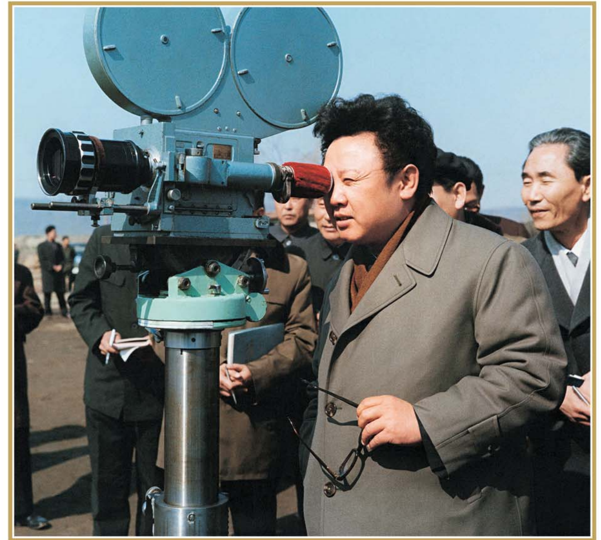
예술영화 《안중근 이등박문을 쏘다》의 촬영을 현지에서 지도하시는 위대한 령도자 김정일동지 주체68(1979)년 3월