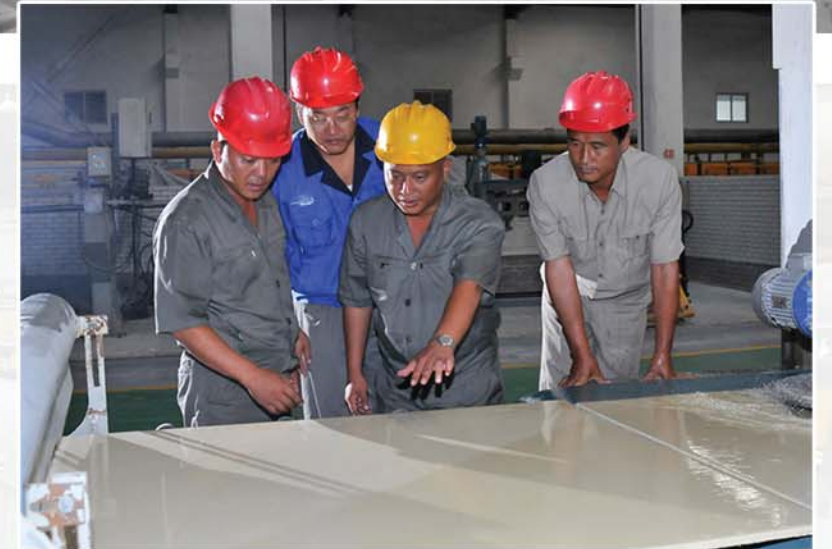
제품의 질을 높이기 위해

천리마타일은 크기와 형태, 색깔과 문양이 다양하고 방수와 차열기능 등을 갖추고있으며 평면 및 직각허용수치, 수축률, 강도, 랭견딜성을 비롯하여 그 질적수준이 높아 ISO국제품질