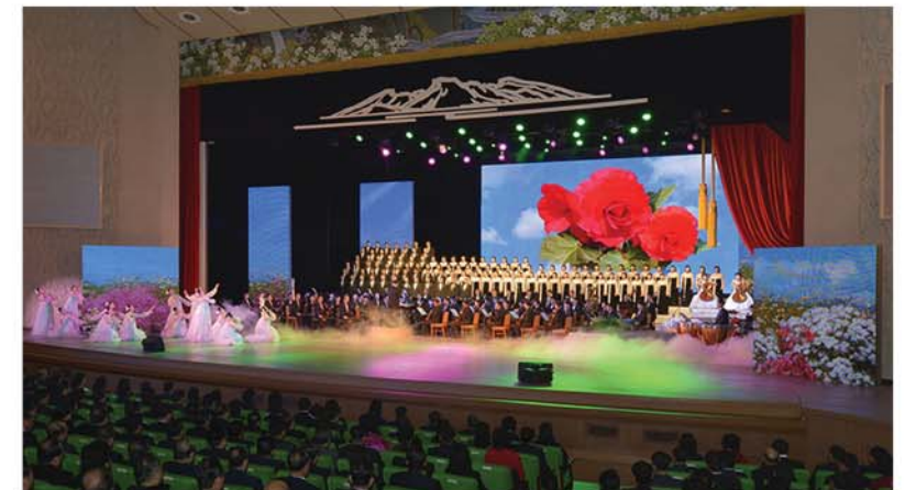
회고음악회 《위대한 한생》의 한 장면

회 《위대한 한생》을 비롯하여 회고무대, 결의모임 등 다채로운 행사들이 펼쳐졌다. 인민군장병들과 각계층 근로자들, 청소년학생들은 나라의 곳곳에 높이 모셔진 장군님의 동상과 태양상을 찾아 꽃바구니와 꽃다발, 꽃송이들을 진정하였다.