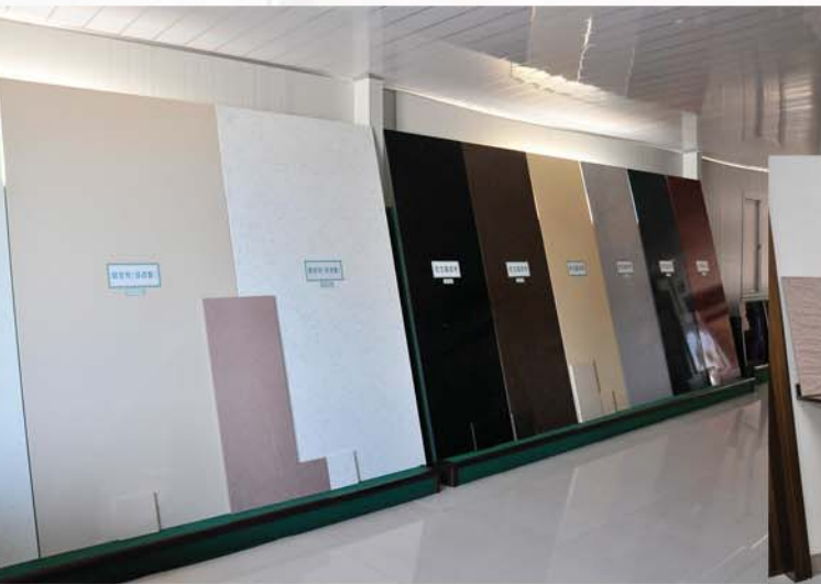
생산된 제품들의 일부

1 300여세대에 달하는 24개 호동의 다층살림집들과 학교, 병원, 탁아소, 유치원, 각종 편의봉사시설들을 비롯한 공공건