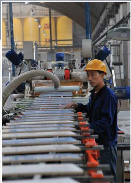
생산흐름선을 타고 내벽타일이 쏟아진다.