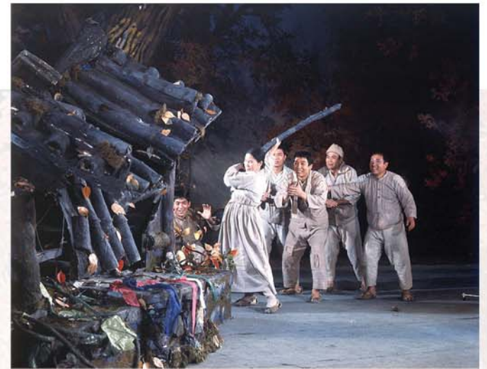
불후의 고전적명작 《성황당》을 각색한 혁명연극 《성황당》의 한 장면