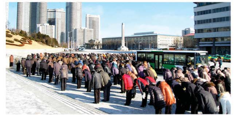
위대한 령도자 김정일장군님을 추모하여

한 마음으로 추모하였다. 그들은 위대한 장군님의 령도가 있었기에 백두에서 시작된 주체혁명의 명맥이 곳곳이 이어지고 나라와 민족의 존엄과 국력이 최상의 경지에 올라서게 되었으며 력사의 온갖 풍파속에서도 사회주의위업이 빛나는 한길을 걸어올수 있었다고 걱정을 토로하였다. 그리고 장군님에 대한 영원한 충정의 마음을 안고 조국의 강성국가건설과 통일을 위한 길에서 경애하는 원수님의 령도따라 장군님의 유훈을 끝까지 실천해나갈 굳은 결의들을 다지였다. 절세위인에 대한 그리움이 흐르는 속에 평양은 물론 각 도, 시(구역), 군, 련합기업소들에서 추모대회, 추모회가 진행되었으며 회고음악