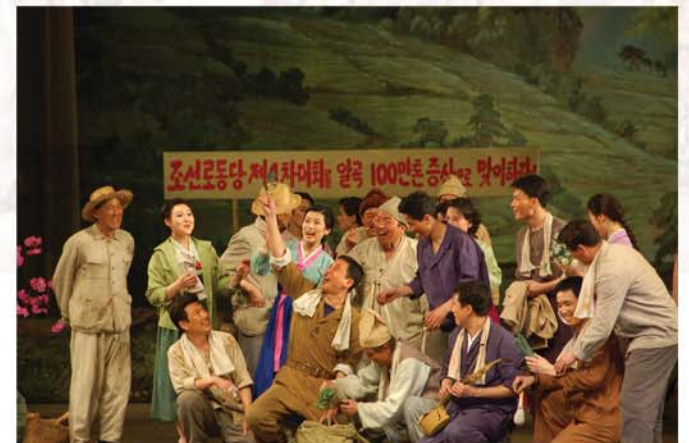
김일성상계관작품 경희극 《산울림》의 한 장면