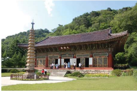
보현사의 대웅전과 8각13층탑

전, 관음전, 령산전, 수충사, 8각13층탑, 4각9층탑, 《팔만대장경》보존고 등이 있습니다.