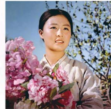
불후의 고전적명작 《꽃파는 처녀》를 각색한 조선예술영화 《꽃파는 처녀》의 한 장면

그이의 정력적인 지도에 의해 영화는 짧은 기간에 완성되게 되었고 1972년 제18차 카를로비 와리국제영화축전에서 특별상과 특별메달을 수여받았습니다.