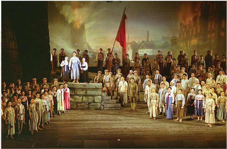
불후의 고전적명작 《피바다》를 각색한 혁명가극 《피바다》의 한 장면

오늘 여러분과 자리를 같이한 기회에 주체적 문학예술의 새로운 전성기를 펼쳐주신 위대한 김정일대원수님의 불멸의 업적에 대하여 이야기를 나누려고 합니다.