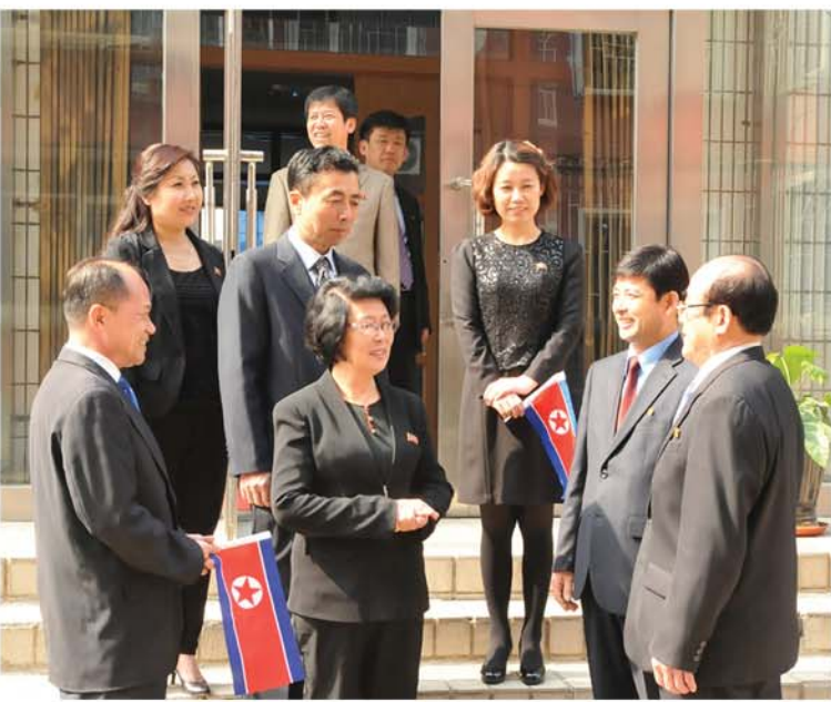
재중조선인총련합회조직을 강화하기 위해 조직사업을 짜고든다.

지에 흠어져사는 그들을 하나로 단합시켜주는것이 동포조직이다. 재중조선인총련합회아래 각 지구협회와 지부들이 그것을 보여주고있다.