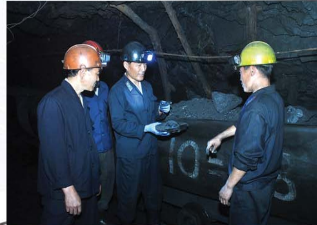
글 본사기자 윤영일