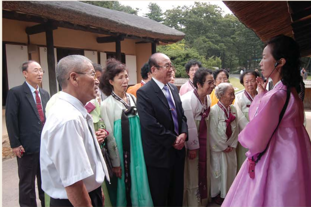
만경대 고향집을 방문하였다.