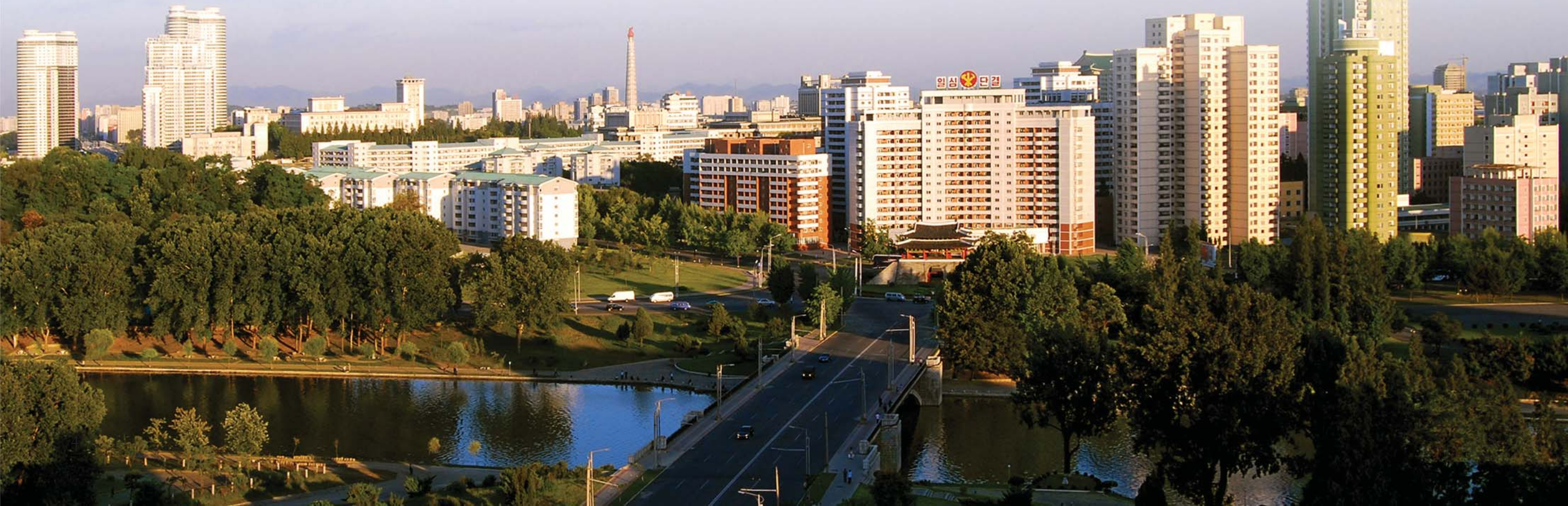
보통강반의 새 모습

일떠세워도 그 주변에 지피식물을 많이 심고 원림복화사업을 잘하도록 강조하곤 하시였다. 최근년간에만도 그이께서 온 나라를 수림화, 원림화, 파수원화하기 위하여 나라의 곳곳을 찾아 걸으신 길