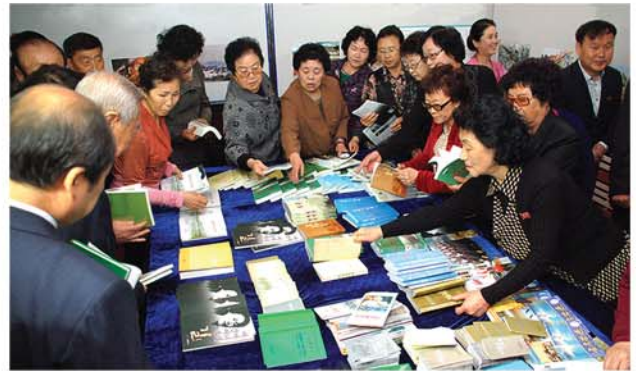
사진 및 도서전시회를 통하여 조국을 더 잘 알기 위한 학습을 하고있는 심양시지부 동포들