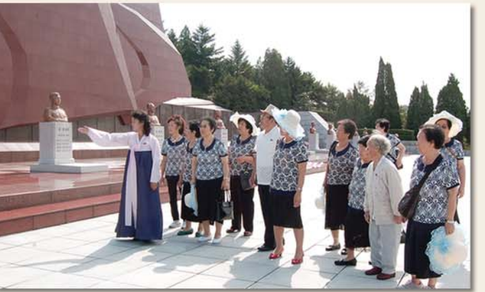
대성산혁명렬사릉을 찾은 동포들