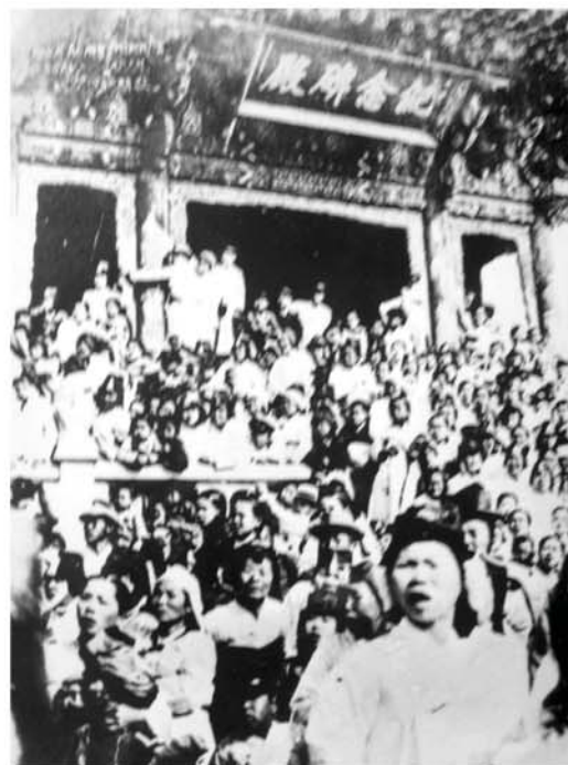
3. 1인민봉기에 떨쳐나선 시위자들