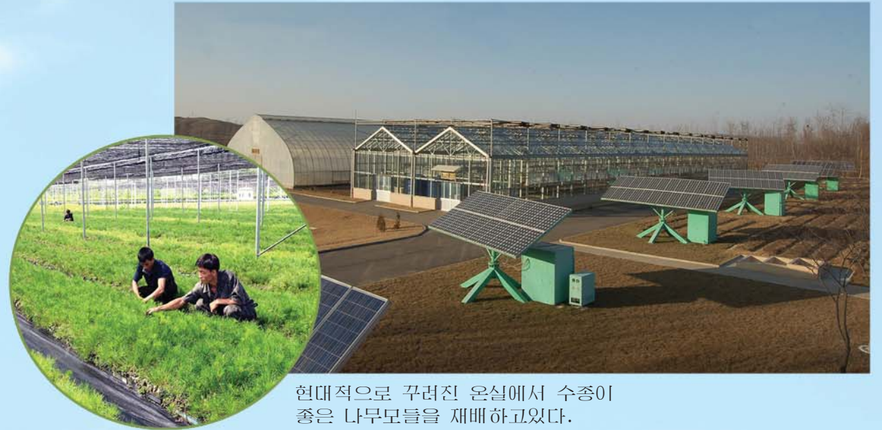
현대적으로 꾸러진 온실에서 수종이 좋은 나무모들을 재배하고있다.

철푸른 바늘잎나무들을 각지에 보내주는 사업을 진행하고있습니다. 우리 양묘장에서는 새 품종의 잔디에 대한 연구와 육종사업도 해나가고있습니다.》