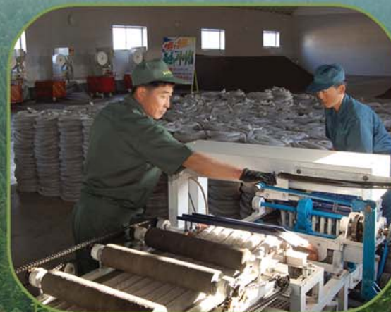
영양단지와 해가림발 생산