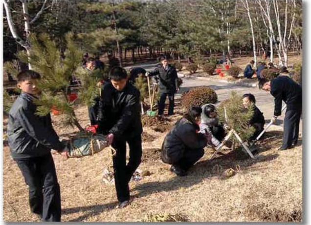
나무를 심고있는 청년학생들

는 준비를 빈틈없이 해놓았다고 하면서 올해에는 인민들이 더 많은 덕을 볼수 있다고 말하는것이였다. 그런데 그의 말하는 품이라든가 목소리, 손짓까지도 어느 한 해외동포의 모습과 너무도 방불하였다. 그래서 우리는 넌지시 물어보았다. 《저... 실례이지만 해외에 친척되는 분이 계시지 않지요. 어쩐지 너무도 비슷해서...》 그는 빙그레 웃으며 언니가 중국에 살고있다고 하면서 이렇게 말하였다. 《언니는 우리들을 만날 때면 늘 나라의 사랑과 믿음에 보답해야 한다, 그것이 나에게 힘을 주고 나를 돕는 일이다라고 말합니다. 언니의 기대에 꼭 보답하겠습니다. 동포들과 함께 해주에 오면 우리 식당에도 꼭 들려주십시오.》 자기 힘으로 자기가 사는 마을과 일터, 고향을 꾸려가기에 해주사람들의 긍지가 그리도 큰 것이라는 생각을 하며 우리는 다음 취재지로 향하였다. 글 본사기자 한신애