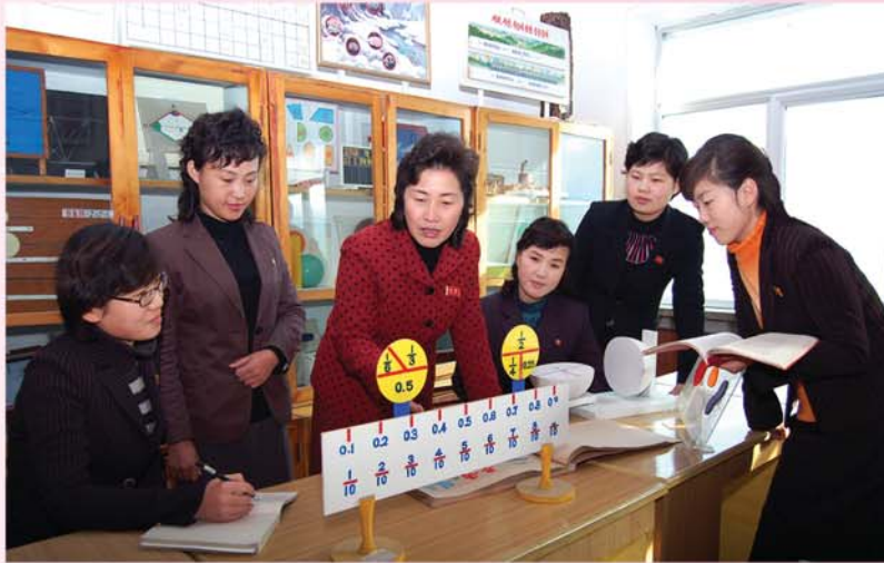
교원들의 자질을 높이기 위해 힘쓰고있다.

조직한 분과별교원모임과 경험토론들에서 평가를 내리었다. 정보기술과목수업에서는 학생들에게 컴퓨터활용기초기술을 기본으로 글짓기, 그림그리기능력 등을 동시에 개발시켜줄수 있도록 교원이 문제점설정부터 잘할데 대한 문제, 자연과목수업에서는 조국의 식물에 대한 상식을 생동한 직관물을 곁들여 잘 알려주는것과 함께 애국심을 자라워 학교와 거리, 마을에 심은 꽃과 나무들을 사랑하도록 할데 대한 문제, 위대한 김정일대원수님께서 어린시절에 공부하신 뜻깊은 학교에서 배우는 학생들이 모든 면에서 모범이 되도록 교원들이 깨우쳐주는 교수와 교양에 품을 들일데 대한 문제... 구석구석 총화짓는 그의 평가에는 자그마한 빈틈도 없었다. 어느 사이 하루사업이 끝났지만 그는 마치 시간이 자기에게만은 적게 차례지기라도 하는듯 시계