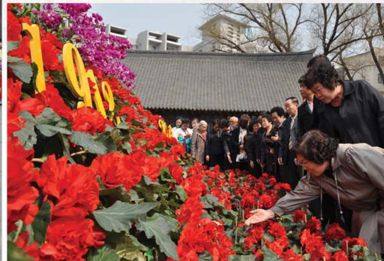
김일성화김정일화전시회장을 돌아보는 재중동포들