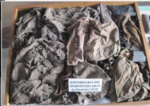
전신천군당 방공호에서 불타고 남은 900여명의 애국자들의 피와 기름이 얼룩져있는 방공호천정, 시체와 함께 나온 옷자락의 일부

학살현장에서 해리슨은 이 광경이 《기념》이 된다고 하면서 줄개들과 함께 사진까지 찍으며 돌아왔다.