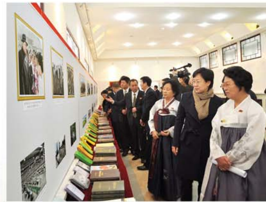
사진 및 도서전시회장을 돌아보는 동포들

사회주의혁명과 여러 단계의 사회주의건설을 승리의 한길로 이끄시어 조국을 자주, 자립, 자위로 존엄떨치는 불패의 강국으로 강화발전시키시었다고 하면서 그는 수령님처럼 독창적인 사상과 탁월한 령도, 고매한 덕망으로 인민대중의 절대적인 지지와 신뢰를 받으시며 20세기를 반제자주위업, 사회주의위업의 승리의 세기로 빛내이신 걸출한 수령, 위대한 혁명가는 일찌기 없었다고 칭송하였다.