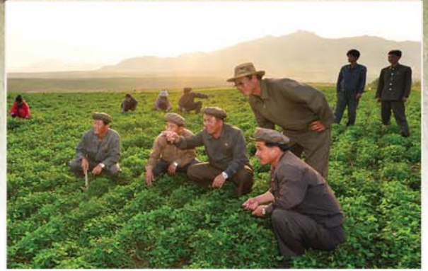
방목지에 개척자들의 보람과 긍지 넘친다.

바로 그분은 경애하는 김정은원수님입니다. 이이께서는 3년전 9월 세포등판개간의 용단을 내리시었다. 그리고 그 실현을 위한 전반사업을 지도하시며 건설자들의 정서생활에 이르기까지 세심히 보살피고계신다. 올해에는 신년사에서 세포지구개간사업에 대해 강조하신데 이어 불후의 고전전로작 《세포지구 축산기지건설을 다그치며 축산업발전에서 새로운