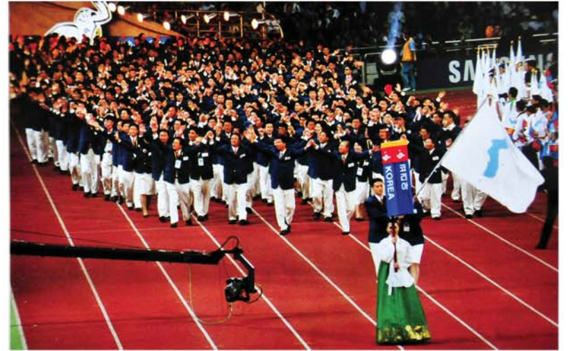
북과 남의 체육인들이 국제경기대회장들에 공동으로 입장하였다.

자주통일과 평화번영을 위한 애국애족위업에 모든것을 복종시키신 위대한 장군님의 거룩한 령도의 자욱이 아로새겨져 있다.