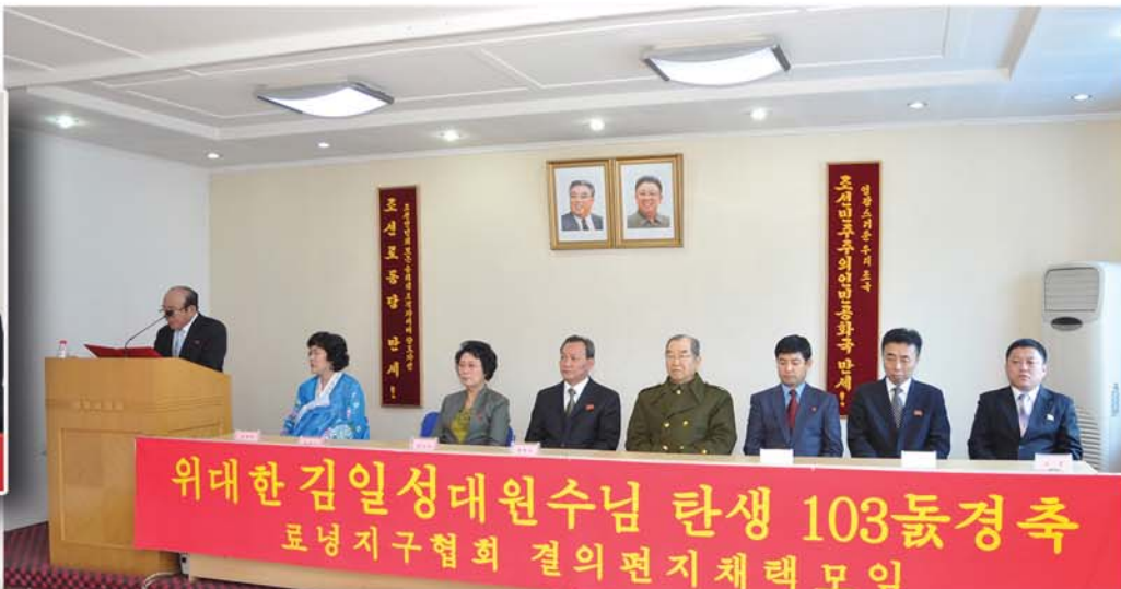
위대한 김일성대원수님 탄생 103돐경축 료녕지구협회 결의편지채택모임