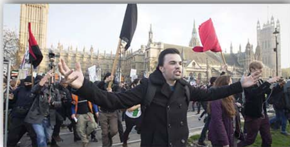
영국에서 당국의 부당한 교육정책을 반대하여 시위