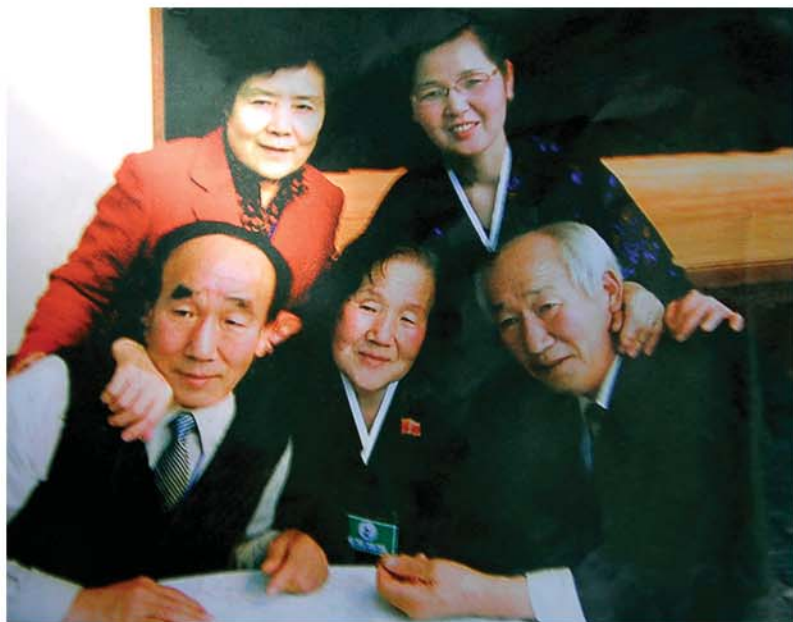
남북의 혈육들과 함께

-같이 우물 파고 혼자 먹는다 다같이 힘들여 일한 결과에 얻은 열매를 몽땅 혼자서 차지하려는 욕심많은 사람에게 대하여 이르는 말. -공짜라면 써도 달다 한다 공짜라면 맛이 쓴것도 달게 느껴진다는 뜻으로 공짜를 좋아하는것을 빗자해서 이르는 말. -굵은 개 부엌 들여다보듯 계걸스럽고 치사스럽게 남의것을 바라는 모양을 욕으로 이르는 말.