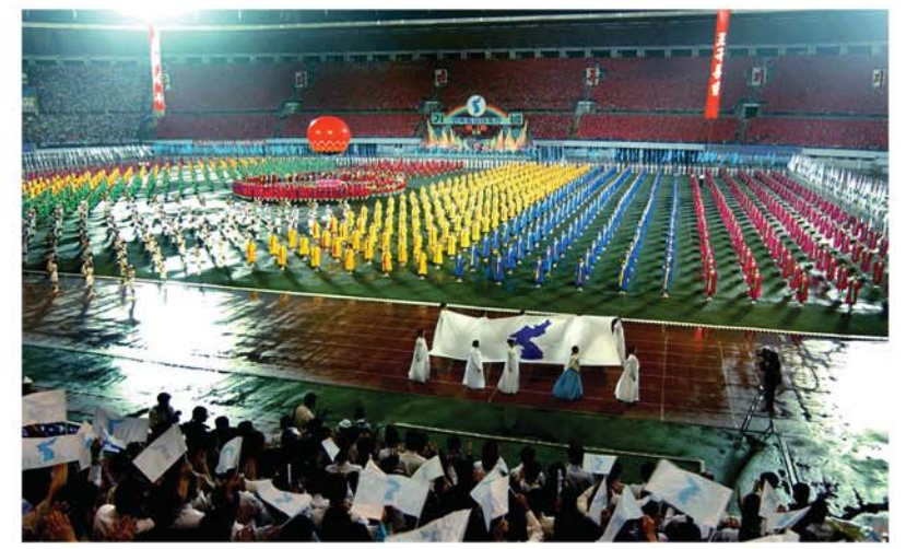
6. 15북남공동선언발표 5돛기념 민족통일대축전개막식상 주체94(2005)년

평양상봉의 나날에 진행된 회담에서 그이께서는 이번에 내놓는 문건은 2000년대에 들어선것만큼 온 겨레에게 통일에 대한 새로운 희망과 락관을 주는것으로 되어야 한다, 그러니 이번에는 우리 민족끼리를 공