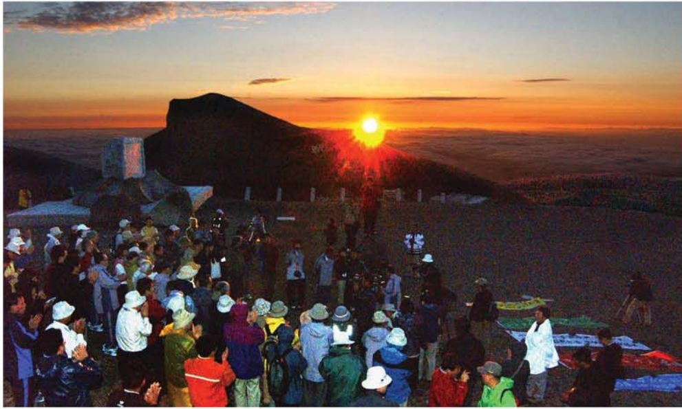
백두산정에서 진행된 북, 남, 해외작가들의 《통일문학의 새벽》모임 주체94(2005)년

피를 나눈 동족끼리 손을 맞잡고 민족의 밝은 미래를 개척해나가야 한다는 그이의 교시에 남측 성원들은 깊은 리해와 공 주체92(2003)년에 진행된 북남철도련결행사