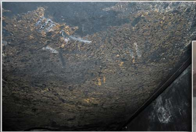
900여명의 애국자들을 불태워 학살한 전 신천군당 방공호와 애국자들의 피와 기름이 얼룩져있는 방공호천정, 시체와 함께 나온 옷자락의 일부