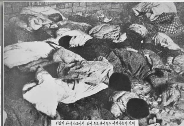
원암리 화약창고에서 굶겨죽고 얼어죽은 어린이들의 시체