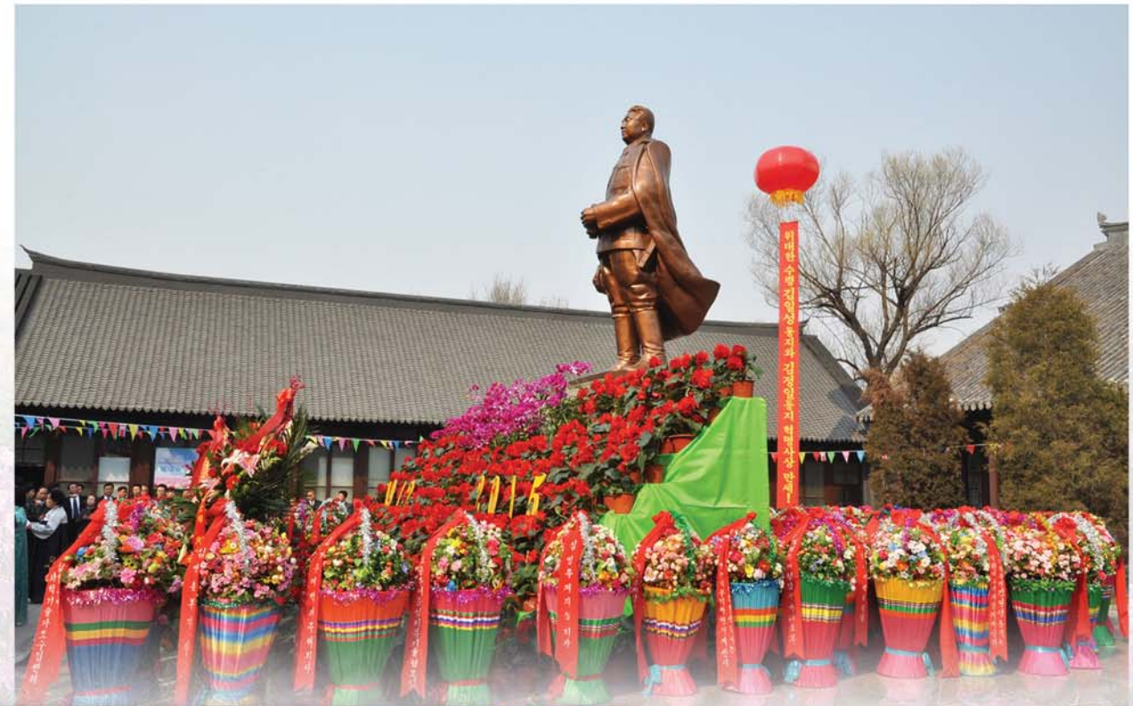
길림육문중학교에서 위대한 수령 김일성동지의 탄생 103돐경축 재중조선인총련합회 보고대회가 진행되었다.