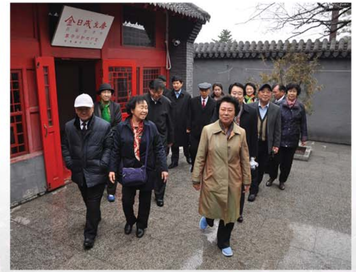
북산공원 약왕묘를 찾은 동포들

위대한 한생을 뜨겁게 돌이켜보았으며 그이를 사회주의조선의 시조로 높이 모신 크나큰 민족적공지와 자부심을 다시금 깊이 간직하였다. 그들은 수령님을 못잊어 그리는 자기들의 마음을 예술공연에 담아 펼쳐보임으로써 관람자들에게 깊은 감명을 안겨주었다.