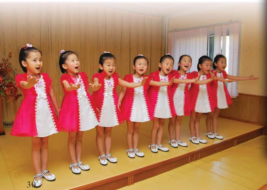
《우리 행복 노래 불러요.》

《음악적소질은 어린시절부터 나타납니다. 때문에 그것을 제때에 발견하고 일찍부터 키워주어