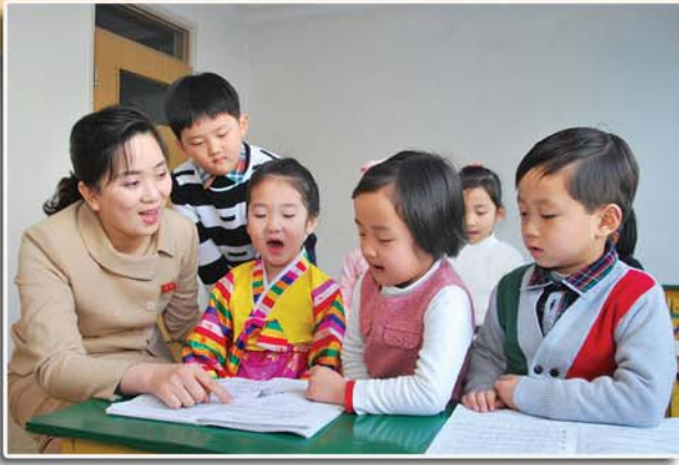
《함께 악보를 읽어보지요.》

평양시 중구역 대동문유치원은 재능있는 음악신동들을 많이 키워내고있는것으로 하여 소문이 났다.