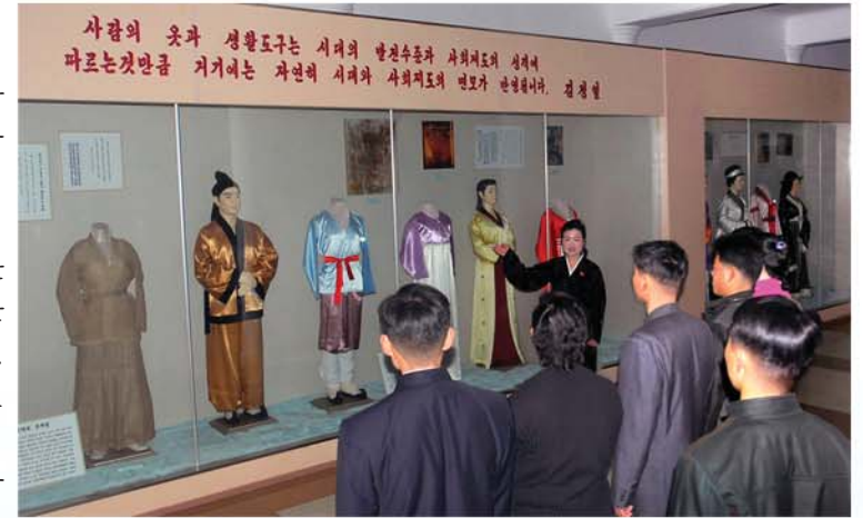
민속박물관을 찾은 근로자들

베틀로 천을 짜는 녀인의 모습을 보여주는 남포시 대안구역 대안리 1호무덤벽화자료, 고려시기 대외관계를 보여주는 11세기 비단길 력사지도자료와 주요 옷감생산지들을 나타내는 조선지