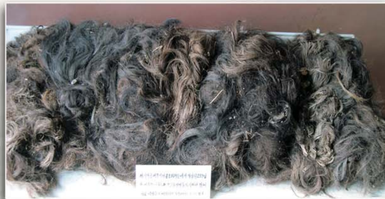
원암리 화약창고에서 굶겨죽고 얼어죽은 어린이들의 시체