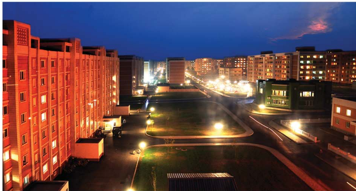
인민군군인들이 짧은 기간에 건설한 은하과학자거리의 저녁