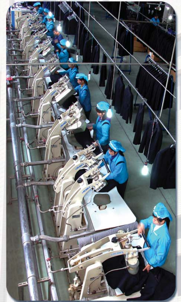
알뜰하게 꾸려진 생산현장