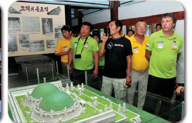
개성시에 있는 고려박물관을 돌아보았다.