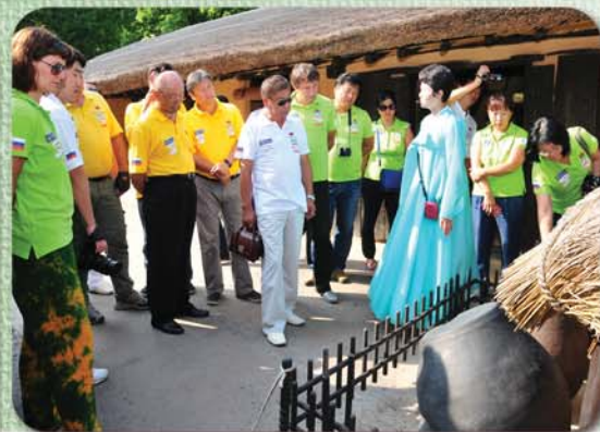
평양에 도착한 행진단성원들은 수도 시민들의 열렬한 환영을 받았다.