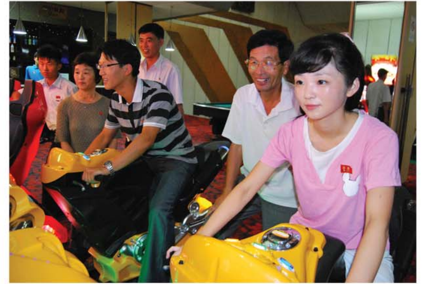
휴식일에 가족과 함께

것을 최적화, 최량화하는 방법을 완성하여 많은 공공건물들의 지열보장을 과학적으로 담보할수 있게 하였다.