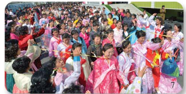
새집들이를 하는 김정숙평양방직공장의 합숙생들