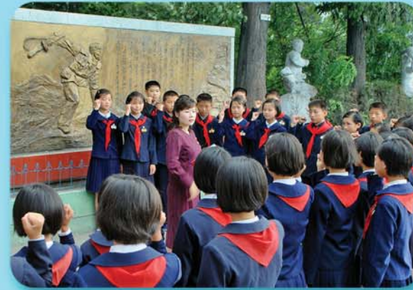
영웅들의 투쟁정신을 심어주며

참관자들속에 있던 우리는 그로부터 며칠후 영웅강사의 모교인 남포시 항구구역 영웅한두초급중학교를 찾았다.