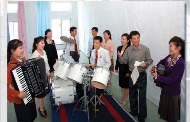
공장에서는 군중문화활동에도 큰 힘을 넣고있다.