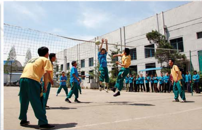
휴식시간에 진행되는 체육활동

만경대봉화피복공장에서 보낸 시간은 비록 길지 않았어도 우리는 그들의 마음속에 간직되어 있는 불타는 애국심과 승리에 대한 신심을 충분히 가늠할수 있었다.