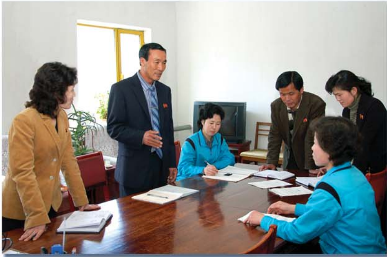
생산문화, 생활문화확립을 위한 협의회