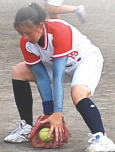
글 본사기자 한신에

오늘도 그들은 기어이 국제경기들에서 조국의 존엄과 영예를 빛내일 높은 목표를 안고 훈련에 열중하고있다.