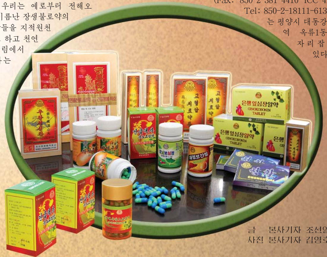
글 본사기자 조선일 사진 본사기자 김영호

을 모신 김정일화와 더불어 몽골과 조선사이의 친선관계가 더욱 두터워지리라것을 확신한다고 말하였다.