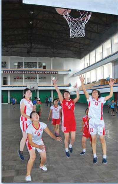
정주청년체육관에서 열린 농구훈련

평양-신의주행 급행열차에 오른 우리는 차창밖으로 흘러가는 도시와 공장, 농장벌들에서 눈길을 떼지 못하였다.