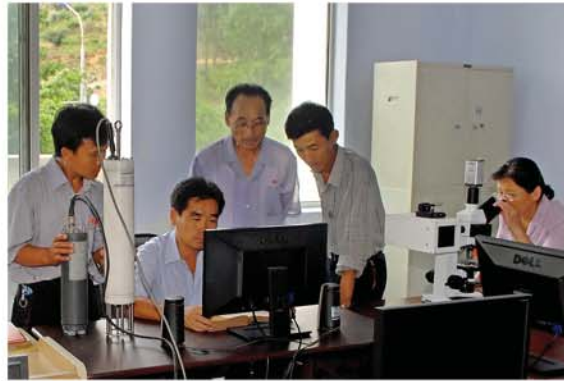
분석실에서 현장에 위치를 정하다

조국인민들이 자랑하는 기념비적창조물인 서해갑문과 대계도간석지에도 그들의 땀배인 노력이 깃들어있다.