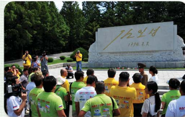
판문점에 세워진 위대한 김일성대원수님의 친필비 앞에서

판문점에서 민족분렬의 비극을 가시고 조국통일위업을 이룩하기 위한 력사적문건에 생애