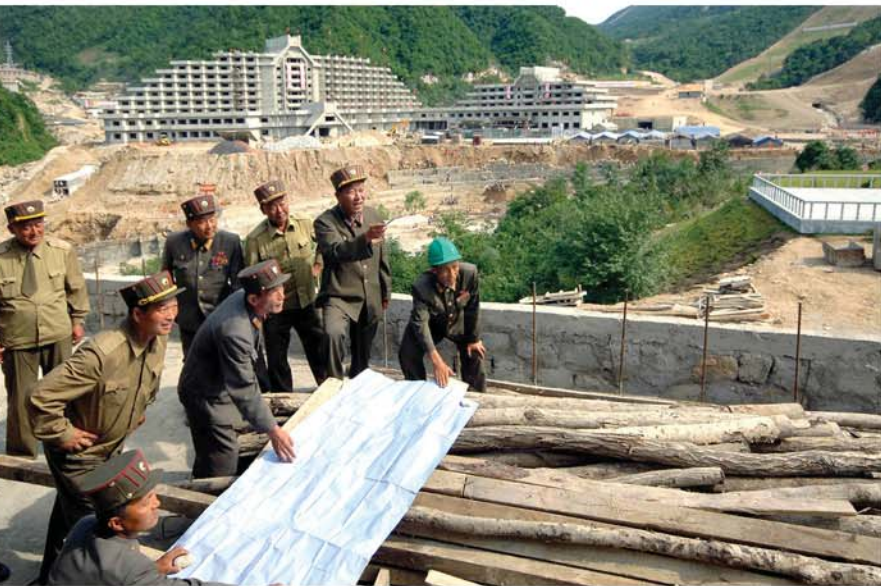
건설장들마다에서 위훈을 창조해가는 군인건설자들

날마다 시간마다 새로운 기적이 창조된 건설장의 벽찬 숲결은 주체적건축사상의 요구대로 건축물의 조형화, 예술화를 최상의 수준에서 실현해가는 군인건설자들의 미더운 모습을 뜨겁게 안겨주었다.