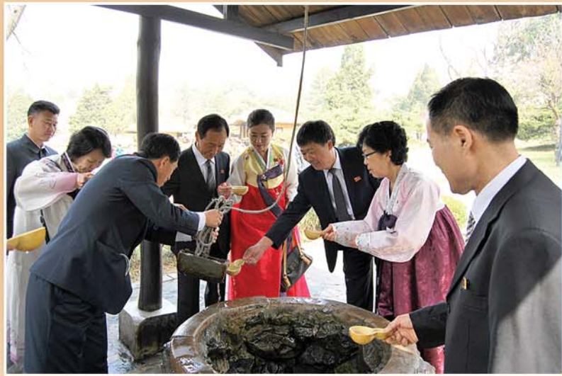
만경대고향집의 우물가에서 조롱박으로 물을 마시는 해외동포들