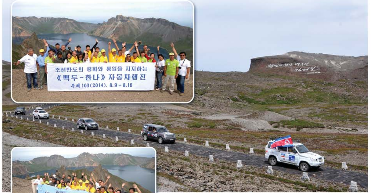
백두산정에서 《조선반도의 평화와 통일을 지지하는 <백두-한나> 자동차행진》출정식이 진행되었다.