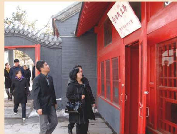
위대한 수령님께서 혁명활동을 벌리신 사적지들을 찾는 재중동포들