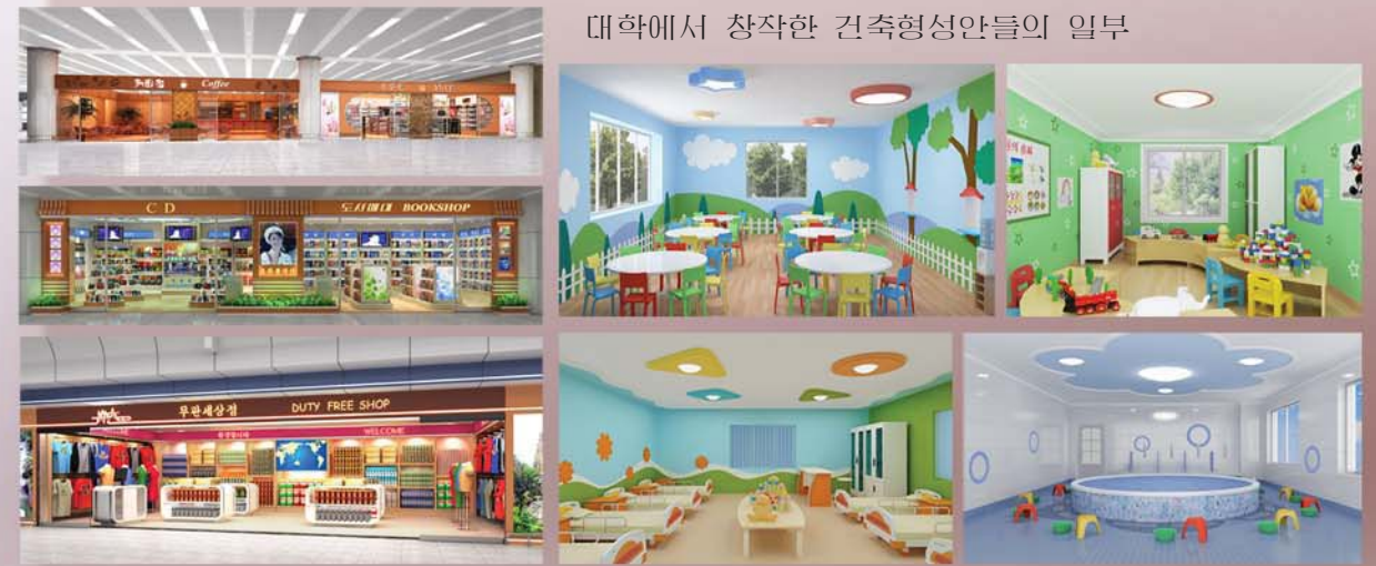
대학에서 창작한 건축형성안들의 일부