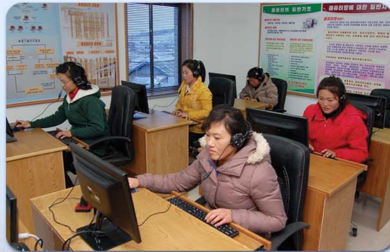
원격교육체계에 망라되어 강의를 받고있는 농장원들

원격교육체계를 통하여 과학지식을 습득하고 토양분석실, 병해충검정실에서는 토양을 분석하고 병해충피해방지대책도 세우고있었다. 그들의 모습에는 조선로동당 제7차대회를 맞는 올해에 과학기술에 의거하여 올해농사를 더 잘 지으려는 열의가 그대로 어려있었다.