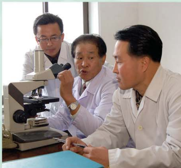
교원들의 자질을 높이기 위해

승남은 신정과 가정을 이룬 후 대학박사원에서 공부하던 나날에 콩팔염에 대한 진단에서 원인을 정확히 밝히지 못한 결과 치료사업이 진척되지 않는다는 것을 알게 되었다. 그는 낮과 밤이 따로