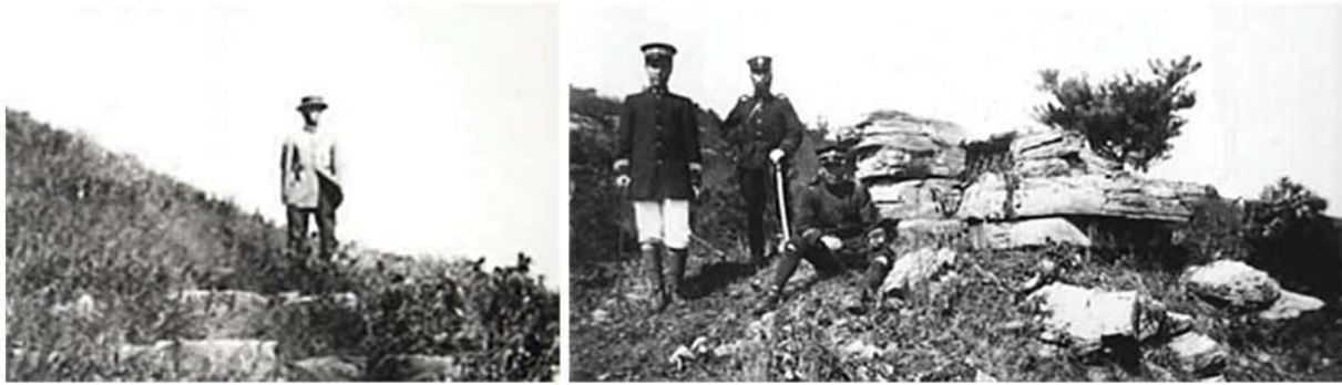
고적을 《조사》하는 일본의 어용학자와 도굴을 도와주는 일제경찰들

러한 침략적이며 파렴치한 《합법적》 군사지령에 따라 청일전쟁시기에만도 수많은 조선의 문화유물들이 파괴략탈당하였다.