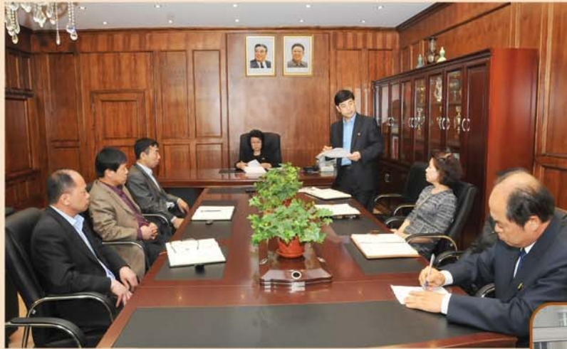
더 많은 동포들을 묶어세우기 위하여 노력하는 총련합회의 일꾼들