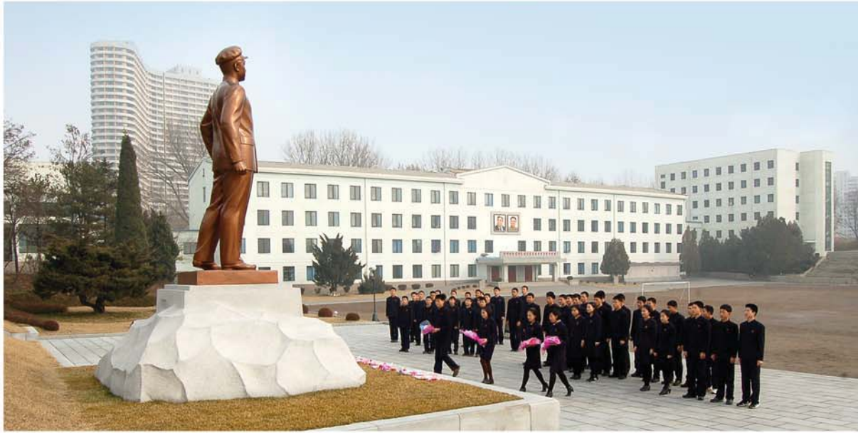
학교에 모셔진 위대한 수령 김일성대원수님의 동상을 찾아