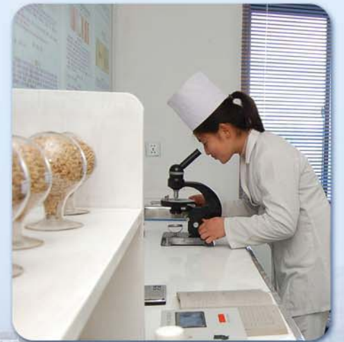
농장에 꾸러진 병해충검정실에서