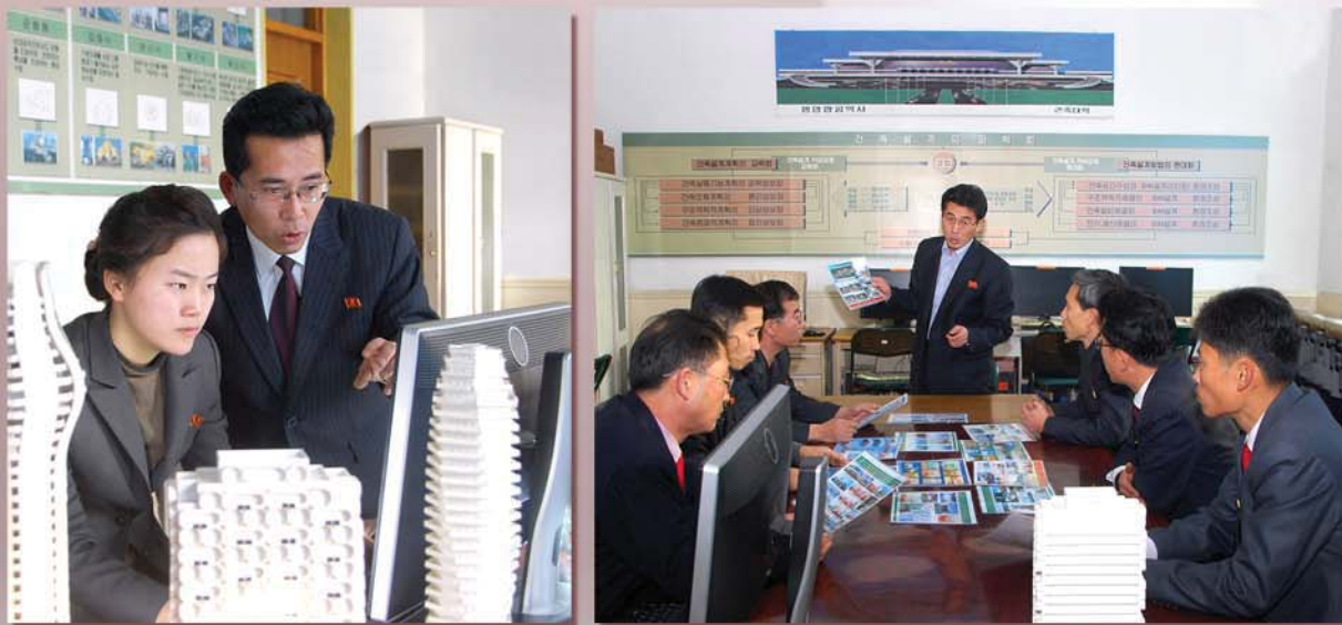
새로운 형성안에 대한 토론을 진행하고있다.

날 우리 학급은 전원이 대학생과학탐구상수상자들로 자라났습니다.》라고 말하였다.