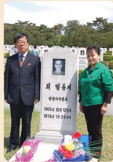
애국렬사릉을 찾은 동포들

소탄까지 보유한 당당한 핵보유국, 우주개발국으로 되었다는 긍지를 안고 동포들은 국가신물관, 개신문 등을 돌아보면서 《참으로 위대한 우리 조국이다. 위대한 수령님들을 모신 조선민족원 궁지와 자부심이 가슴에 짝 차오른다.》고 흥분된 심정을 터놓았다.