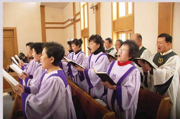
찬송가를 부르는 성가대 신자들