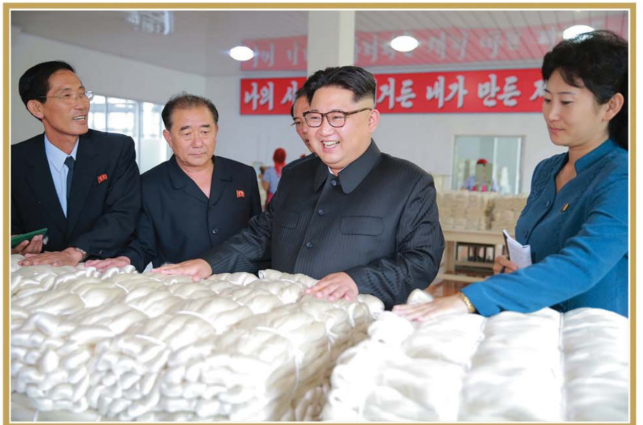
총정의 200일전투에서 날에날마다 기적과 혁신을 창조해가고있는 김정숙평양제사공장을 현지지도하시는 경애하는 김정은동지 주체105(2016)년 6월