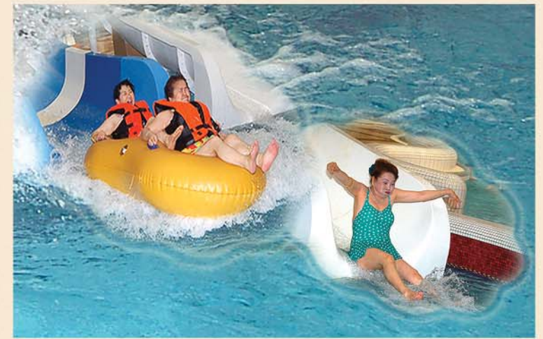
문수물놀이장에서 즐거운 한때를 보내었다.

빙상장, 룡라곱동어관, 문수물놀이장, 묘향산 등 조국의 여러곳을 돌아보면서 동포들은 즐거운 나날을 보내었다.