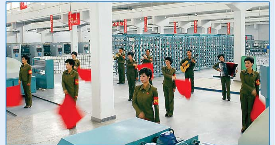
김정숙평양방직공장 기동예술선동대 대원들