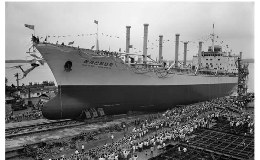
《장자산청년》호 진수식 100일전투: 주체69(1980)년 촬영

다 아시다싶이 지난 5월 중순 경애하는 원수님께서는 어머니 당대회에 드리는 충정의 로력적선물로 제작한 현대적인 트랙토르와 농기계들, 새형의 자동차, 버스 등 기계설비들이 전시되어있는 전시장을 돌아보시