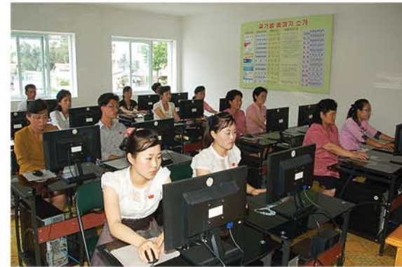
과학기술을 습득하고있는 근로자들

양, 돼지호동들과 염소젖가공장, 과학기술보급실, 소형수력발전소, 양어장 등이 구색이 맞게 전개되어있었다. 그런가 하면 염소와 양떼들이 풀판을 따라 무리를 지어 이동하는 모습은 장관을 이루며 산허리를 감도는 구름을 련상케 하였다.