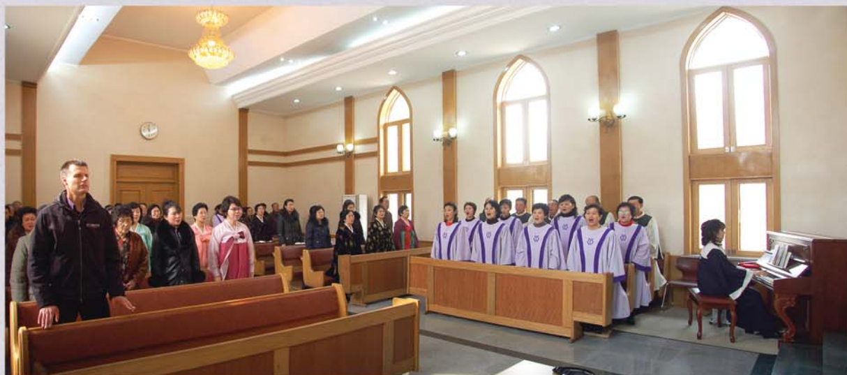
주일예배 주체105(2016)년 2월 촬영