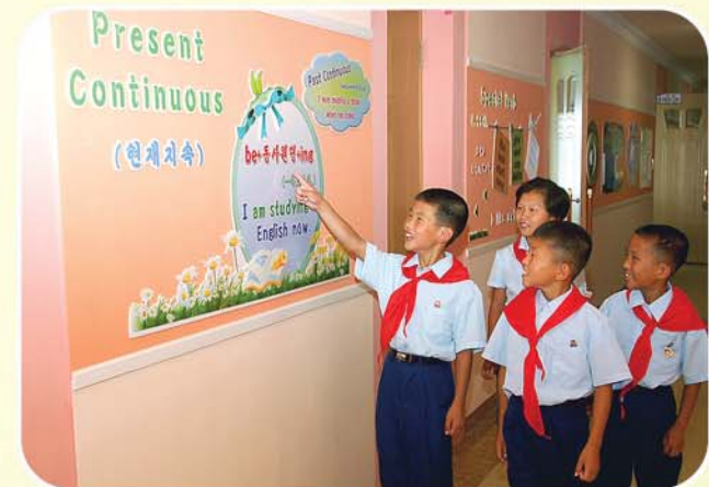
배운 지식을 다져간다.