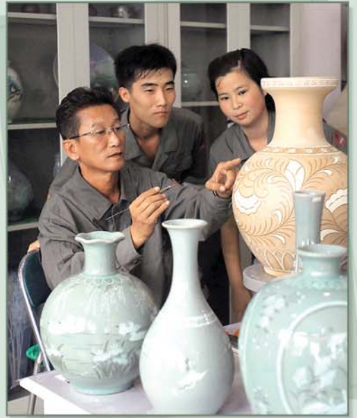
우아하고 특색있는 청자기를 창작하기 위해

더욱 발전시켜나가는 조국인민들의 마음을 잊지 말고 이역땅 어디에서나 우리 민족의 슬기와 재능이 담긴 고려청자기를 생활에 널리 리용해주십시오.