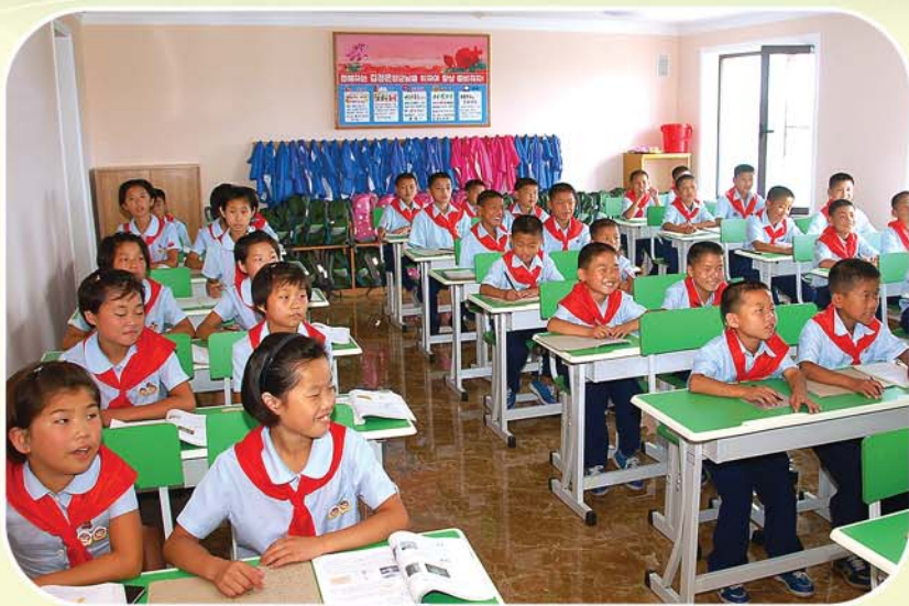
수업을 받고있는 원아들