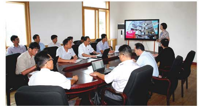
적십자재난긴급대응 상무협의회를 진행하고있는 적십자회 일군들

가하였다. 적십자회는 중앙과 도, 시, 군의 하부말단까지 자기의 지부를 가지고있으며 수많은 자원봉사자들과 청소년회원들을 가지고있다.