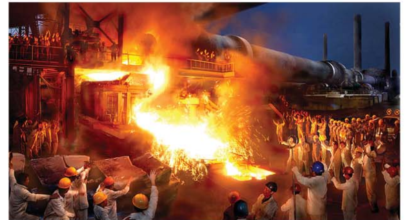
주체철에 의한 선진적인 제강법을 완성한 성강의 로동계급들 150일전투: 주체98(2009)년 촬영