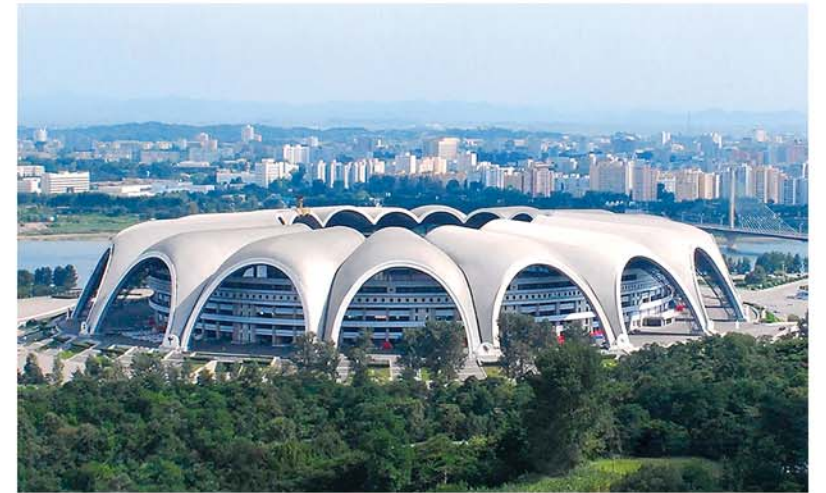
완공된 5월1일경기장 새로운 200일전투: 주체78(1989)년 촬영