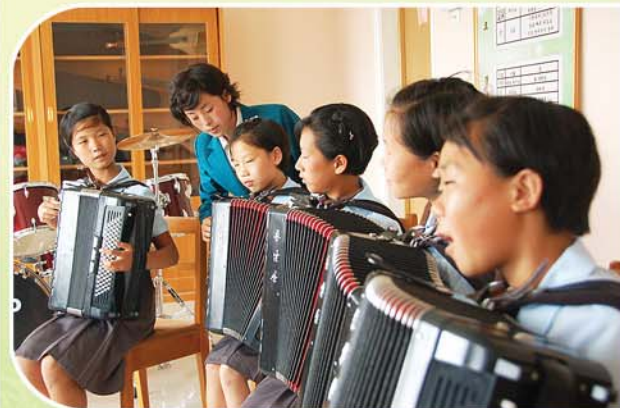
우리 행복 노래 불러요.