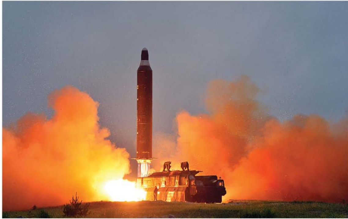
지상대지상중장거리전략탄도로켓 《화성-10》시험발사가 성과적으로 진행된 소식은 200일전투에 떨쳐나선 천만군민을 힘있게 고무하고있다.