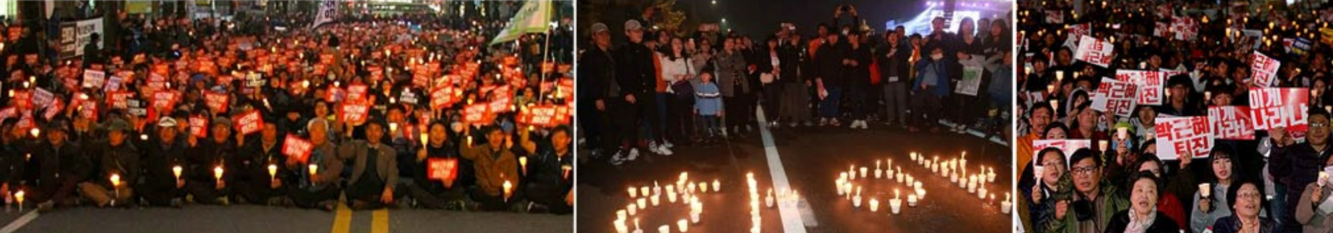
박근혜역도의 퇴진을 요구하며 투쟁에 열쳐나선 남조선인민들

남조선명을 앓는 측가이처럼 만 들어놓고도 아무런 죄책감도 없이 《속사》를 쓴다 하였다 하며 떨치지 않고있었으니 그 곁말은 변한것이다. 박근혜가 시궁창에 처박힌 세 주제도 모르고 돌아선것이야말로 초보적인 현실감각도 없는 저능아의 추태라고밖에 달리 볼 수 없다. 하기에 남조선의 《정황신문》은 《분노한 시민, 웃는 《대통령》》이라는 제목의 글에서 이렇게 썼다. 《최순실에게》에 대한 시민의 분노가 폭발하고있다. 조수와 학생들이 박근혜의 하야를 요구하는 시국선언문을 발표했다. 정의당은 《대통령》 하야추진행동에 들어갔다. 그러나 박근혜는 부산에서 열린 《지방자치의 날 기념식》에 참가했다. 《최순실에게》로 《정권》이 뿌리째 흔들리는 상황에서 이것이 과연 온전한 행동인가. 더불어민주당 이진 《국회》의원들은 《폭망한 대통령참정사》라는 글에서 《대통령》의 위자리는 형명 비어있었다고 폭로하였다. 박근혜의 심정은 아마도 《나는 이대통령이 아니다.》라 하는 것이었것기라고 그는 조소