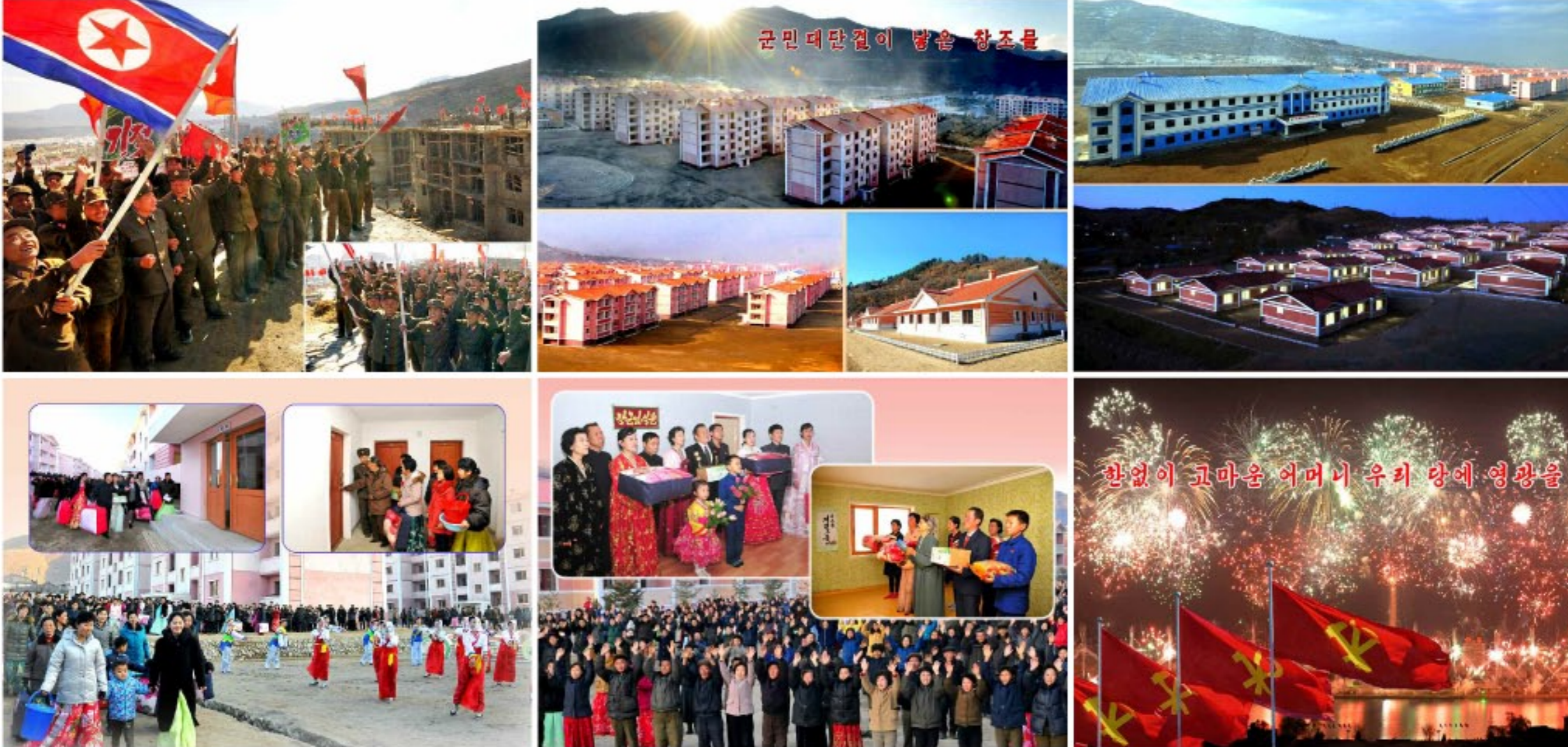
군민대단결이 낳은 창조물