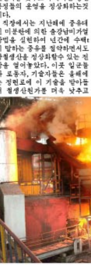
천리마제강련합기업소 강철직장에서 강철을 생산하고있다.