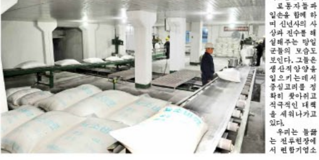
남흥청년화학련합기업소에서 화학공업을 하고있다.