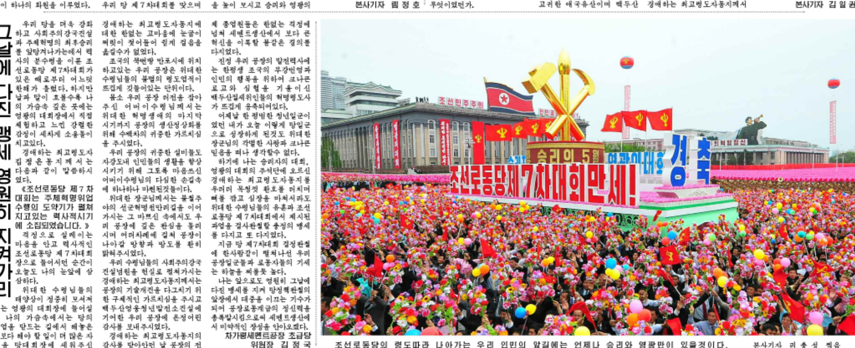
조선로동당의 명도마라 나아가는 우리 인민의 앞길에는 언제나 승리와 영광만이 있을것이다. (右) 본사기자 김성 백을