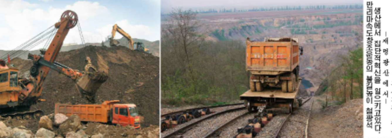
무산광산연합기업소에서 10여개 작업반들이 상반년계획 초과완수

화력건설련합기업소에서 5개년 계획수행에서 관건적의의 를 가지게 하는 올해 상반년 인민경제계획을 기한전에 완수하는 혁신을 창조하였다.