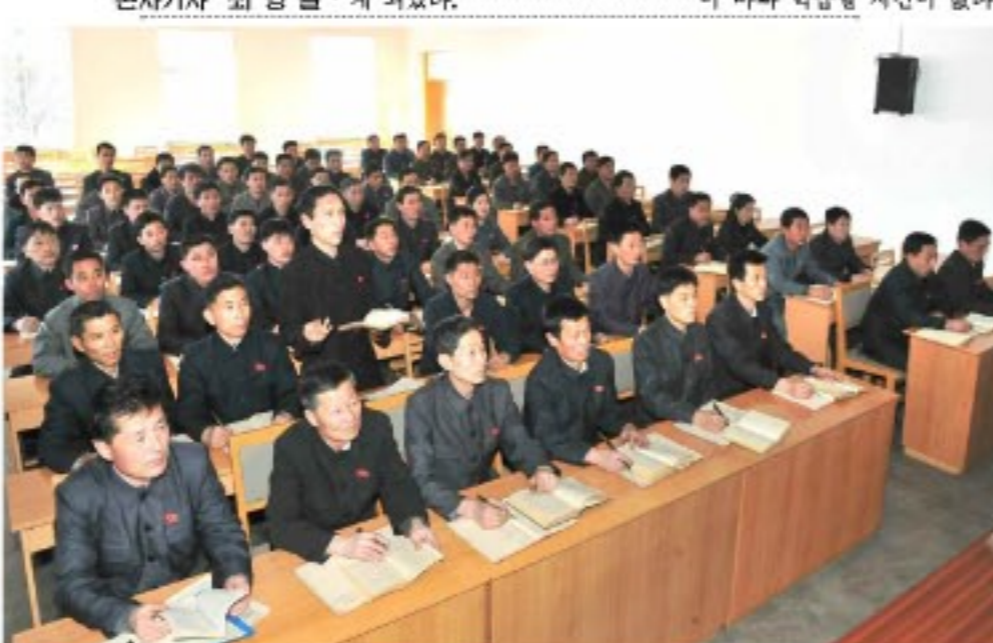
위대한 수령님들의 로자를 비롯하여 우리 당의 이론과 정책으로 무장하기 위한 학습을 실효성있게 하고있다. -정찬 강학력발전소에서-

원산시당 위원회에서 원산시당위원회에서는 학습 열풍을 일으키기 위해 읽은책 발표모임이 갖는 중요성의 의의를 명백히 하고 실효성을 높여 나가기 위한 조직사업을 짜고들어 성과를 거두고 있다. 원산시당위원회에서는 학습 열풍을 일으키기 위해 읽은책 발표모임이 갖는 중요성의 의의를 명백히 하고 실효성을 높여 나가기 위한 조직사업을 짜고들어 성과를 거두고 있다. 원산시당위원회에서는 학습 열풍을 일으키기 위해 읽은책 발표모임이 갖는 중요성의 의의를 명백히 하고 실효성을 높여 나가기 위한 조직사업을 짜고들어 성과를 거두고 있다.