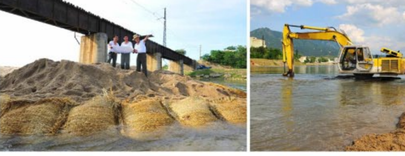
강 줄기를 돌려서라도