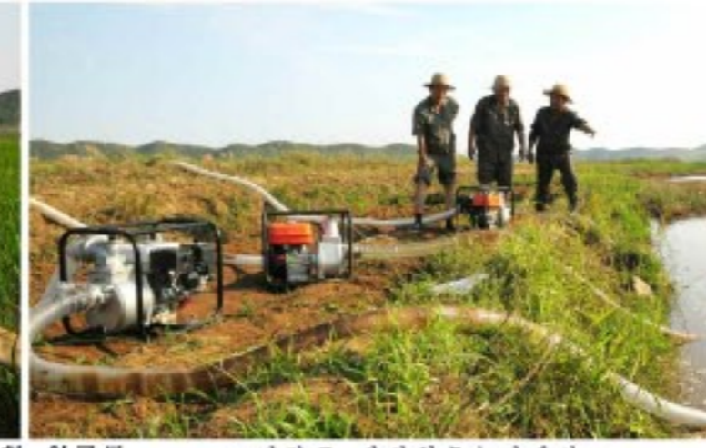
가물피해막이전투에 떨쳐나선 국가계획위원회 일군들 -강령군 광성협동농장에서-