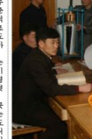
현실에서 제기되는 기술적문제들을 적극 풀어나가기 위하여 서로의 지혜를 합쳐가는 3대혁명소조원들 -2-, 8.8혁명기념관관에서-

《기술혁신목표는 어디까지 나 과전단위의 구체적실정에 맞게 대담하고 뚝이 크게, 현 실성있게 세워야 합니다.》