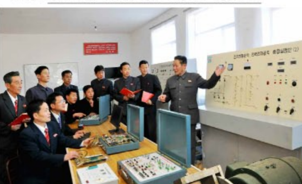
현대교육발전추세에 맞게 교수내용과 방법을 개선하기 위한 사업에 힘을 쏟고 있다.

리명속동무는 온실관리원들을 자주 찾아다니며 불멸의 꽃을 키우는데 애를 쓴다.