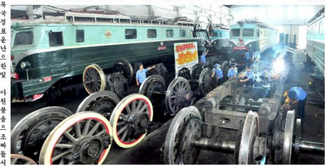
증산돌격운동의 불길높이 기관차수리전에서 혁신을 일으키고있다. -서평양기관차대에서-

발전 5개년전략목표수행을 위한 증산돌격운동으로 부른 당의 전투적구호를 높이 받들고 상원세멘트련합기업소의 일꾼들과 로동계급이 자력자강의 위력으로 매일 계획보다 수백의 세멘트를 더 생산하는 성과를 거두었다.