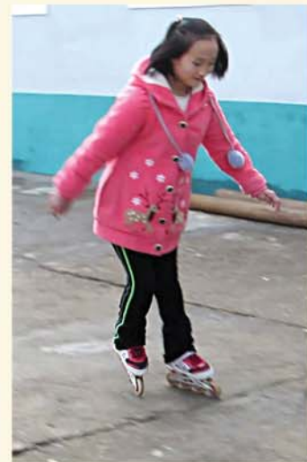
글 본사기자 김솔미