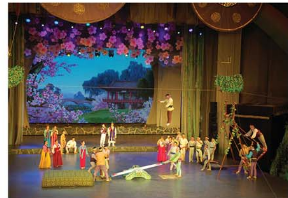
교예극 《춘향전》에서 형상한 널뛰기의 한 장면

널뛰기에 쓰이는 널은 길이가 4. 5~5m, 너비가 35~40cm, 가운데부분의 두께는 7~8cm, 양끝부분의 두께는 3~3. 5cm되게 만드는데 대체로 틈성이 좋은 나무를 씁니다. 이때 고