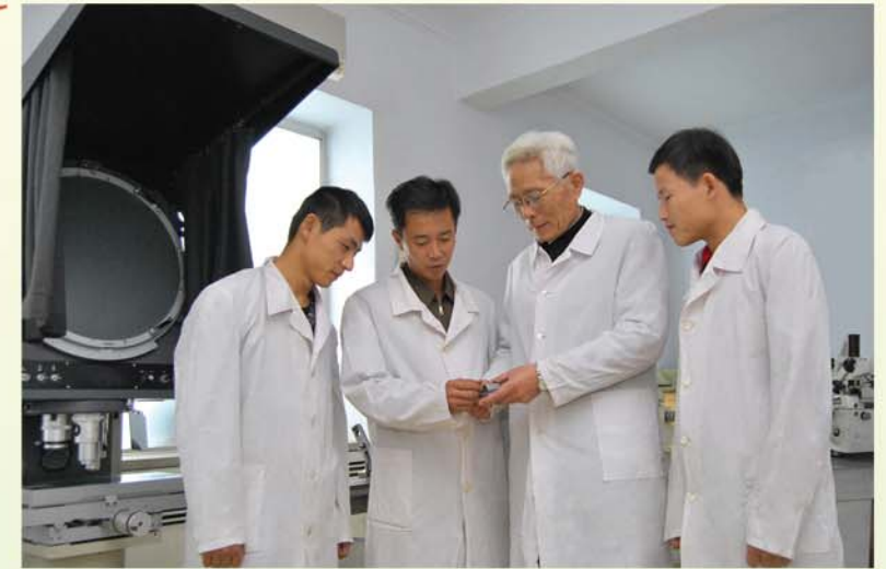
젊은 연구사들과 함께

그런데 이번에는 위대한 장군님께서 그가 만든 어느 한 공장의 열처리직장에 있는 설비들을 보시고 직장을 잘 꾸렸다고 하시면서 이런것을 보고 산업혁명이라고 하는것이라는 귀중한 교시를 주시였다는 소식에 접하게 되었다.