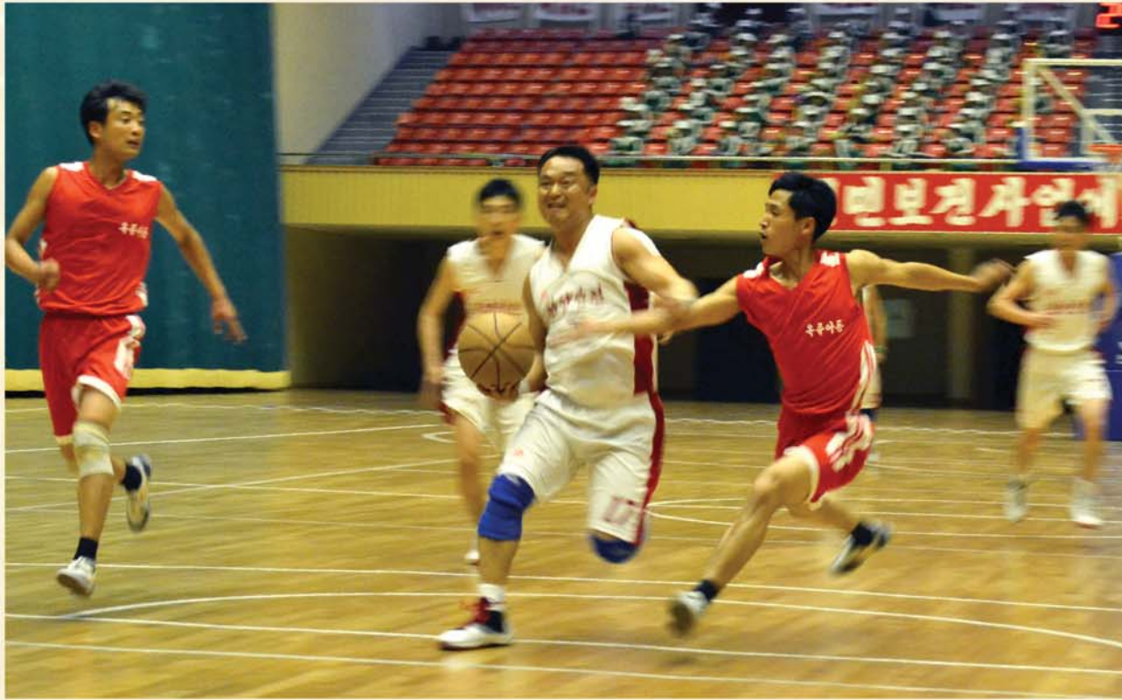
제3차 보건부문 체육경기대회에 참가하여