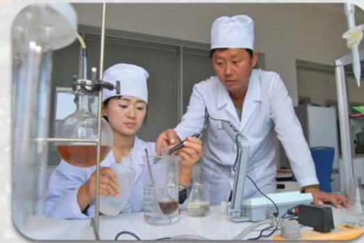
새로운 먹이첨가제를 개발하고있다.

《현재 우리는 메기먹이 첨가제로 리용되는 비타민과 아미노산, 효소제, 여러가지 항생소들을 생산할수 있는 기술을 연구완성한데 이어 생산공정을 꾸려놓고 생산을 정상화하고있다. 생산된 첨가제를 메기들에게 먹여본데 의하면 영양상태가 좋아지고 병균덜성이 높아졌을뿐아니라 먹이소비와 생산원가가 현저히 낮아졌다. 그리고 나라의 흔한 원료에 의거한 세계적수준의 팽화먹이를 해결하기 위한 연구사업을 심화시키고있는데 그 전망