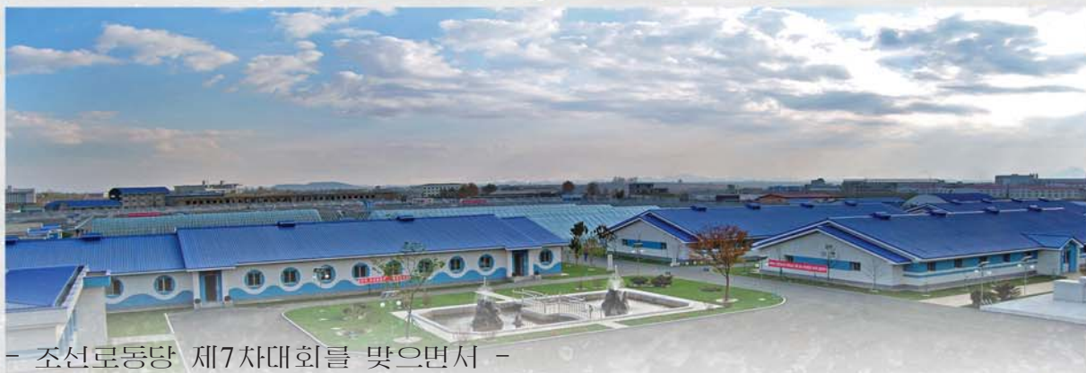
- 조선로동당 제7차대회를 맞으면서 -