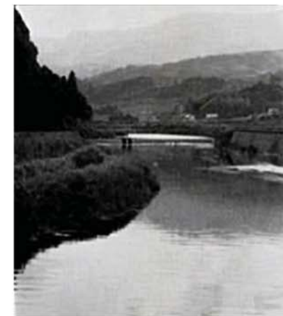
랍치해간 도자공들이 있던 아리다강류역과 가마터흔적

고분들에 대한 도굴, 파괴략탈행위는 극도에 달하여 그에 대하여 하나하나 꼽기가 힘들 지경이다. 오죽했으면 당시 도체찰사였던 류성룡이 《징비록》(제16권)에서 《심지어 나라의 퉁묘까지 남아있지 못하였다.》고 한탄하였겠는