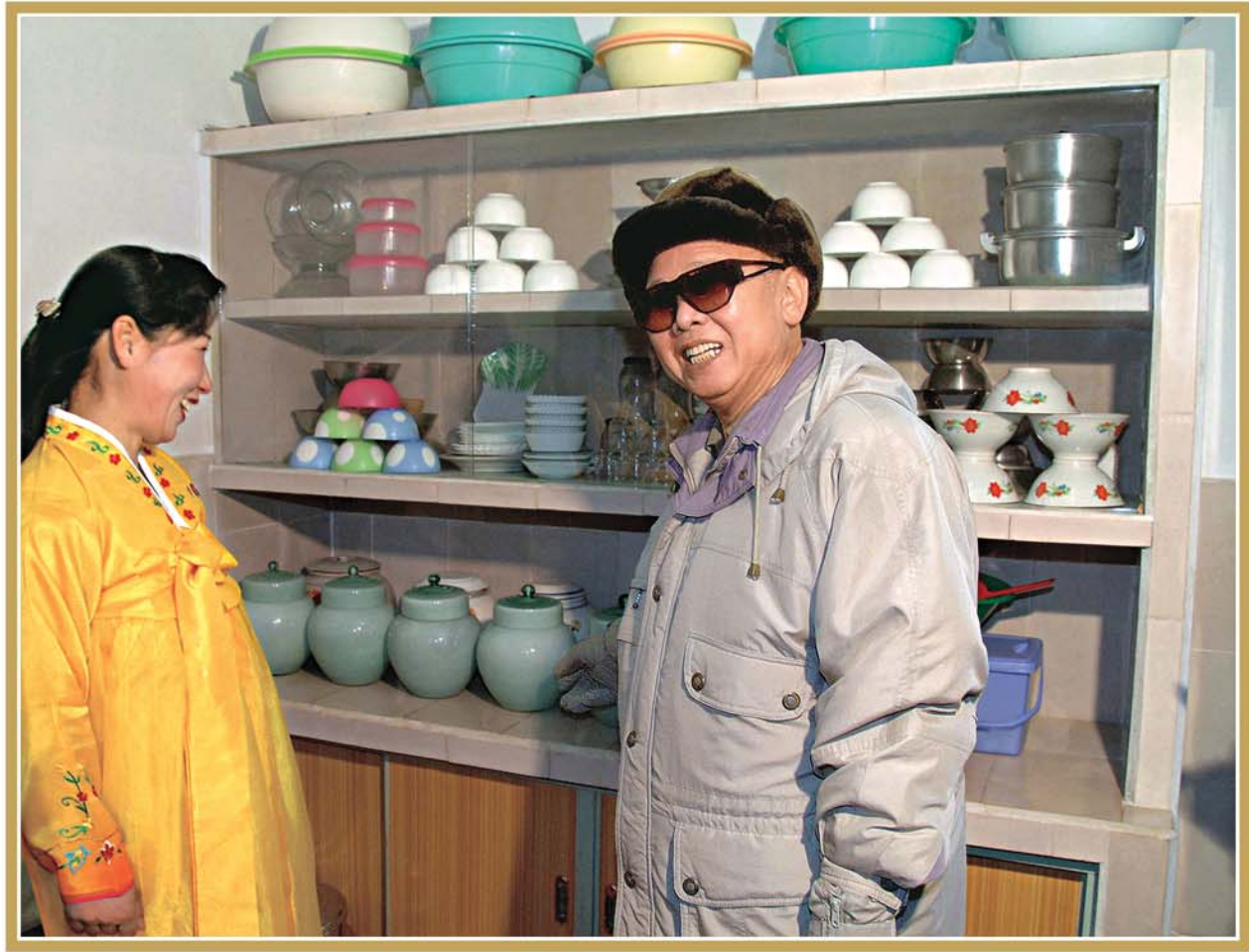
새집들이한 세대군인신혼부부의 가정을 방문하시는 위대한 평도자 김정일동지 주체98(2009)년 1월