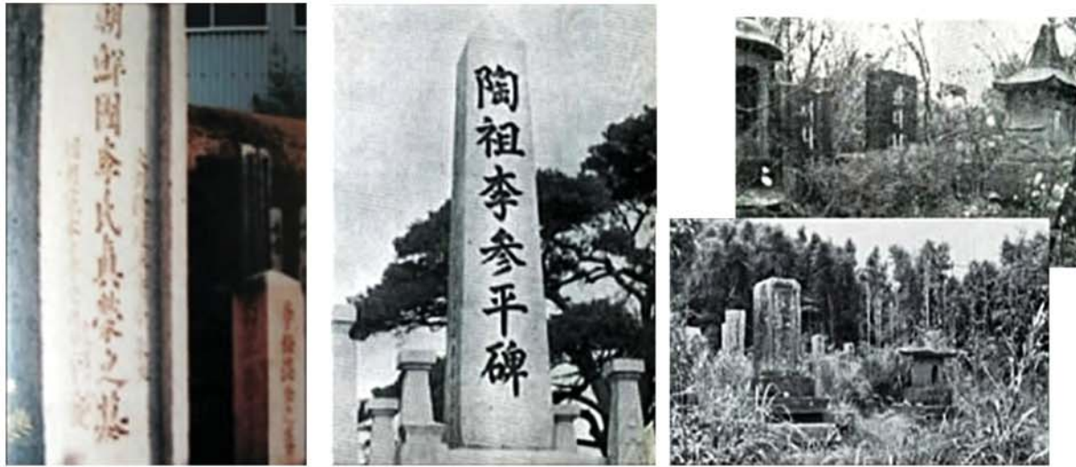
랍치되었던 조선인기술자무덤들의 일부

가. 그리고 당시 홍문관과 춘추관 등에 보관되어있던 수많은 서적들이 불타버렸으며 측우기를 비롯한 관측설비들과 악기와 악제까지 파괴소각되었다.