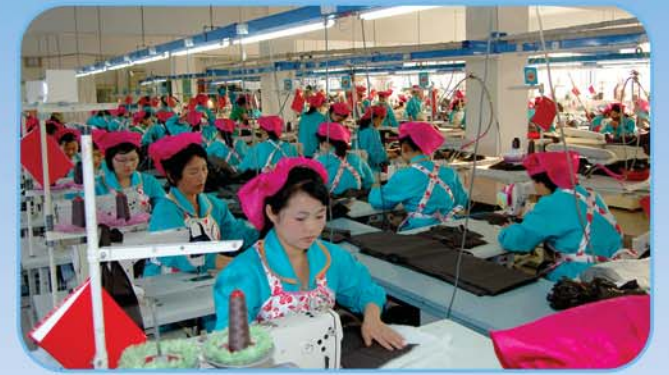
생산의 동음높이 울리는 숙천진성피복공장

일군의 말을 들으며 우리는 읍거리를 돌아보았다. 해방전 농가들이 여기저기 널려있는 자그마한 농촌마을이었던