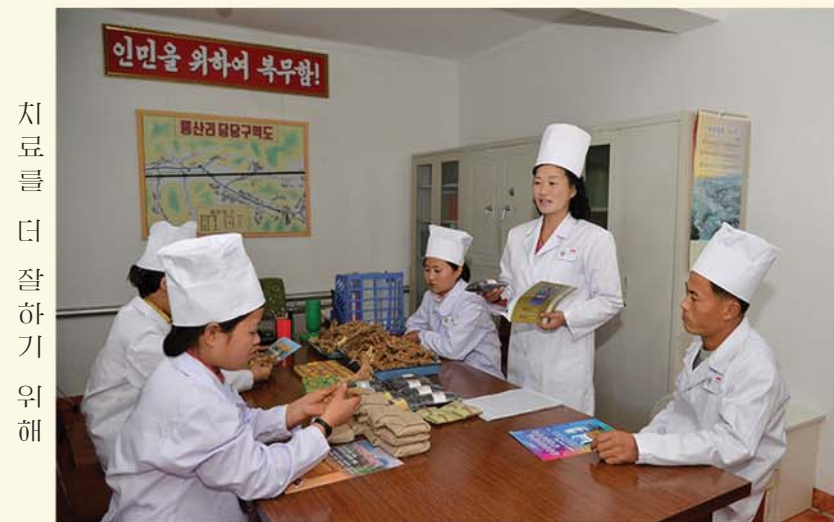
치료를 더 잘하기 위해

조국에는 고려의술로 소문이 난 병원들이 있다. 그중에는 황해북도 중화군 룡산리인민병원도 있다. 이 병원은 행정단위말단 병원중의 하나이다.