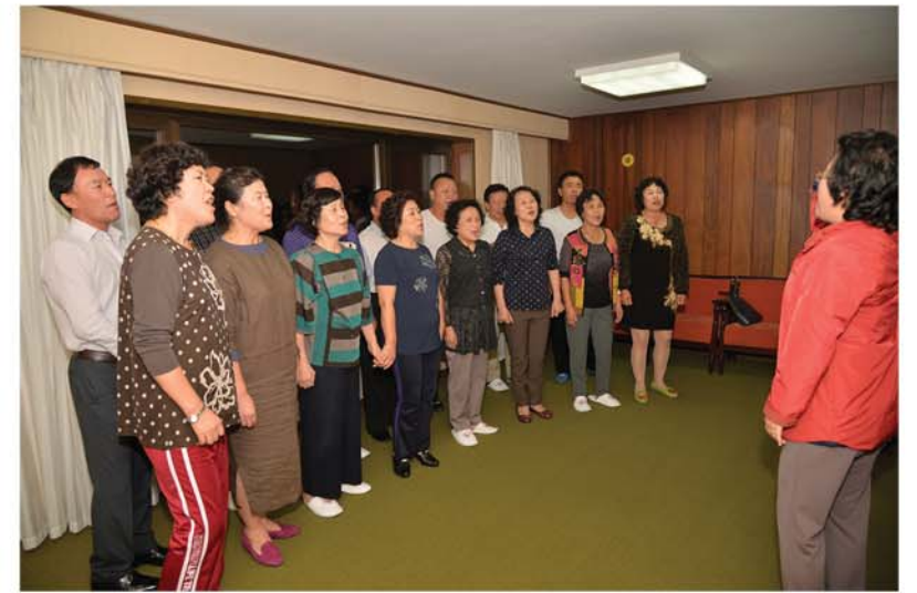
광명성절경축공연을 준비하는 재중동포들 주체104(2015)년 10월 촬영

노래소리와 춤가락은 2월로 향 한 동포들의 불같이 뜨거운 마음을 그대로 보여주었다.