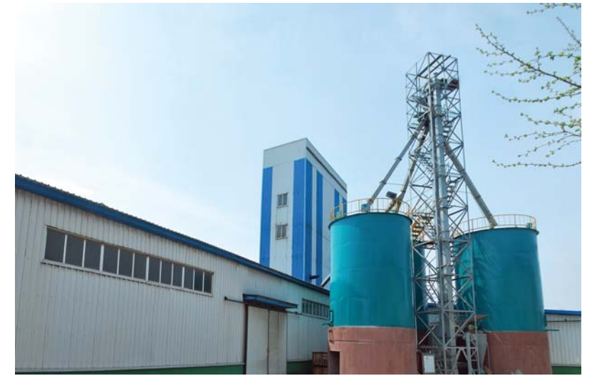
새로 건설한 300t능력의 원료저장탱크