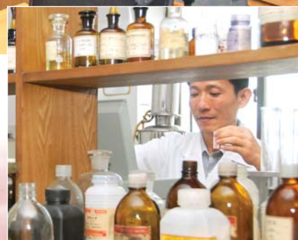
국내원료에 의한 먹이첨가제와 배합사료연구를 심화시키고있다.

료원천을 찾아내고 그것을 적극적으로 리용하기 위한 사업에서도 주목할만 한 성과를 거두고있다. 그런가 하면 배합사료생산에서도 그들은 나라의 실정과 세계적인 발전추세의 요구에 맞게 국내원료를 적극 탐구리용하고있으며 종전의 가루먹이만이 아니라 팽화먹이, 성형먹이생산공정들을 새로 꾸리고 지금 생산을 높은 수준에서 내밀고있다.