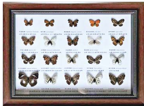
몽골곤충애호가협회와 곤충채집분야에서 교류를 함의하고 나비건본들을 교환하였다.