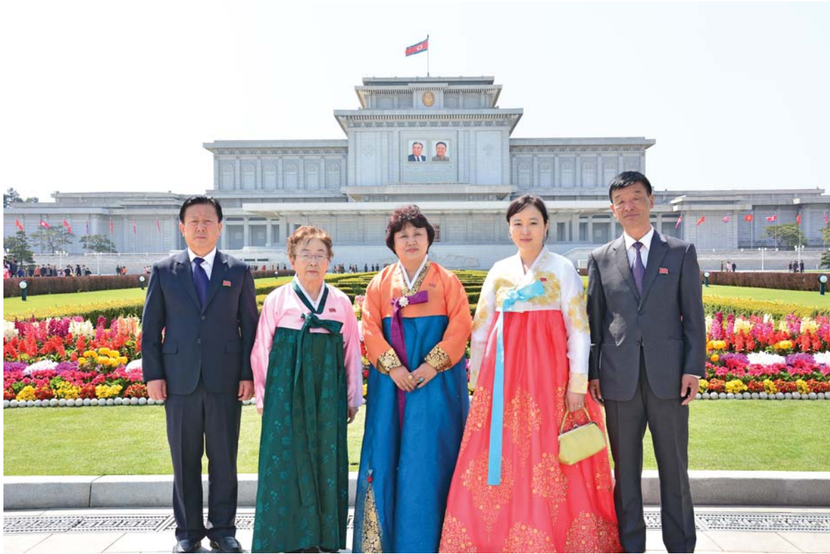
금수산태양궁전을 찾은 재중동포들