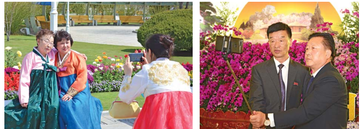
조국에서의 모습을 화면에 담아간다.