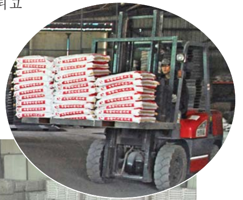
창고를 가득 채운 여러가지 먹이첨가제들