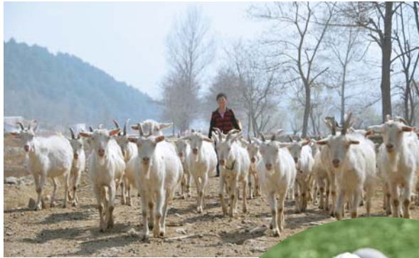
방목지로 나가는 염소떼