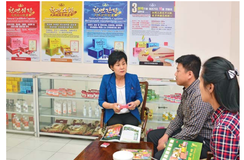
제품에 대한 손님들의 반응도 알아본다.

리가 아프다면 다리를 치료하는 종전의 치료방법에서 벗어나 음과 양의 평형을 맞추면서 5장6부의 균형을 보장해나가는것이 이 천연약제의 작용특성이다.