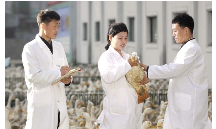
과학적인 수의방역체계를 세워간다.

그리고 짚광이, 삼지구엽초, 삼주를 비롯한 약초들로 집짐승들이 설사를 비롯한 병에 걸리지 않도록 수의약품들을 자체