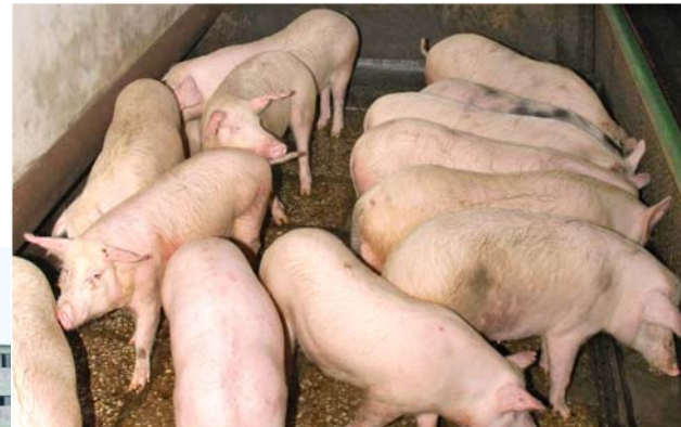
집짐승들이 차넘치는 남흥청년화학연합기업소의 축산기지