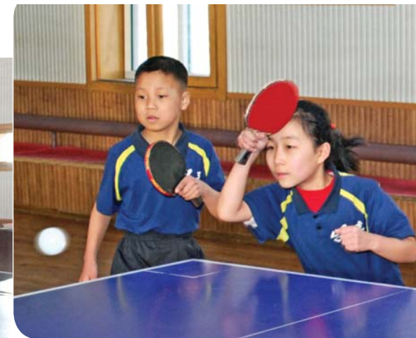
더 높은 목표를 제기하고 훈련에 박차를 가하고있는 소조원들