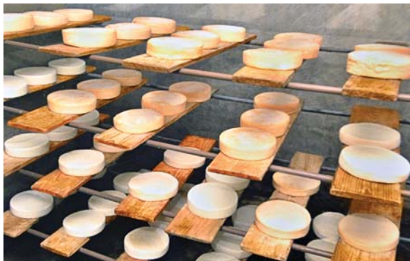
농장의 젓가공실에서 생산되는 치즈