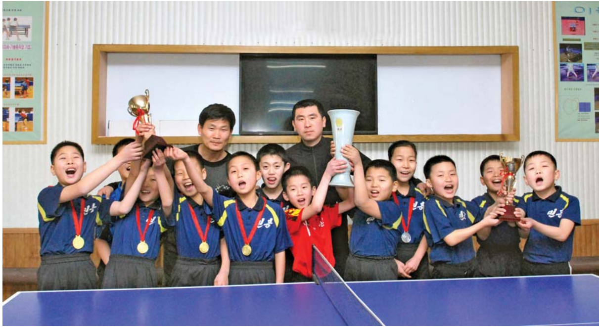
소학교부문 분기탁구경기에서 단체 1등을 쟁취하고