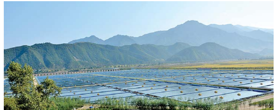
안변군 모퉁리에 꾸려진 민물련어양어장