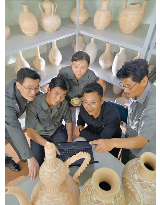
도안창작에 열중하는 창작가들