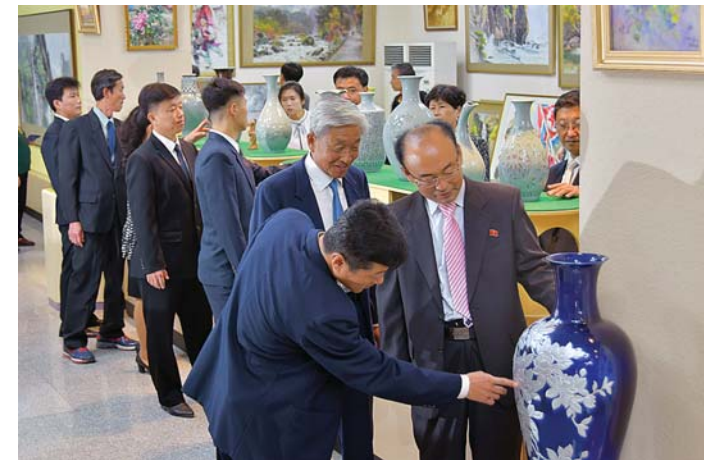
창작품에 대한 의견을 교환한다.