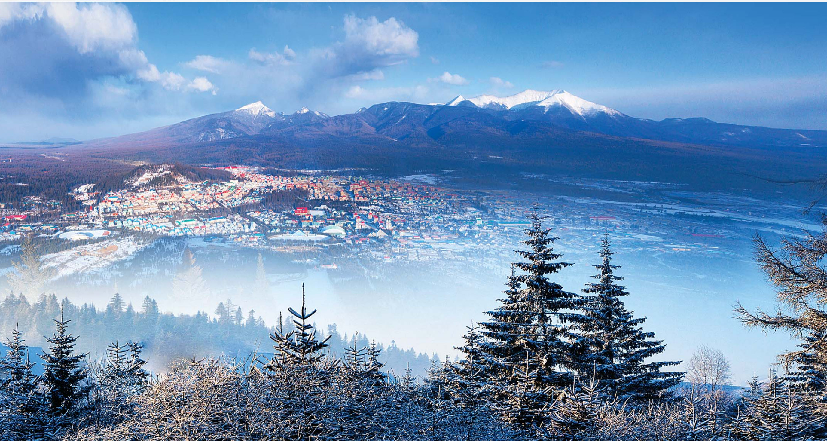
백두산아래 펼쳐진 삼지연시의 아침