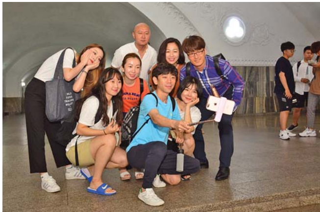
평양지하철도참관을 기념하여 찰카

《정말 훌륭하다.》 《5월1일경기장에 들어가기 전부터 가슴이 울렁거렸는데 공연이 시작되니 심장이 막 부풀어오르는것만 같았다. 멋있다.》 《참다운 예술을 보았다.》 이것은 지난해에 진행된 대집단체조와 예술공연 《인민의 나라》를 보며 중국 연변대학교원학생조국전습대표단 성원들이 한결같이 터친 말이다. 그들은 대집단체조와 예술공연에 넋을 빼