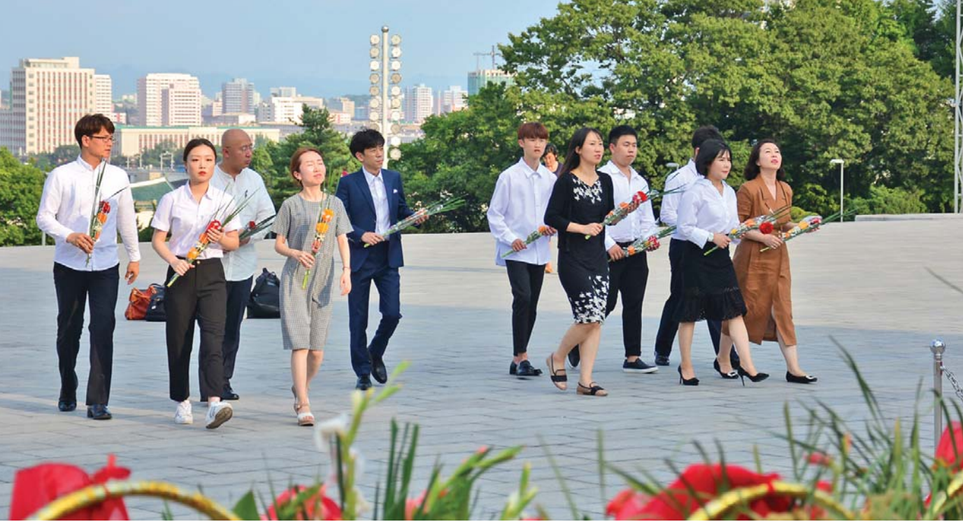
위대한 수령님들의 동상에 꽃다발을 드리었다.