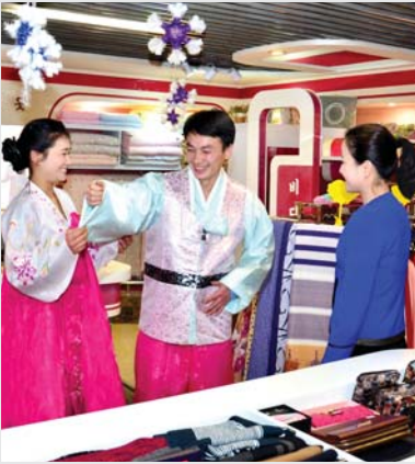
표지: 《우리 민족옷이 제일이요!》 주제108(2019)년 촬영

《우리 민족옷이 제일이요!》 룡흥비단상점에서 조선비단 으로 만든 민족옷을 입고 어쩔 줄 모르는 남성.