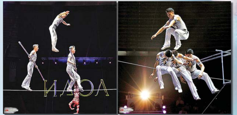
《이돌-2018》세계교예예술축전에서 2개의 금상을 받은 체력교예 《쇠줄타기》

이 작품들은 조선민속놀이인 그네와 널뛰기를 교예화한 민족교예작품들입니다.