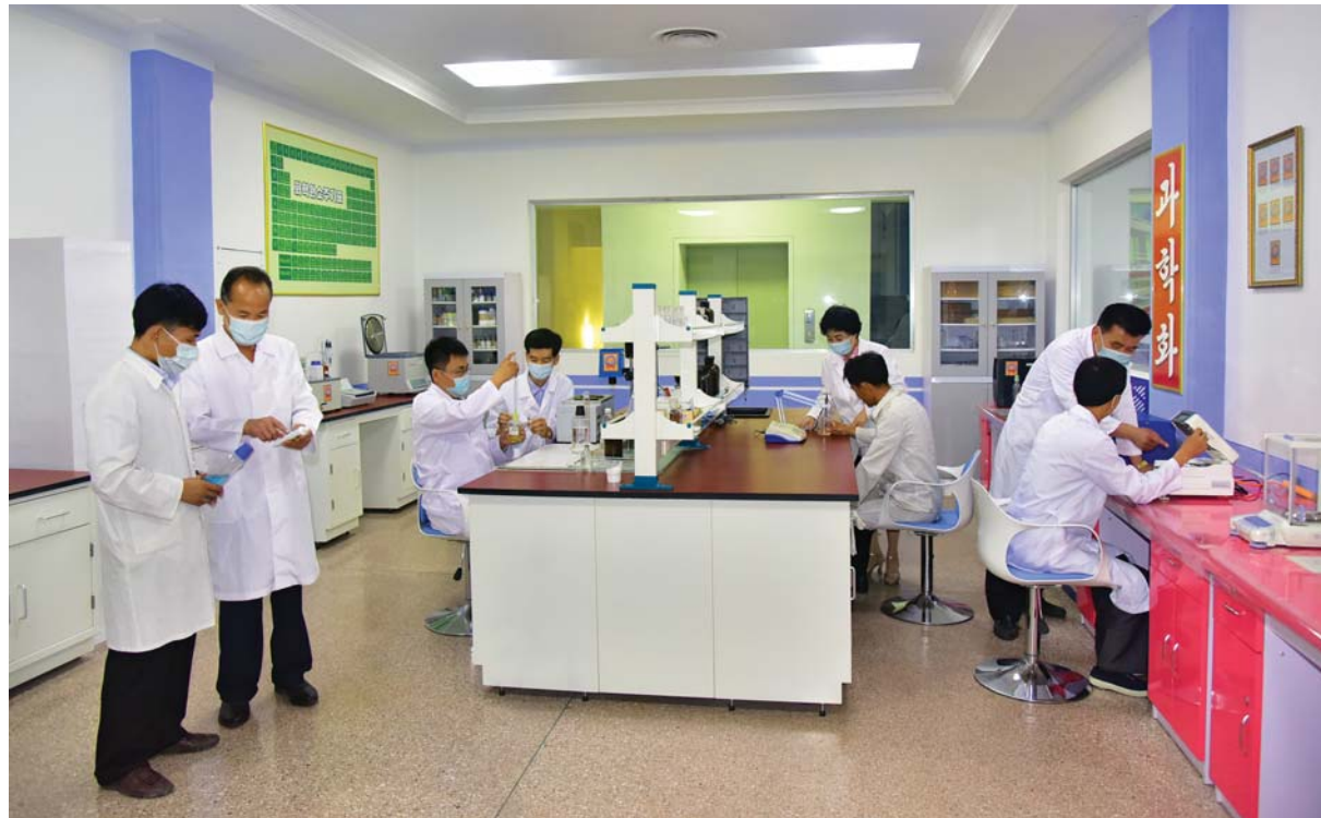
원료의 국산화, 재자원화를 위해 노력하는 연구사들

위한 첨가제연구를 비롯하여 세 부적인 항목에 따르는 연구들도 구체적으로 따라세움으로써 지 금 삼지연들쪽음료공장에서 생 산되는 제품들이 많은 사람들속 에서 인기를 모으고있다.