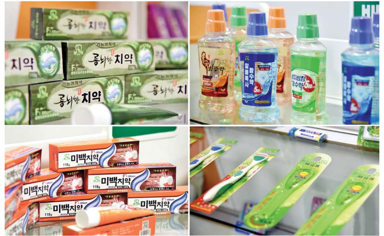
공장에서 생산된 제품들의 일부