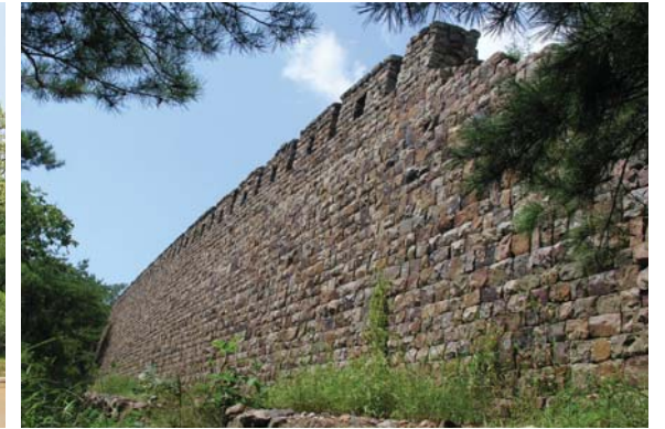
대성산에 있는 고구려시기 역사유적들의 일부 광범사(왼쪽), 대성산성(오른쪽)

으로 하여 사계절 푸른빛을 띠는 대성산은 그 풍치가 류달리 아름다워 예로부터 평양8경의 하나로 꼽아왔다.