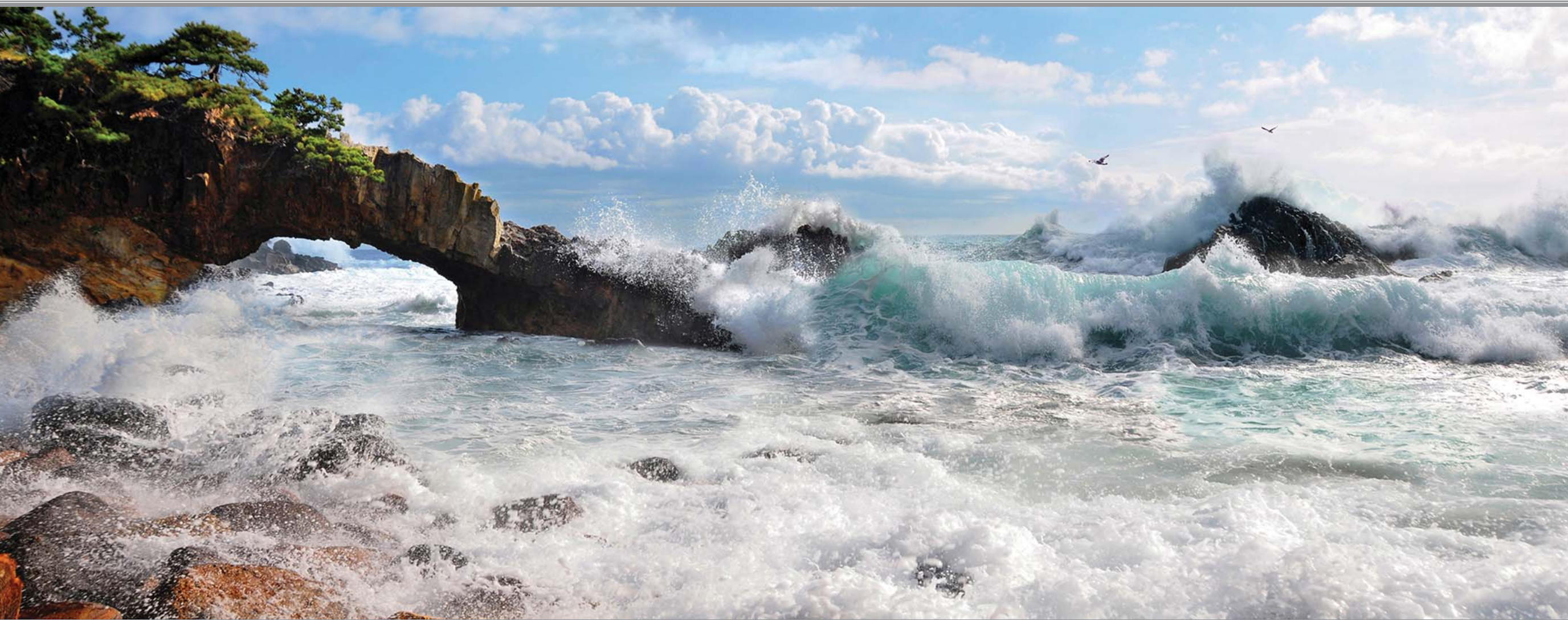
해 칠 보 의 파 도