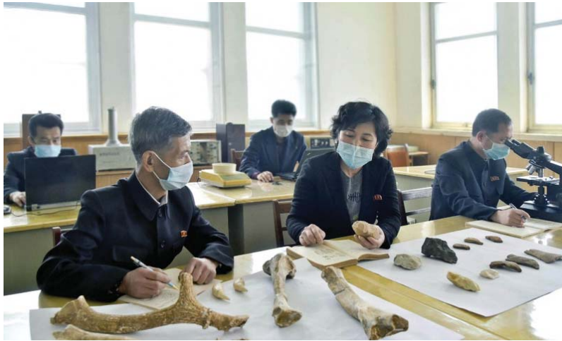
발굴된 유물들에 대한 연구를 진행하고있는 고고학자들