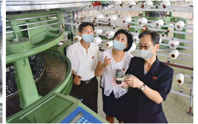
선진기술도입을 위해 생산 현장들을 료해하고있는 대학의 연구사들