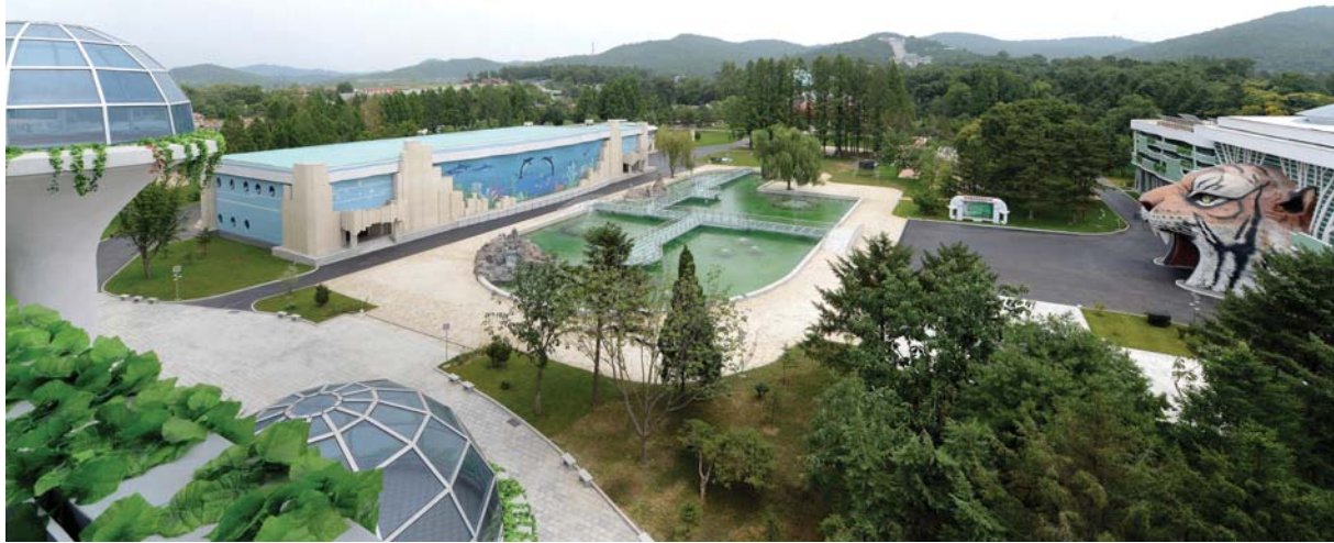
문화정서생활거점, 교육거점으로 꾸러진 중앙동물원