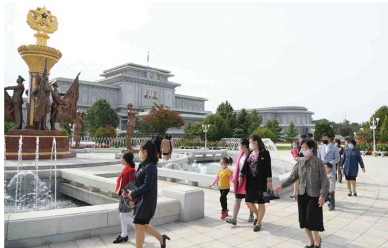
금수산태양궁전을 찾은 각계층 근로자들