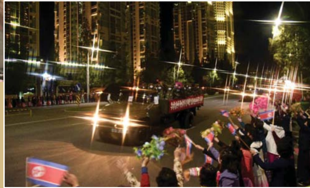
평양시민들의 환영을 받으며 수도의 거리를 지나는 조선로동당창건 75돐경축 열병식참가자들