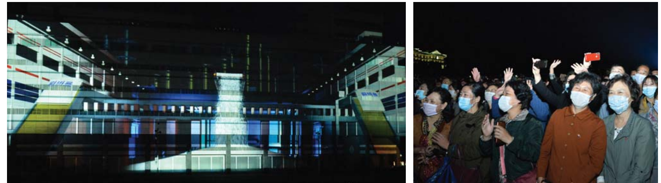
조명축전 《빛의 조화-2020》