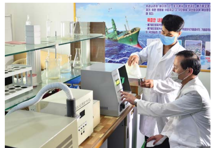
배기름에 의한 바다오염을 막기 위한 기술적문제들을 해결해가고있다.

게 연구제작하고 분석설비들을 현대적으로 갖추으로써 해난사고와 대기오염을 미연에 방지하고있다.