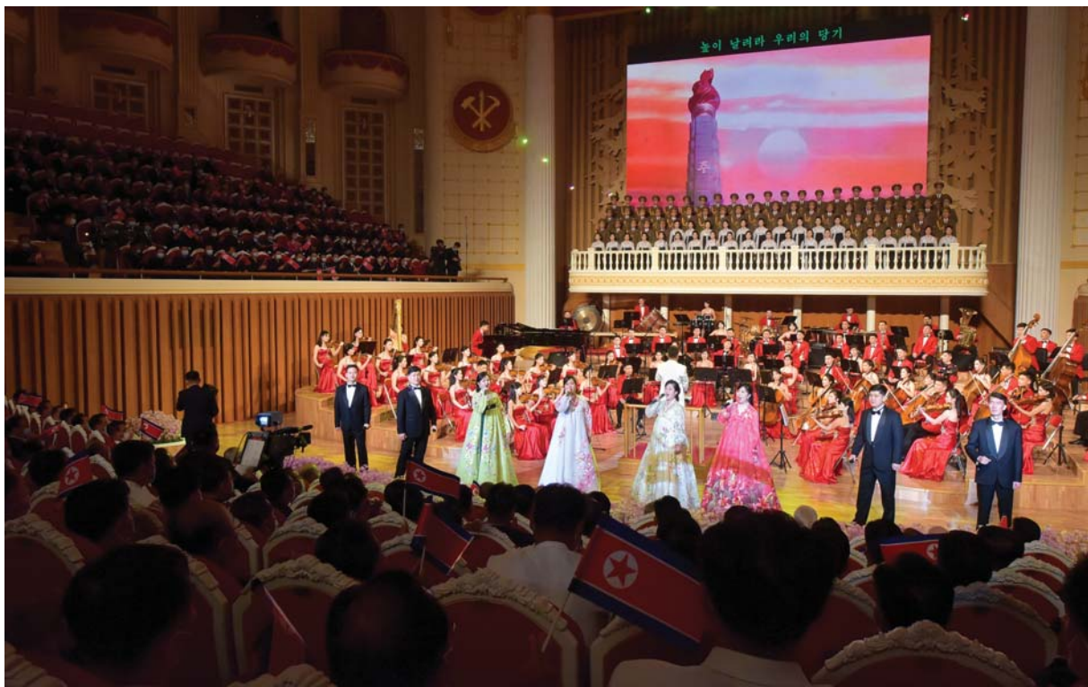
절찬속에 진행된 삼지연관현악단공연

《어머니생일》, 《우리는 당기를 사랑하네》, 《당이어 나의 어머니시여》를 비롯한 조선로동당에 대한 송가들은 관중을 심원한 음악세계로 이끌어갔다.