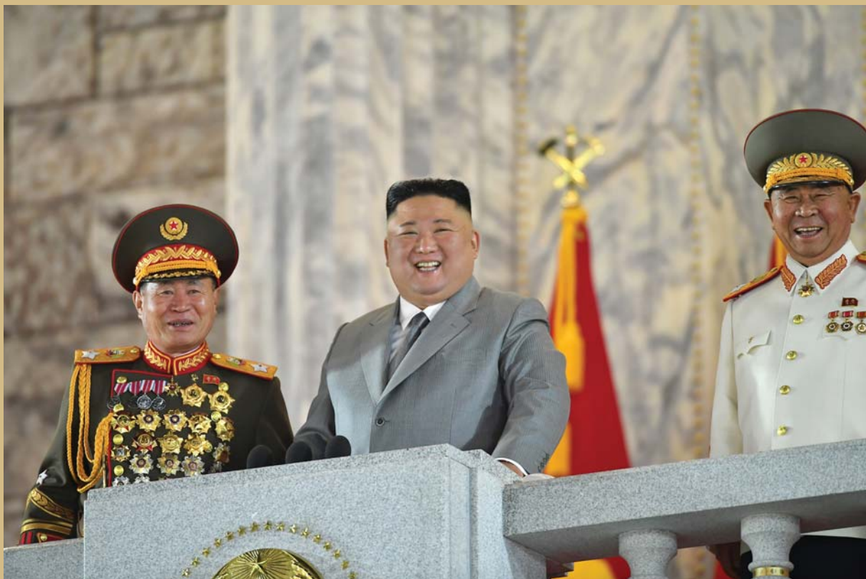
조선로동당창건 75돛경축 열병식에 참석하신 우리 당과 국가, 무력의 최고령도자 김정은동지

조국에서 당창건 75돛을 경축하는 열병식이 김정은원수님께서 열병식에 참석하시여 열병종 김일성광장에서 성대하게 거행되었다. 대들에 답례를 보내시였다.