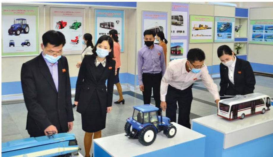
중앙산업미술전시회장(왼쪽)과 조선우표전람회장(오른쪽)을 찾은 각계층 근로자들