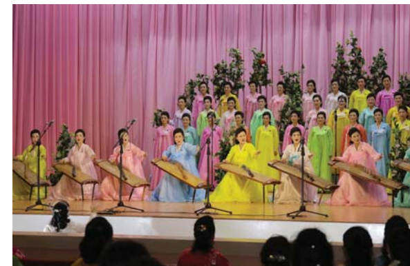
녀맹예술소조원들의 공연 《어머니 우리 당 영원히 따르리》