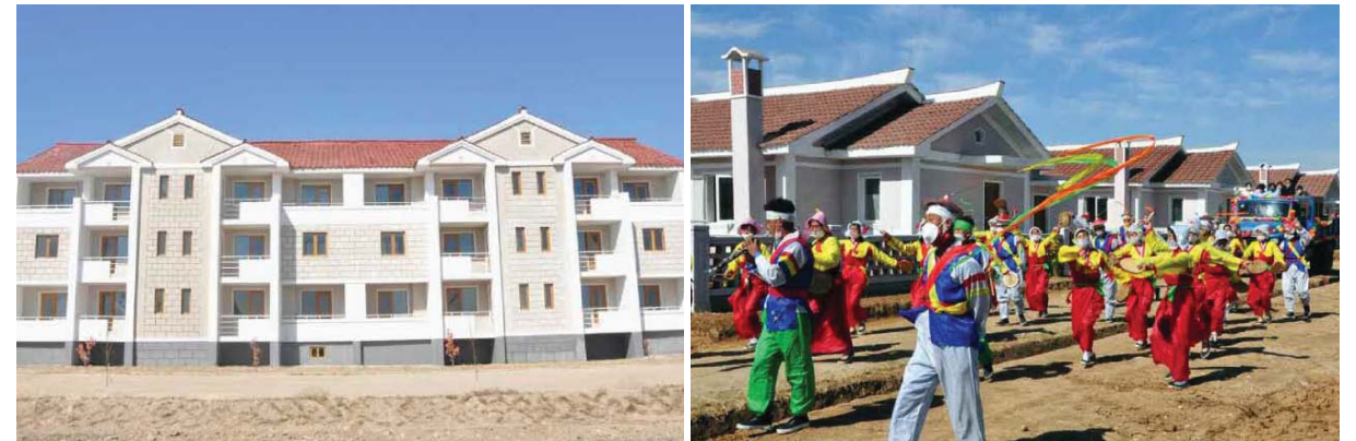
개성시와 황해북도, 황해남도의 피해지역들에 새로 일떠선 마을들에서 새집들이가 진행되었다.

합농장은 우리 나라의 표준화된 과수종합농장으로서의 면모를 더욱 완벽하게 갖추게 되었다.