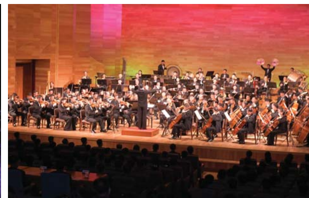
만수대예술단, 왕재산예술단 합동공연(왼쪽)과 국립교향악단음악회(오른쪽)가 진행되었다.