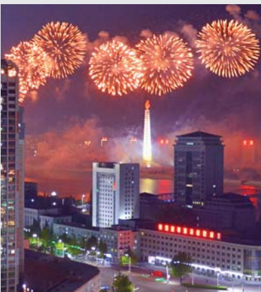
뒤표지: 10월의 축포