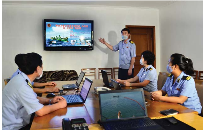
해양환경보호문제를 토론하고있는 중앙해양환경보호조종소 일군들

사실 처음 해보는 일여서 조종소의 성원들은 적지 않은 애로와 난관을 겪지 않으면 안되었다. 하지만 그들은 작업의 순차와 제거방법