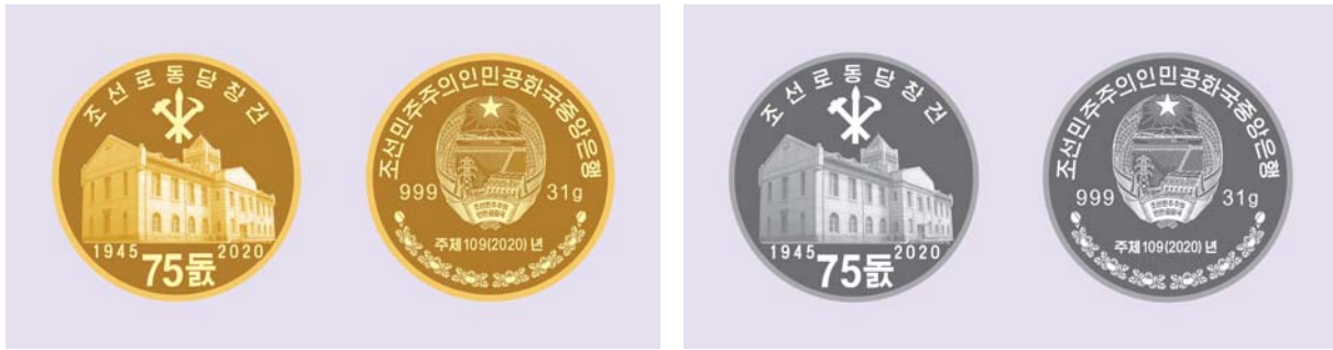
기념주화 《조선로동당창건 75돐》 금화(왼쪽)와 은화(오른쪽)

선혁명의 첫 기슭에서 혁명적 동지애의 시원을 열어놓으시고 준엄한 년대들을 동지적단결로 빛내여오신 위대한 수령님과 위대한 장군님의 숭고한 력사를 다시금 뜨겁게 간직하였다.