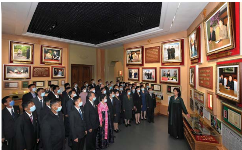
《위대한 수령님들과 전우관》을 돌아보는 조선로동당창건 75돐 경축대표들

조선로동당창건 75돐을 맞으며 수도 평양에서는 다양한 전람회들과 축전들이 열리어 10월의 명절분위기를 더해 주었다.