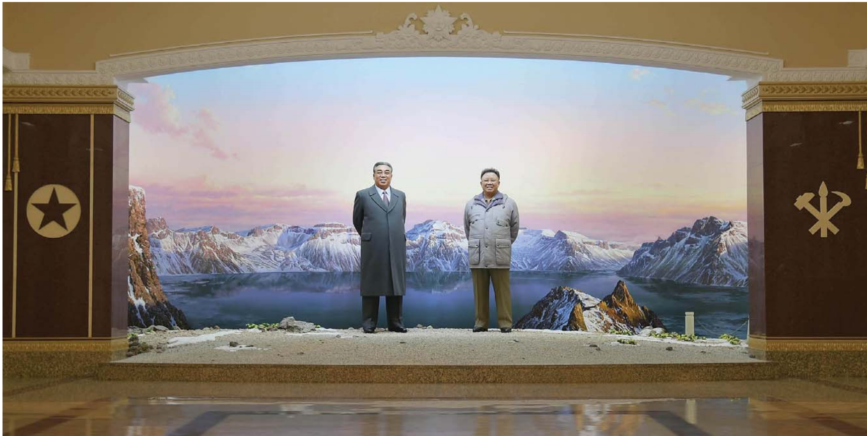
조선혁명박물관에 《위대한 수령님들과 전우관》이 새로 꾸러졌다.