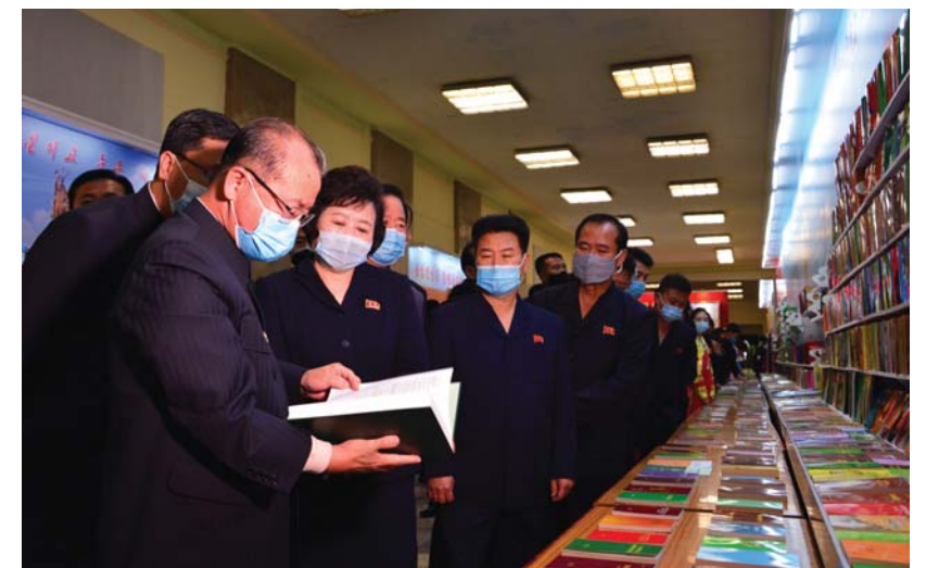
중앙사진전람회와 국가미술전람회, 국가도서전람회가 진행되었다.