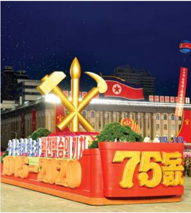
표지: 경축의 광장