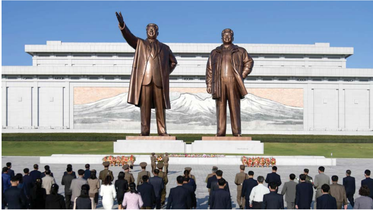
만수대언덕에 모셔진 위대한 수령 김일성동지와 위대한 령도자 김정일동지의 동상에 일군들과 근로자들, 인민군장병들이 꽃바구니와 꽃다발을 진정하였다.

위대한 수령 김일성동지와 위대한 령도자 김정일동지에 대한 그리움이 더욱 간절해지는 당창건기념일인 10월 10일.