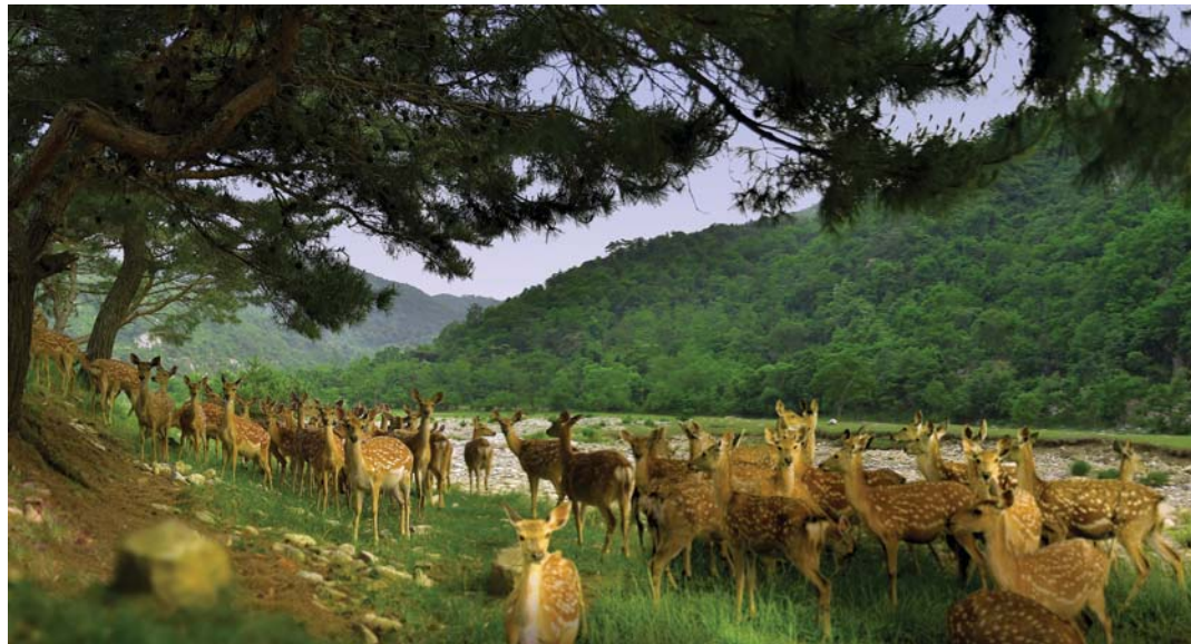
야생동물들을 많이 꺾이기 위한 사업이 활발히 진행된다. 주체108(2019)년 촬영