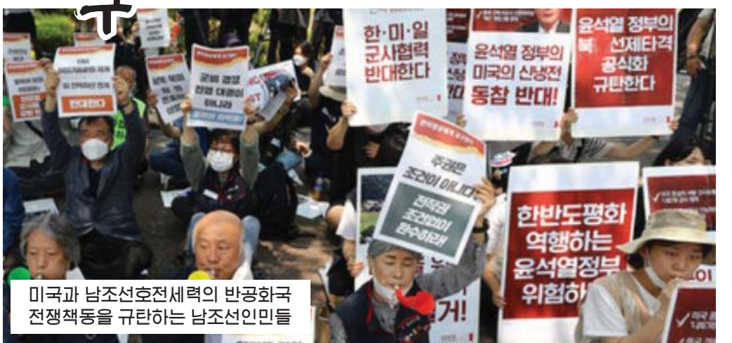
미국과 남조선호전세력의 반공화국 전쟁책동을 규탄하는 남조선인민들