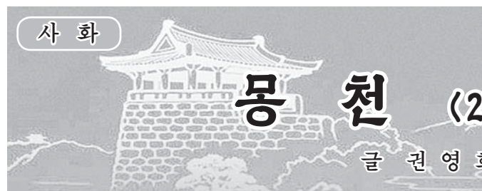
몽천 (2) 글 권영희, 그림 김윤일

그들이 마당안에 들어서자 우물에서 무엇인가 썩고있던 불목 하나가 일어나 공손히 절하며 《어서 오십시오. 어떻게 오셨습니까?》 하였다.