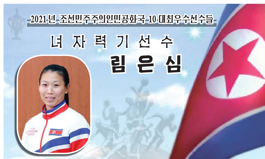
2021년 조선민주주의인민공화국 10대최우수선수들

- 2019년 아시아력기선수권대회 여자 64kg급 경기에서 3개의 금메달 쟁취.