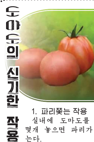
도마도의 신기한 작용

1. 파리꽃은 작을 실내에 도마도를 심은 화분을 몇개 놓으면 파리가 들어오지 않는다.