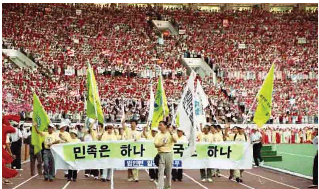
《민족의 자주와 대단결을 위한 99 통일대축전 10차 범민족대회 (락칭 범민족통일대축전)》(1999년 8월)