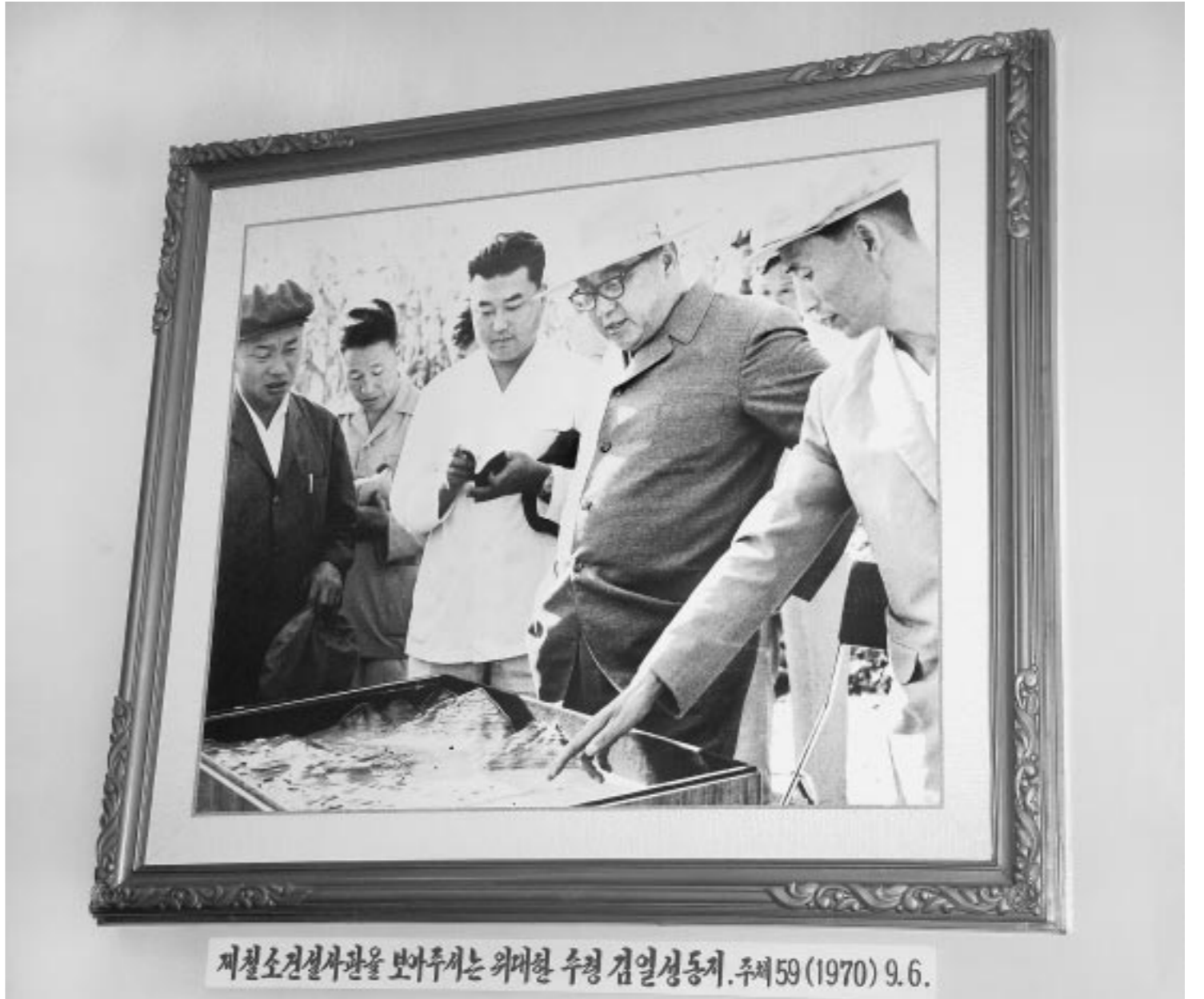
제철조건실사관을 보아주시는 위대한 수령 김일성동지. 주체59(1970) 9.6.