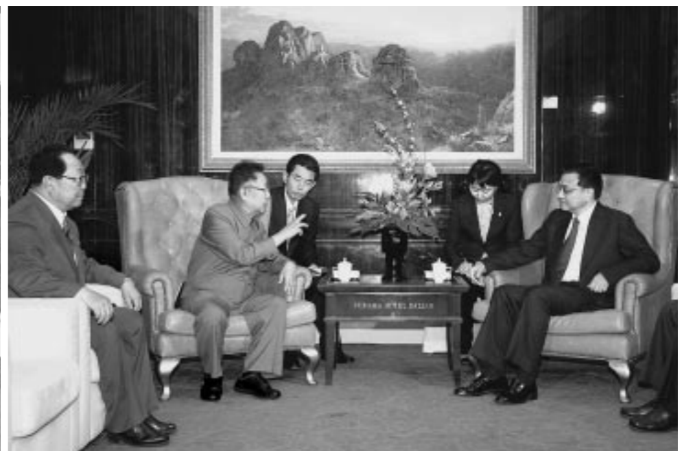
위대한 령도자 김정일동지께서 리극강동지와 상봉하시 고 담화를 하시였다.