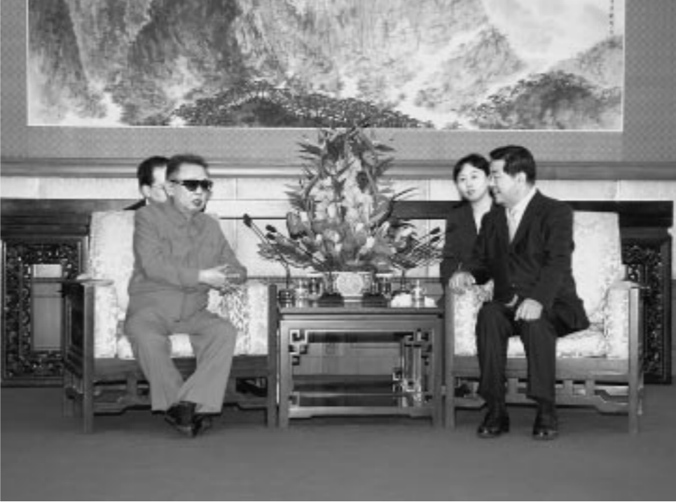
위대한 령도자 김정일동지께서 가경림동지와 담화를 하시였다.