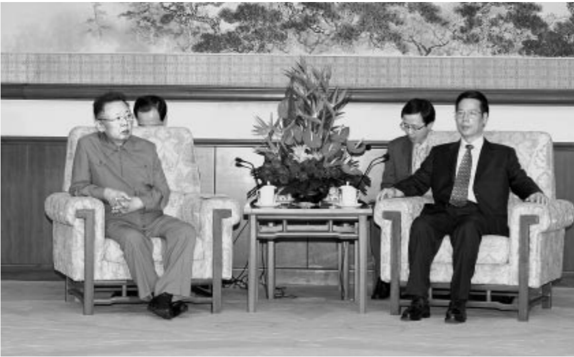
위대한 령도자 김정일동지께서 장고려동지와 따뜻한 담화를 하시였다.