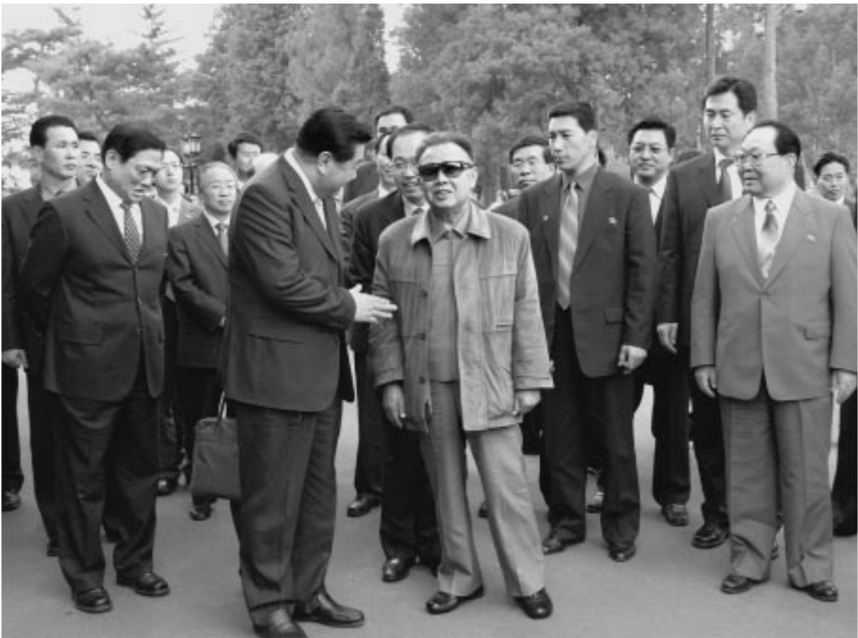
위대한 령도자 김정일동지께서 가경림동지와 만나시였다.