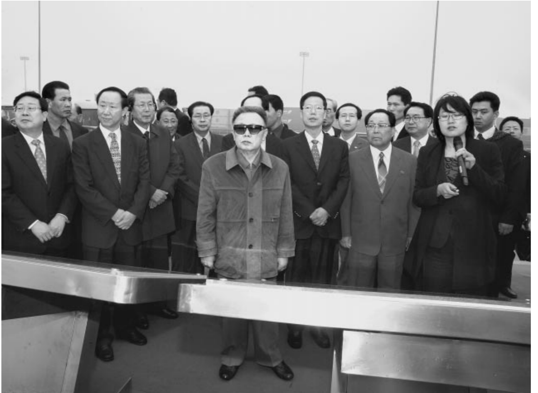
위대한 령도자 김정일동지께서 전진항을 참관하시였다.