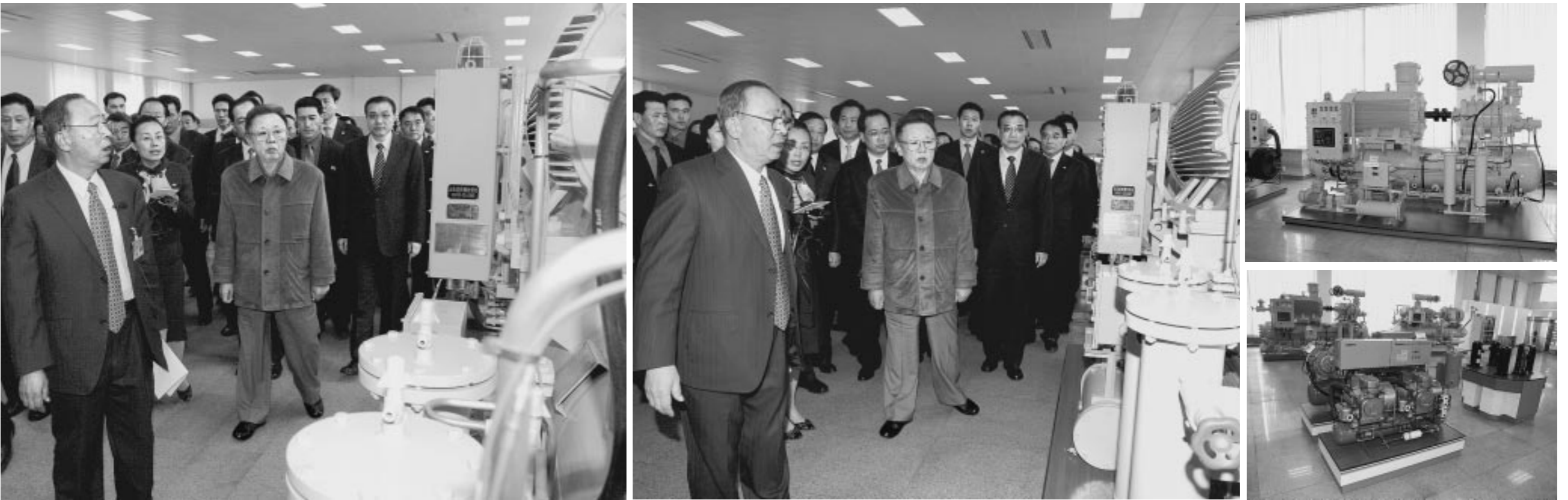
위 대한 령 도 자 김 정 일 등 지 께 서 대 련 방 산 그 루 을 참 관 하 시 었 다 .