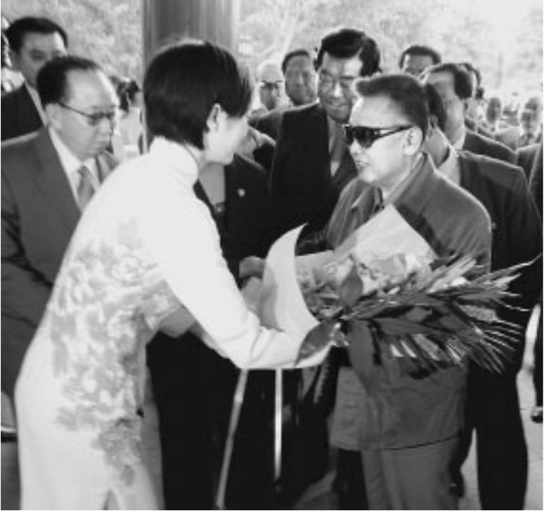
위대한 령도자 김정일동지께서 꽃다발을 받으시였다.