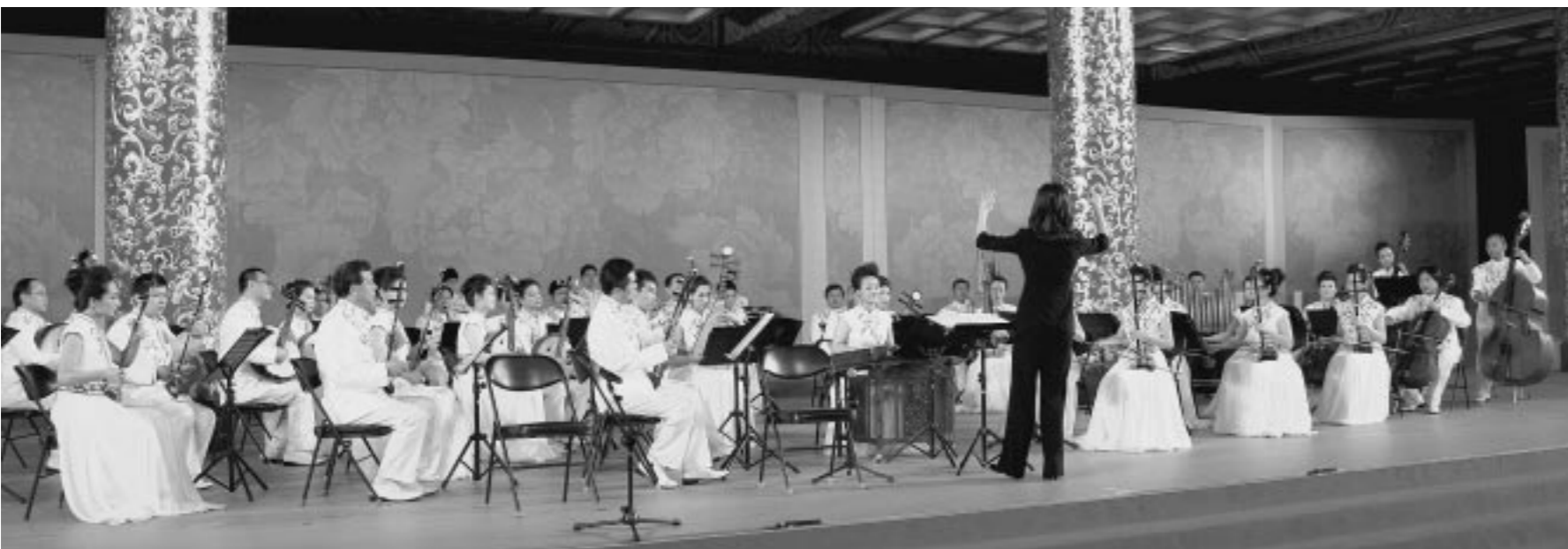
위대한 령도자 김정일동지를 환영하는 예술인들의 공연