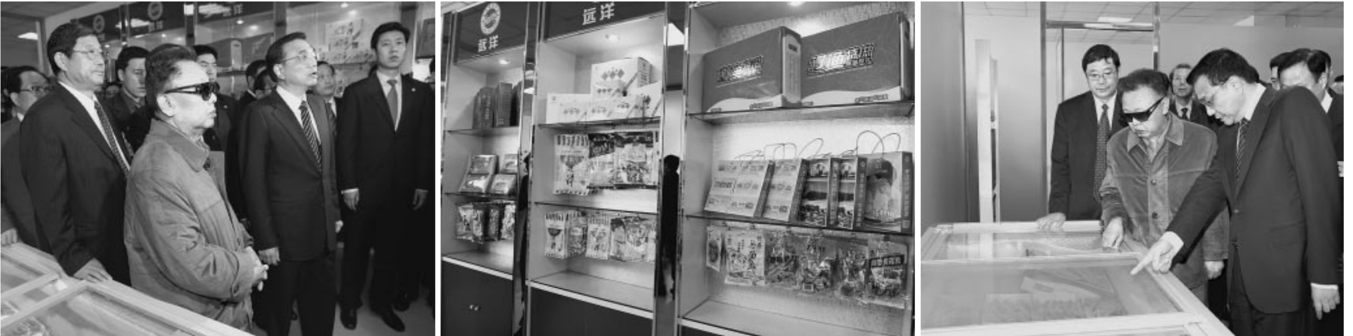
위 대한 령 도 자 김 정 일 등 지 께 서 료 병 어 업 그 루 을 참 관 하 시 었 다 .