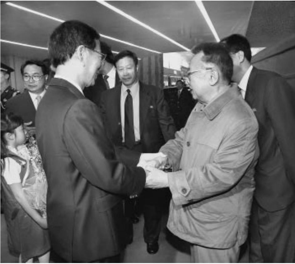
위대한 령도자 김정일동지께서 중국공산당 중앙위원회 정치국 위원이며 천진시당 서기인 장고려동지와 만나시였다.