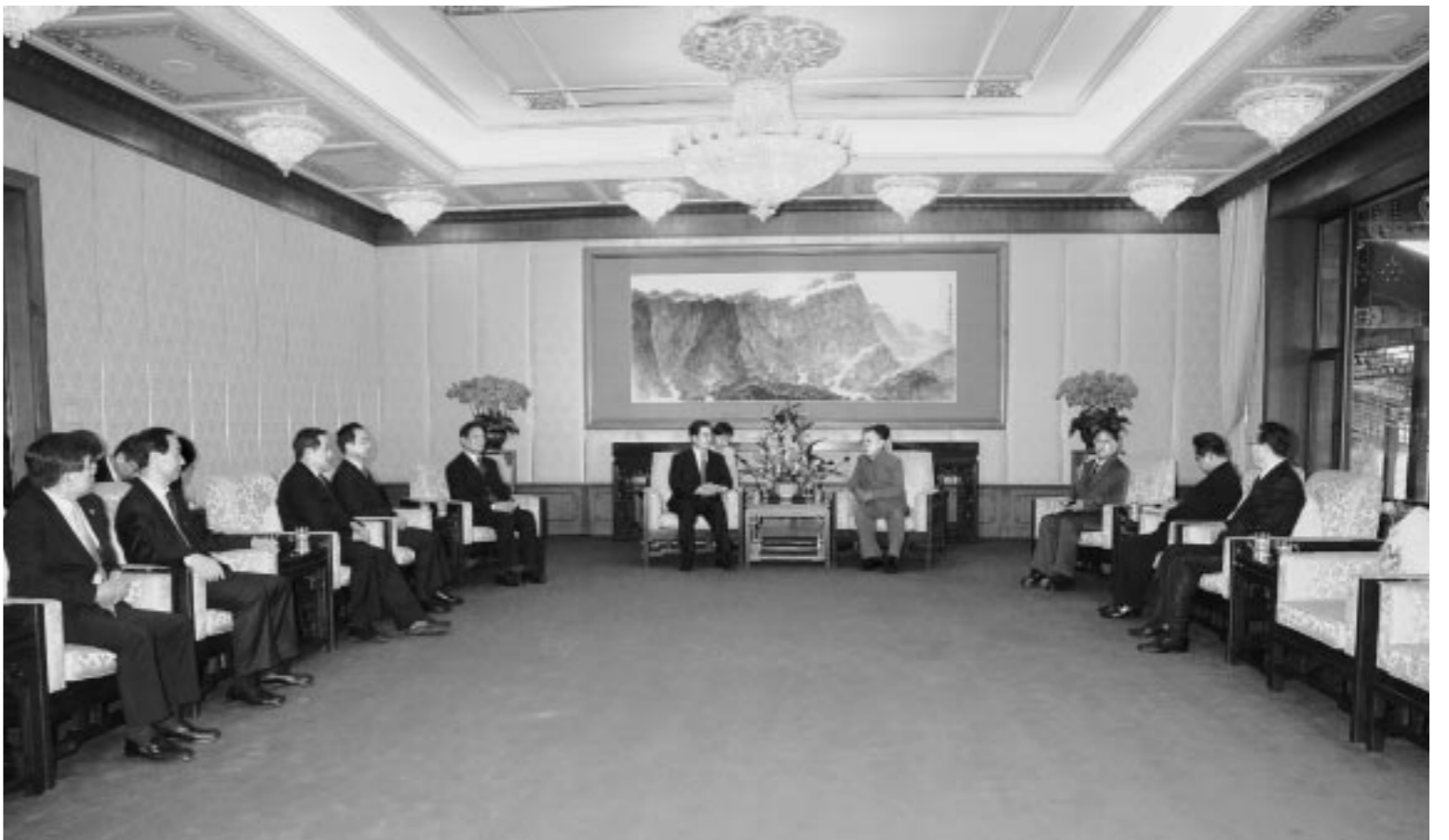
위대한 령도자 김정일동지께서 숙소를 방문한 호금도동지와 담화를 하시였다.