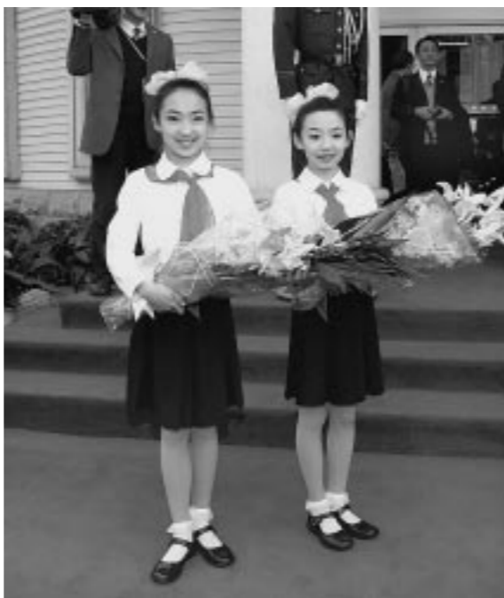
위대한 령도자 김정일동지께서 어린이가 향기그득한 꽃다발을 드린였다.