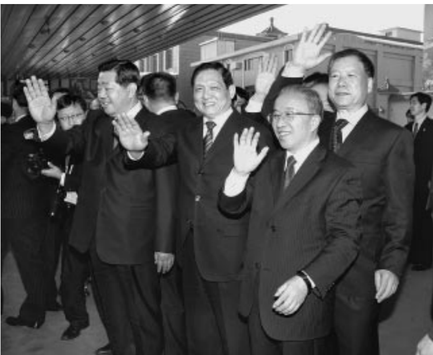
위대한 령도자 김정일동지께서 베이징을 출발하시였다.