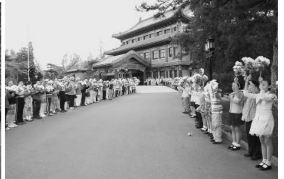
위대한 령도자 김정일동지께서 열렬한 환영을 받으시였다.