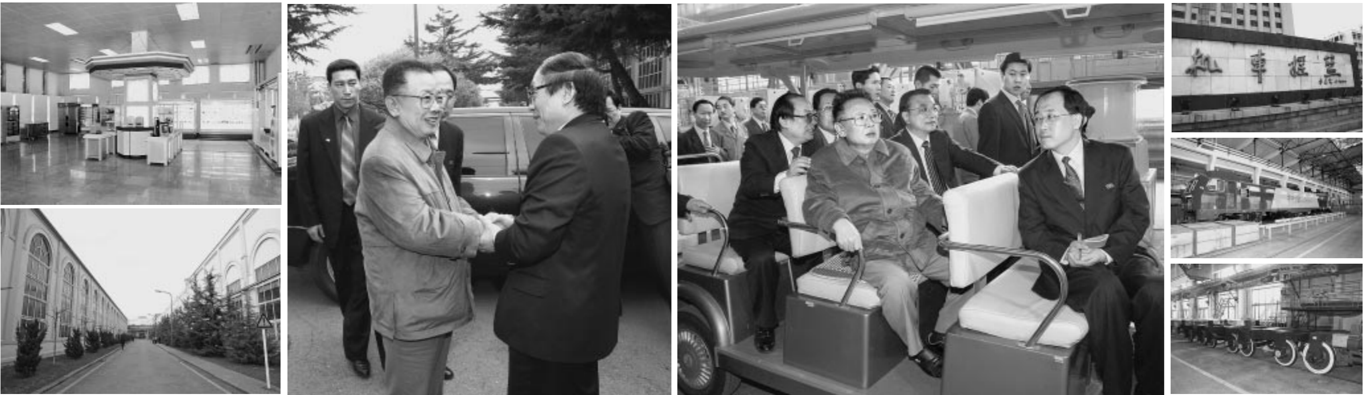
위 대한 령 도 자 김 정 일 등 지 께 서 대 련 기 관 차 생 산 공 사 를 참 관 하 시 었 다 .