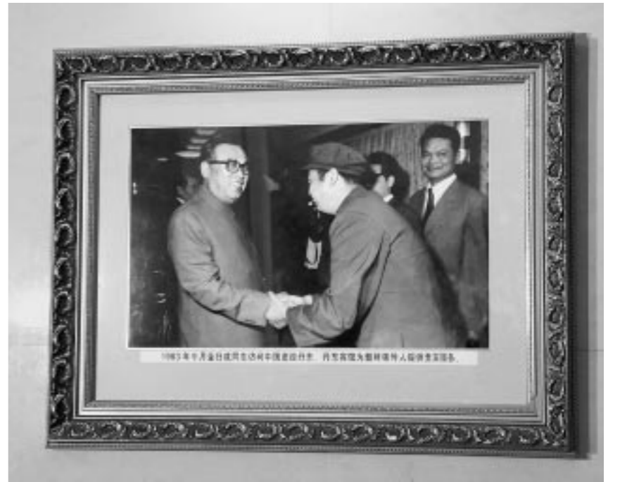
← 위대한 령도자 김정일동지께서 아버지수령님의 사적이 깃든 단동영빈관을 돌아보시였다.