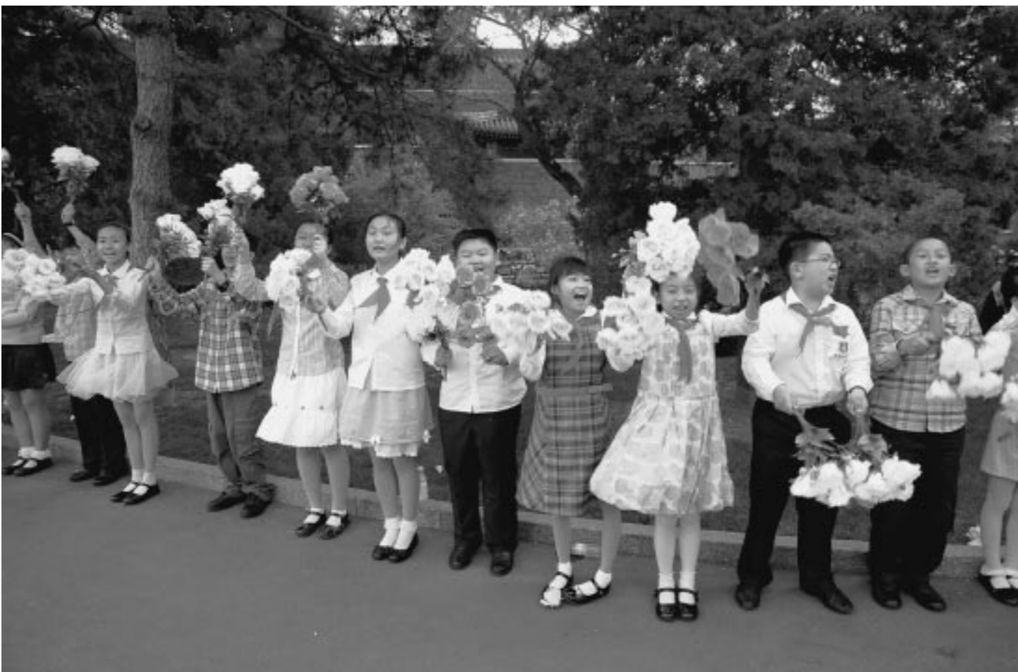
위대한 령도자 김정일동지께서 뉘시러국빈관에서 열렬한 환영을 받으시였다.