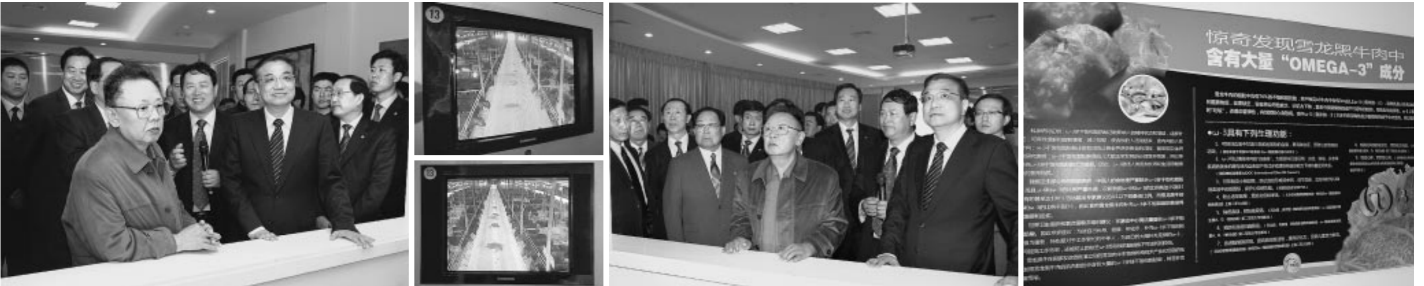
위 대한 령 도 자 김 정 일 등 지 께 서 대 련 설 룡 산 업 그 루 을 참 관 하 시 었 다 .