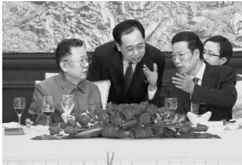
위대한 령도자 김정일동지를 환영하여 장고려동지가 연회를 차리였다.