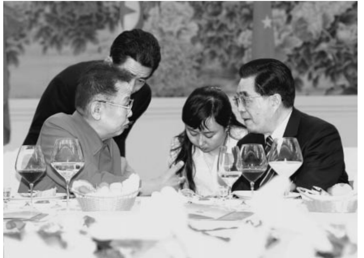
↑ 위대한 령도자 김정일동지께서 존경하는 호금도동지와 따뜻한 담화를 하시였다.