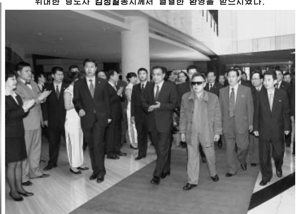
위대한 령도자 김정일동지께서 대련에 도착하시였다.