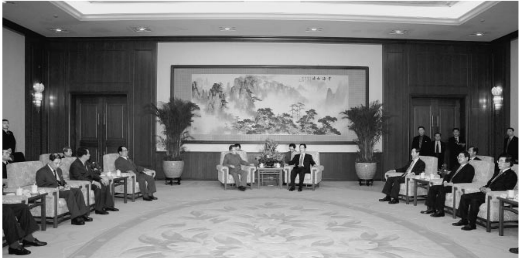
위대한 령도자 김정일동지께서 장고려동지와 따뜻한 담화를 하시였다.