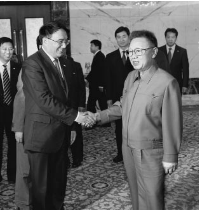
위대한 령도자 김정일동지께서 료녕성당 서기 왕민동지를 만나시였다.