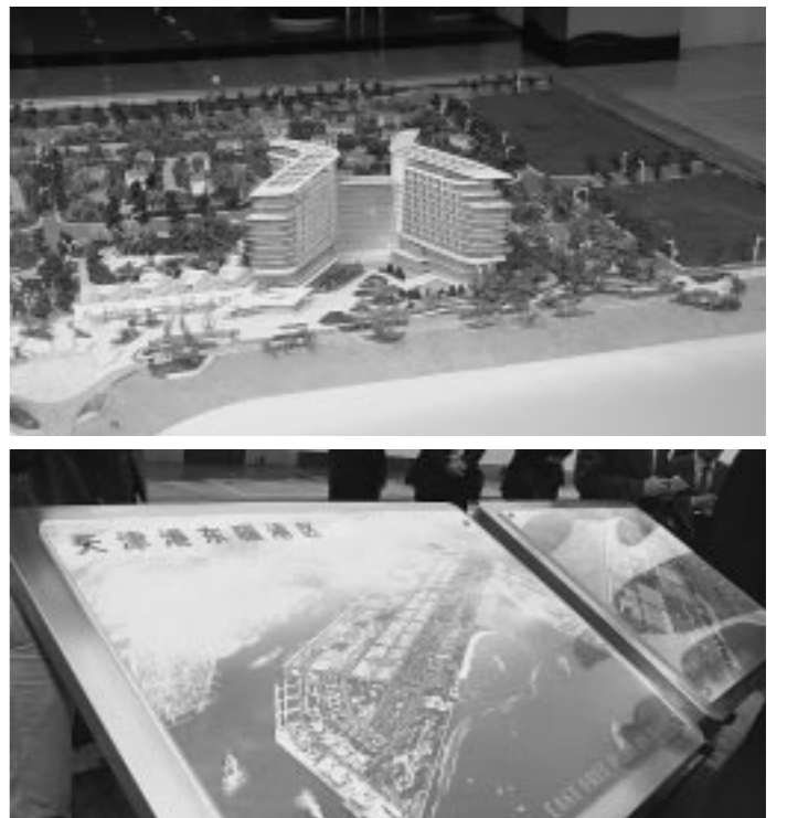
위대한 령도자 김정일동지께서 천진항을 참관하시였다.