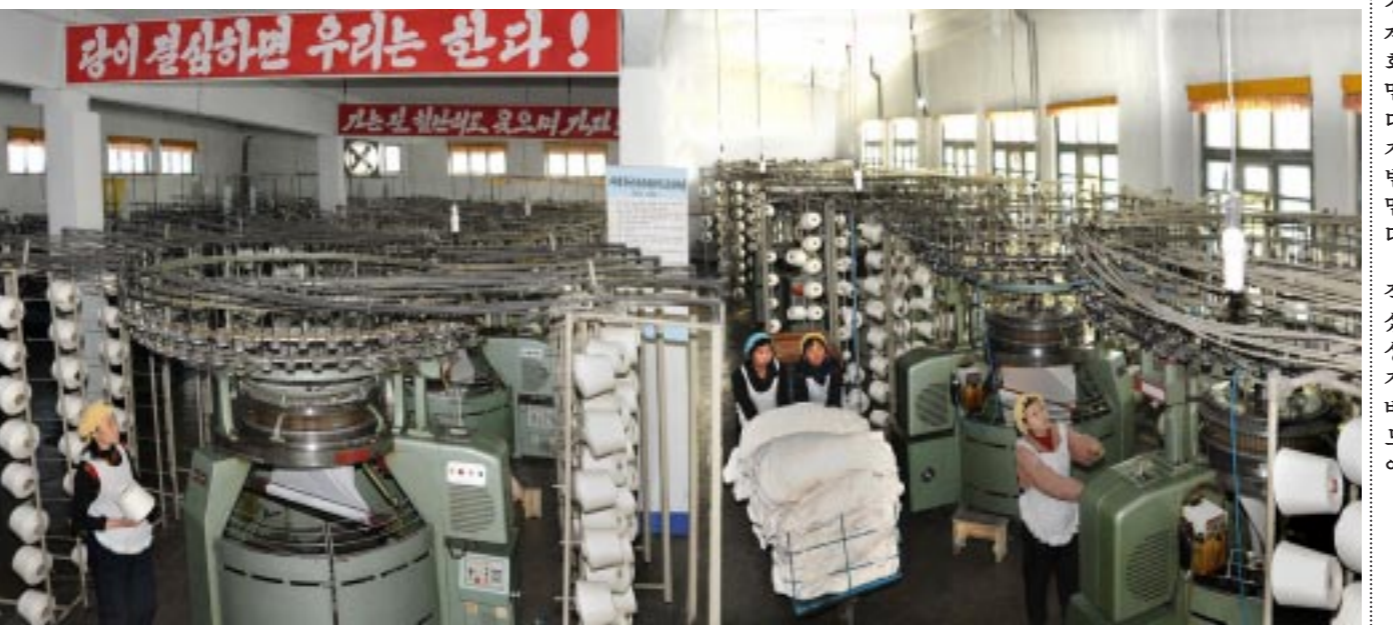
공동사설에 제시된 전투적과업을 받들고 질 좋은 편직품을 더 많이 생산하기 위해 힘찬 투쟁을 벌이고있다. -평양어린아이편직공장에서-

우리가 박천견직공장의 생산현장에 서서 만난 사람들은 모두 평범한 사람들이였다. 하지만 이들에게는 과학기술과 생산을 밀접히 결합시킬데 대한 공중사회의 전례적 과업을 철저히 구현하여 생산공정의 현대화에 참담하게 이바지하기 위해 애쓰는 대고조시대 선봉투사들이였다.