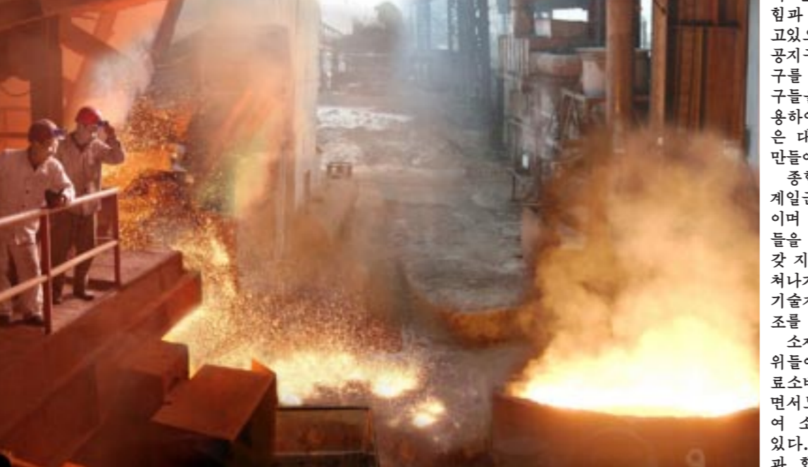
대고조의 불길드높이 철강재생산지에서 혁신을 일으키고 있다. - 한해계철련합기업소에서 - 최충성 적음

이로 하여 제품의 질을 높여나가고있다. 주강작업의 로동자, 기술자들은 전기로를 비롯한 설비들의 운전조작을 기술규정과 표준작업법에 요구대로 하고있다. 작업에서는 실정에 맞게 개조한 대형전조와 이동식전조로 리용률을 높이고있으며 여러가지 가치있는 기술 혁신안과 합리화안을 생산에 제때에 받아들이기 위한 투쟁에 박차를 가하고있다. 단조작업에서는 교차생산조직을 잘하고 설비들의 효율을 높이기 위한 사업을 짜고들며 매일 계획을 넘쳐 수행하고있다. 판매직장에서는 로동자들의 기술능수준을 높이기 위한 기술학습과 현장에서의 기술전수를 실속있게 진행하는 한편 설비들의 만가동을 보장하는데 큰 힘을 넣어 벨트콘베어알개와 추, 베이링질 등 제품생산에서 력인 혁신을 일으키고나가고있다. 권양직장과 채탄직장의 일군들과 로동자, 기술자들은 서로의 창조적지혜와 힘을 합쳐 생산을 마감단계에서 힘있게 내밀고있다. 려합기업소에서는 최첨단돌과정을 위한 투쟁에서 거둔 성과를 확대하며 유리한 생산조건을 주동적으로 마련하는데 계속 큰 힘을 넣고있다. 특파기자 리성호