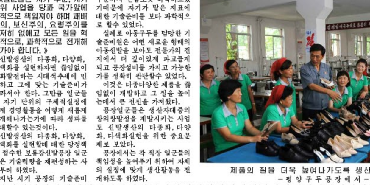
제품의 질을 더욱 높여나가기로 생산자대중을 이끌어가고있다. - 평양구두공장에서 -

합목적재가공공장 일꾼들의 사업에서 합목적재가공공장 일꾼들이 잘한것은 비상한 각오에 높은 목표와 완강한 실천을 따라해나갔다고 볼수 있다. 제품의 질제고에 철저히 필요한 연마기들을 수입에 의존해서가 아니라 자체의 힘으로 짧은 기간에 제작하기 위한 대단한 작전을 펼친것이 그 하나의 실례이다. 자기 생산물품을 비롯한 일꾼들은 자기 단위 제품의 질을 국가와 인민앞에 전적으로 책임진다는 방침에서 출구장에 여러 목재가공단위들을 돌아다니며 새로 나온 연마기들에 대한 기술적문제를 토로하였고, 기술과자 리용공급부는 비록 논으로 한 번 본질적 위협이 주저없이 설에 달려붙었다. 닳과 밤이 따로없는 강강한 전투를 벌려 보충없는 도면을 완성하였다. 자기 힘으로 새것을 창조하기 위한 투쟁의 길에는 난관도 가로놓일수 있다. 그러나 백번 넘어져도 일어나서 일어났던 때처럼 끈기 있는 길을 끝까지 걸리는 정신력만 강하면 어떤 실례의 고비도 헤쳐넘을수 있다. 공정일꾼들은 예비제작에 필요한 철관과 쇠파이프를 비롯한 자재물품을 내부에비를 동원하는 방법으로 풀어나갔다. 공무조합 작업반의 로동자들은 기술자들과 힘을 합쳐 예비제작에 착수하였다. 연마기제작에서 예로든것은 회전수가 높았는데 맞게 연마기주동바퀴와 종동바퀴제작에서 정력적 및 동력적조정을