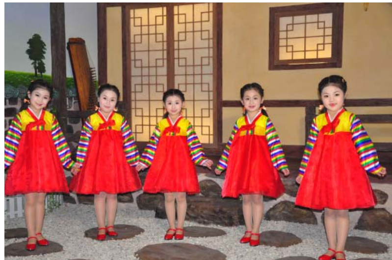
TV편집물에 출연한 동대원구역 동대원1유치원 어린이들