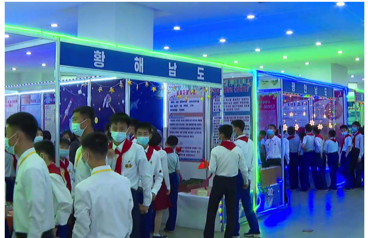
《전국소년과학환상문예작품 및 모형전시회-2023》을 돌아보는 학생소년들