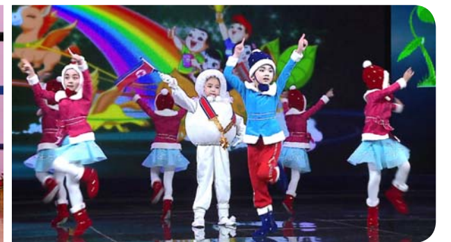
TV로 방영된 아동예술무대에 출연한 중구역 신양주유치원 어린이들