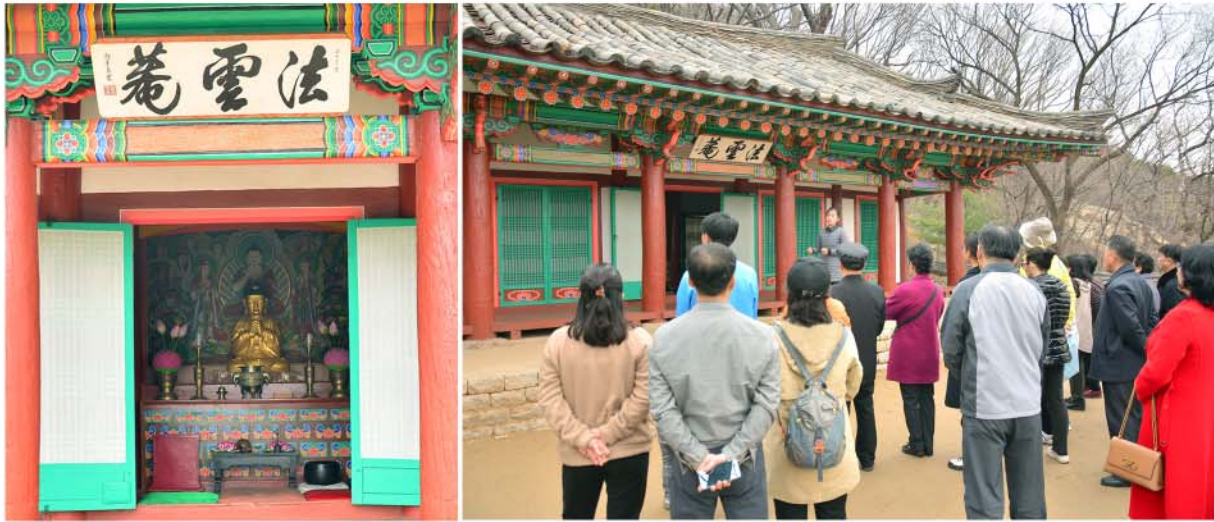
법운암을 찾은 근로자들