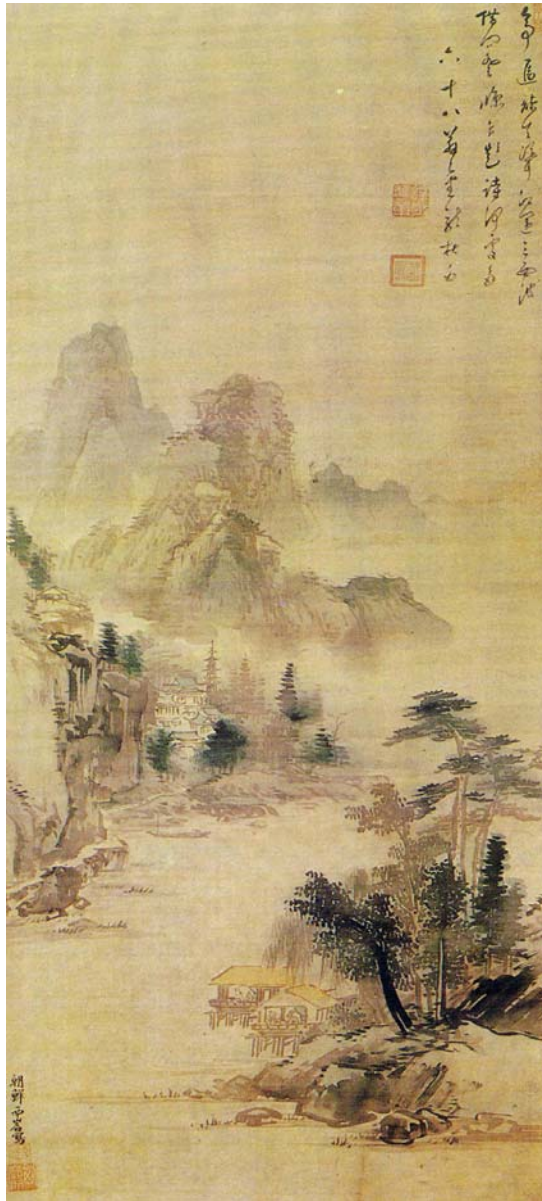
《산수도》 118.5×49.3cm 비단·담채

정선이라고 하면 금강산을 풍경화에 담아낸 재능있는 화가로서 17세기말부터 18세기중반까지 산수화의 새로운 경지를 개척하여 우리 나라 풍경화발전에 크게 기여한 사실주의적화가이다.