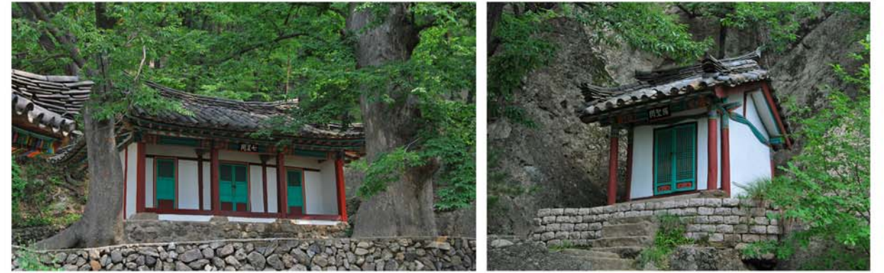
범운암 부속건물들의 일부

해외동포여러분, 그럼 이번호부터 조국의 력사유적을 찾아 우리와 함께 기행길을 이어가 봅시다.