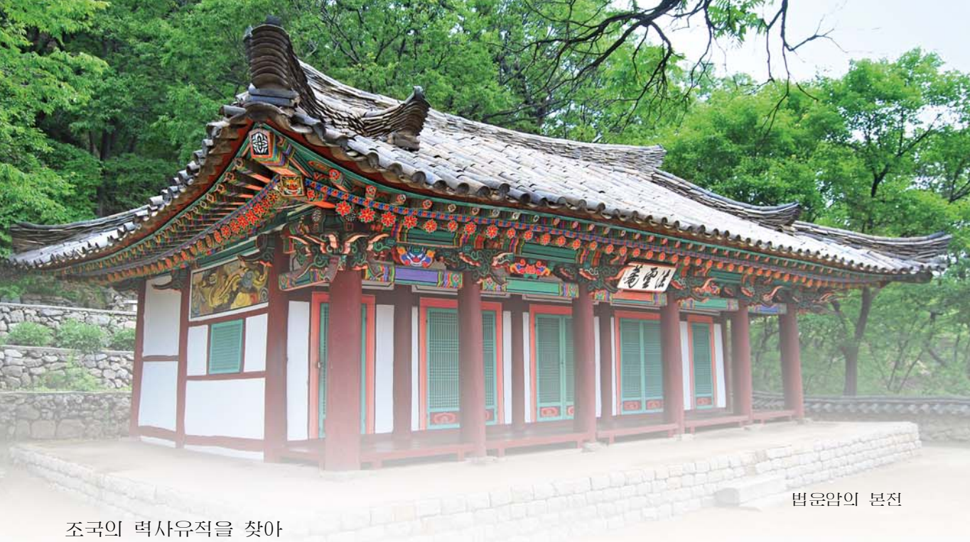
조국의 력사유적을 찾아