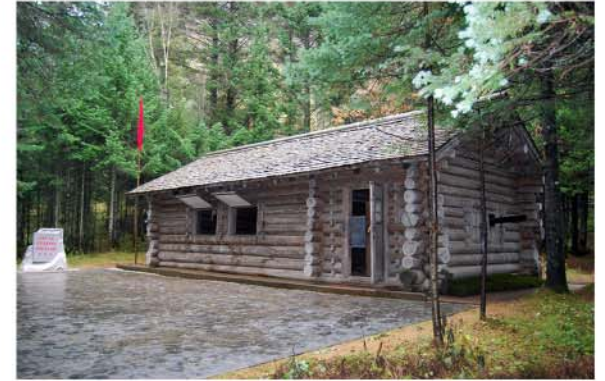
위대한 수령 김일성동지께서 계시던 백두산밀영사령부

있는 산이며 조선로동당의 혁명전통의 억센 뿌리가 내리고 찬란한 미래의 해돋이가 시작된 혁명의 성산이다.