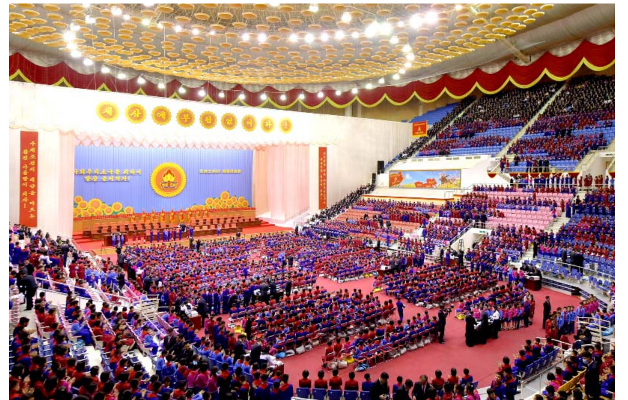
경애하는 김정은동지께서 조선소년단 제9차대회 대표들에게 보내주신 선물을 전달하는 모임

수도 평양으로부터 두메산골, 외진 섬마을에 이르기까지 전국의 모든 소학교, 대학의 신입생들은 새 학년도를 맞으며 보기 좋고 몸에 꼭 맞는 새 교복과 신발, 가방을 받아안았으며 전국의 학원원아들과 섬마을, 산골분교의 학생들 모두가 학용품세트를 받아안았다.