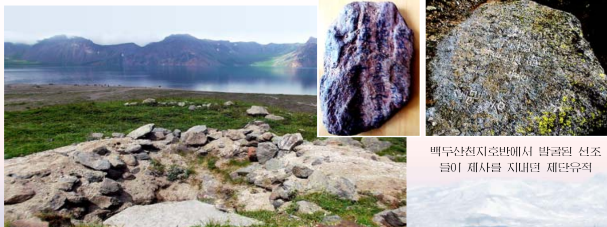
백두산천지호반에서 발굴된 선조들이 제사를 지내던 제단유적

뿐만아니라 위대한 수령님과 위대한 장군님에 대한 수많은 신비로운 전설을 간직한 려사의 산으로 그 이름을 떨치고있다.