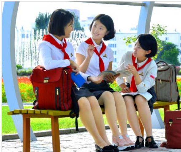
서로 도와주며 지식의 탑을 쌓아가고있는 학생들

걸보기에도 훌륭하고 멋진 학용품세트안에는 《해바라기》상표를 단 각종 연필, 지우개, 크레용, 수채화구와 중성필, 수정띠를 비롯하여 10여종에 백수십점에 달하는 각종 학용품들이 짝 들어차있었다.