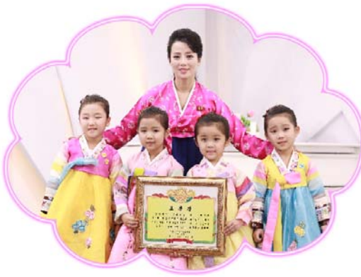
2023년에 진행된 전국유치원어린이예술축전 민족기악부분에서 1등을 쟁취한 형제산구역 서포1유치원 어린이들

그는 이렇게 이야기하였다. 《우리 가정은 3대를 이어오는 교육자가정이다. 어려서부터 어머니가 교정에서 올려온 가야금의 유정한 소리를 들으며 자라난 나는 가야금을 유산으로 물려받았다. 민족악기교육은 내가 가정의 대를 잇는 문제만이 아니라 민족음악의 대를 잇는 문제이다. 나는 앞으로도 나라의 민족음악을 떠메고나갈 민족악기연주가들을 많이 키워내겠다.》