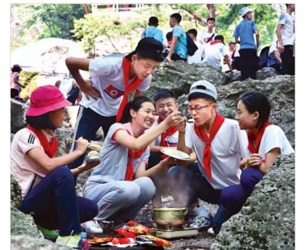
평양시묘향산등산소년단야영소에서 즐거운 야영의 나날을 보내고있는 소년단원들