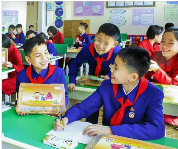
개학날을 맞으며 학용품세트를 받아안은 평양중등 학원 원아들