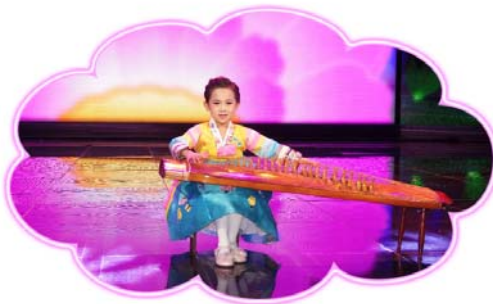
TV로 방영된 아동예술무대에 출연한 형제산구역 서포1유치원 어린이

국아동음악방송예술무대, 뛰어난 재능을 가진 전국유치원어린이들의 경연에서 특등, 1등, 최우수상을 련이어 받았으며 TV와 신문, 방송으로 널리 소개되었다.