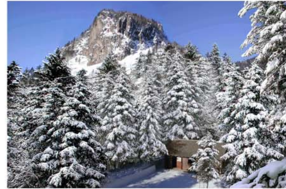
정일봉앞에는 위대한 령도자 김정일동지께서 탄생하신 백두산밀영고향집이 자리잡고있다.

백두산은 20년간 풍찬로숙하시면서 항일혁명투쟁을 승리에로 이끄시여 조국해방을 안아오신 위대한 수령 김일성동지의 혁명력사가 깃들어