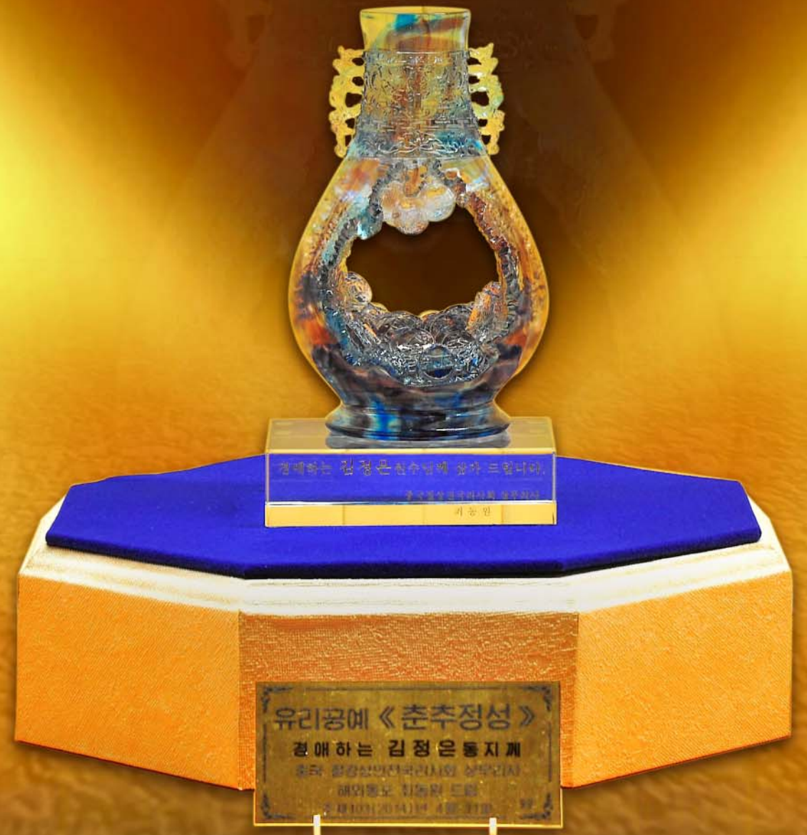
유리공예 《춘추정성》 경애하는 김정은동지께 수도 함양시인민대학사범대학생 최동원 해외동포 최동원 드림 주체103(2014)년 4월 19일